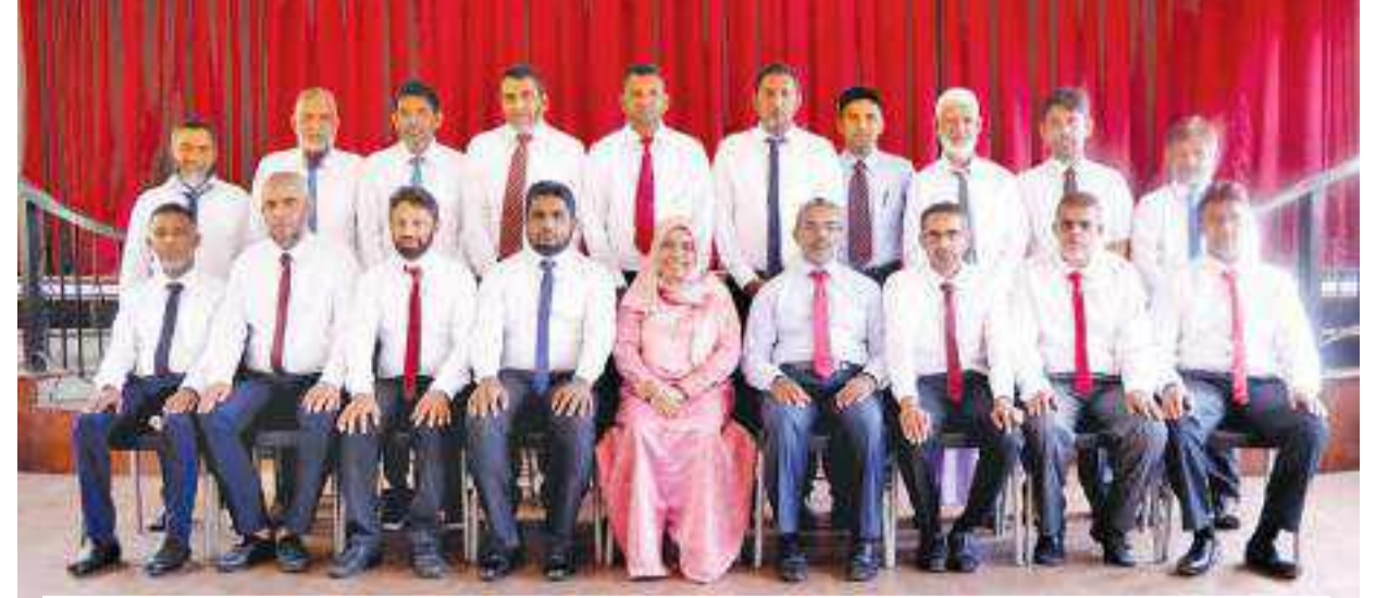
THE SCHOOL DEVELOPMENT EXECUTIVE & SUB COMMITTEE