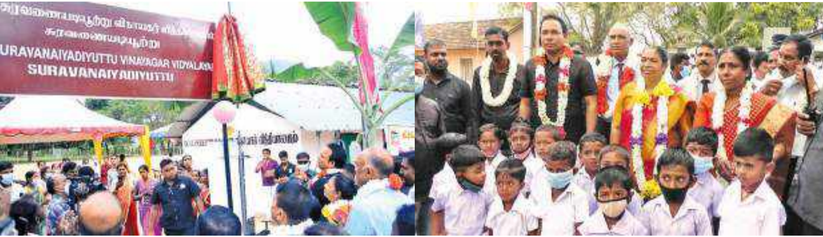
(மட்டக்களப்பு சுழற்சி, கல்வடி குறாப், பெரியபோர்தீவு தினகரன் நிருபர்கள்)