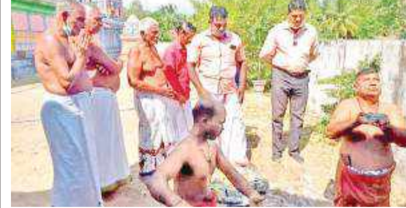
(திருக்கோவில் தினகரன் நிருபர்)

வரலாற்று பெருமை பெற்று விளங்கும் அருள்மிகு திருக்கோவில் ஸ்ரீசித்திரவேலாயுத சுவாமிய ஆலயத்திற்கான திருச்சுற்று மண்டப கோட்டைக்கான அடிக்கல் நட்டும் நிகழ்வு ஆலயத்தில் திகங்க்கிழமை (28) இடம்பெற்றது. இந்நிகழ்வு ஆலய தலைவர் எஸ். கரேஸ் தலைமையில் ஆலய வடக்கு திசையில் கபவேளையில் இடம்பெற்றது. இதன்போது ஆலய குரு சிவமூர்