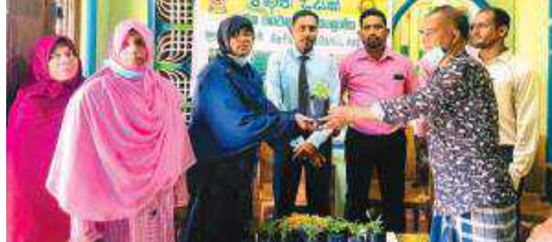
(பெரியநீலாவணை விசேட நிருபர்)

பொருளாதார சவால்களுக்கு முகங்கொடுத்துள்ளனர் உணவு உற்பத்தியை உயர்த்துவதற்காக வீடுகளின் மட்டத்தில் பொதுமக்களின் பங்களிப்பை பெற்று தேசிய கொள்கை அமுல்படுத்தி, நகர்நகர் மரக்கன்றுகள், பழவகைகள், கீரை வகைகள், கிழங்கு வகைகள் உள்ளிட்ட பயிர்களை தக்தமது வீட்டுத்தோட்டத்திலிருந்தே பெற்றுக் கொள்ளலாம். கல்முனைக்குடி சமுர்த்தி வங்கி வலய பிரிவில் தெரிவு செய்யப்