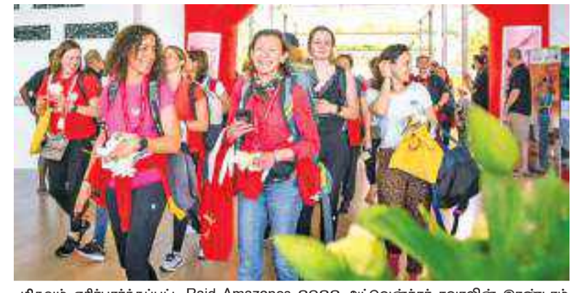
மிகவும் எதிர்பார்க்கப்பட்ட Raid Amozes 2022 அட்வென்ச்சர் சவாலின் இரண்டாம் கட்டம் 214 பங்கேற்பாளர்களுடன் ஆரம்பமானது. இதில் 214 பெண்கள் இலங்கையைச் சுற்றி சைக்கிள் சவாரி மற்றும் ஓட்டம் மூலம் பயணம் செய்ய உள்ளனர். மார்ச் 28 முதல் ஏப்ரல் 6 வரை சிரியாவில் நடைபெறும். இதில் பங்கேற்கும் வெளிநாட்டு வீரர்களுக்கு பாரம்பரிய கலாசார பொழுதுபோக்குகளுடன் வரவேற்பு அளிக்கப்பட்டது.