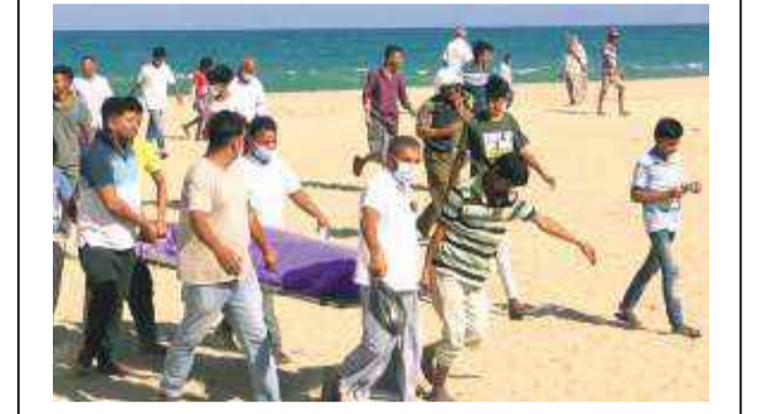
(அட்டாளச்சேனை தினகரன், அக்கரைப்பற்று மேற்கு தினகரன் நிருபர்கள்)

அக்கரைப்பற்று கடற்கரைப் பிரதேசத்தில் மீன்பிடித் தொழிலில் ஈடுபட்டிருந்த மீனவர்களின் வலையில், இனந்தெரியாத நபரொருவரின் சடலமொன்று செய்வாய்க்கிழமை (29) மீட்கப்பட்டதாக அக்கரைப்பற்று பொலிஸார் தெரிவித்தனர். அக்கரைப்பற்று கடற்கரைப் பிரதேசத்தில் வழமையான போன்று கரையவையில் மீன்பிடி நடவடிக்கையில் ஈடுபட்டிருந்த போதே, குறித்த சடலம் மீனவர்களின் வலையில் அகப்பட்டதாக தெரிவிக்கப்படுகின்றது. கரையவையின் மீனவர்கள் தமது வலையினை கரைக்கு ஒதுக்கிக் கொண்டிருந்த போது சடலம் பொன்று வலைக்குள் இருப்பதை அறிந்த மீனவர்கள், சடலத்தினை கரைக்கு ஒதுக்கியுள்ளனர். கரை