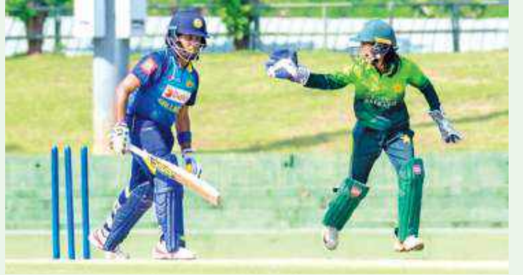
மிங்கமில் நடைபெறவுள்ள (ஜூலை, ஆகஸ்ட்) பொதுநலவாய விளையாட்டு விழா மற்றும் சீனாவில் நடைபெறவுள்ள ஆசிய விளையாட்டு விழா (செப்டம்பர்) ஆகியவற்றுக்கு தகுதிபெறுவதற்கான முக்கிய தொடராக அமையவுள்ளது. கடந்த 1998ம் ஆண்டுக்கு பின்னர்

பாகிஸ்தான் மகளிர் மற்றும் இலங்கை மகளிர்க்கு இடையிலான இந்த தொடர் கடந்த வருடம் நடைபெறவிருந்த போதும், பாகிஸ்தான் கிரிக்கெட் சபையில் ஏற்பட்ட மாற்றங்கள் காரணமாக ஒத்திவைக்கப்பட்டிருந்தது. அதேநேரம் இந்த தொடரானது பேர்