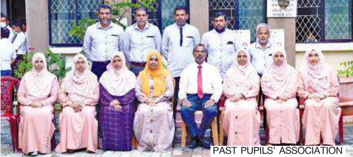
PAST PUPILS' ASSOCIATION

உலக வங்கியின் அனுசரணையுடன் மேற்கொள்ளப்படும் GEPM எனப்படும் பொதுக்கல்வி நலமையமாகக் கள் நிகழ்ச்சித்திட்டத்தில் மேற்பார்வைக்குரிய மாற்றிப் பாடசாலையாக உள்வாங்கப்பட்டிருப்பது விஷேட அம்சமாகும். இத்திட்டத்தின் கீழ் விஷேடமாக கணிதப்பாடத்தின் அபிவிருத்திக்கு முக்கியத்துவம் அளிக்கப்பட்டுள்ளது. அத்துடன் மத்திய மாகாணத்தின் SBPTD எனப்படும் பாடசாலை மட்ட ஆசிரியர் தொழில்சார் வான்மை அபிவிருத்தி நிகழ்ச்சித்திட்டத்திற்கு தெரிவு செய்யப்பட்டுள்ள 25 பாடசாலைகளுள் ஒன்றாகத் திகழ்வது சிறப்பம்சமாகும். மேலும் SESIP எனப்படும் 2ஆம் நிலைக்கல்வி பகுதிசார் மேம்பாட்டுத்திட்டத்தின் கீழ் இப்பாடசாலை தெரிவு செய்யப்பட்டுள்ளது.