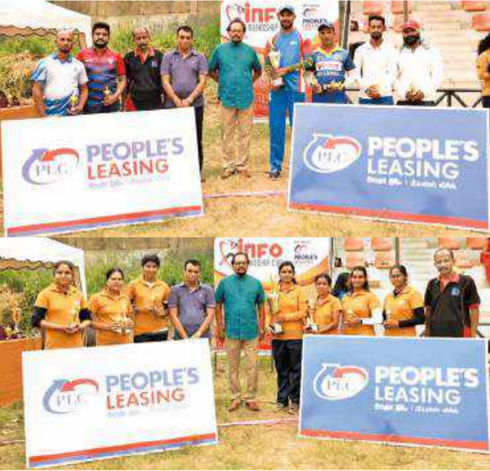
அரசாங்க தகவல் திணைக்களத்தில் சேவை புரியும் பணியாளர்களுக்கு இடையில் வருபாந்தம் நடாத்தப்பட்டு கிளர் வம்பென்று கிரிக்கெட் போட்டி ஒவ்வொரு வருடமும் நடத்தப்படுவது குறிப்பிடத்தக்கது. கடந்த 26ம் திகதி பல்ஹேன்ஸ்கொட மகாமாத்ய வித்தியாலய மைதானத்தில் இடம்பெற்றது. பீப்பல் லீசிங் அனுசரணையில் இடம்பெற்ற இந்த போட்டியில் ஆண்கள் பிரிவில் பப்லிசிட்டி லயன்ஸ் அணி சம்பியனாக தெரிவான அதேவேளை மகளிர் பிரிவில் இன்போ டைட்ரல் அணி சம்பியனாக தெரிவானது.