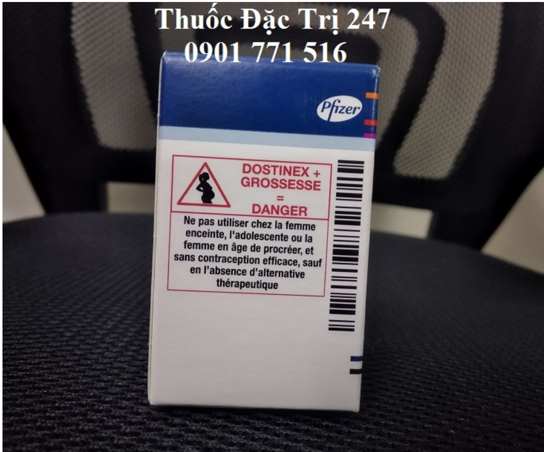
Thuốc Dostinex 0.5mg Cabergoline điều trị chứng vô sinh ở phụ nữ – Thuốc đặc trị 247 (2)