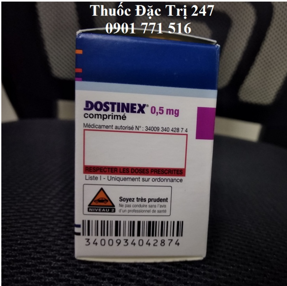
Thuốc Dostinex 0.5mg Cabergoline điều trị chứng vô sinh ở phụ nữ – Thuốc đặc trị 247 (3)