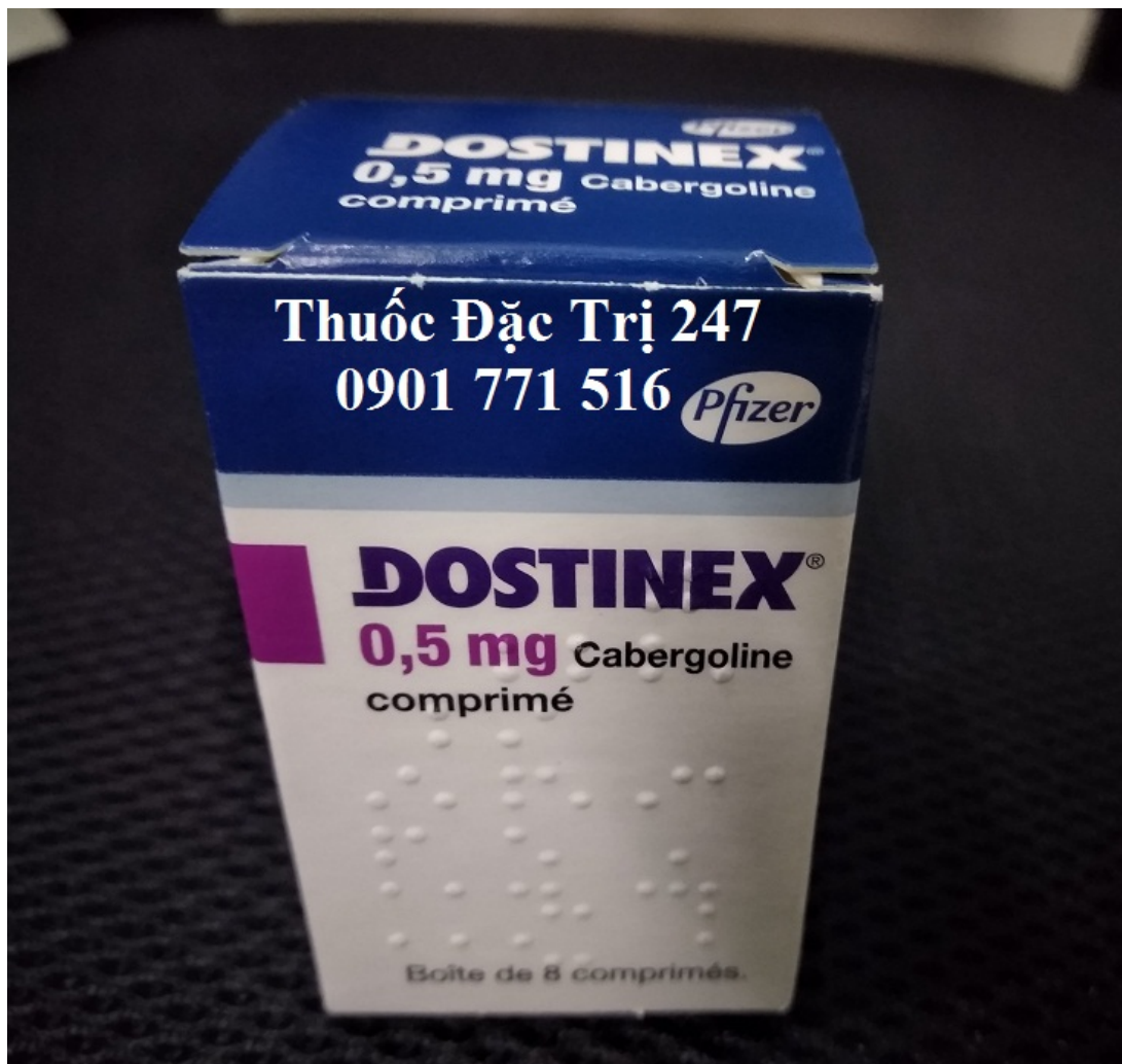
Thuốc Dostinex 0.5mg Cabergoline điều trị chứng vô sinh ở phụ nữ - Thuốc đặc trị 247

Thuốc Dostinex 0.5 Cabergoline là 1 chất dẫn xuất từ nấm cựa gà (ergot de seigle) và là chất đồng vận (agonist) khá chọn lọc thụ thể dopamine D2, chất ức chế mạnh tiết prolactin từ tuyến đồi (hypophyse). Ngoài chỉ định dùng điều trị bệnh Parkinson, cabergoline còn dùng để điều trị chứng cao prolactin huyết (hyperprolactinemia).