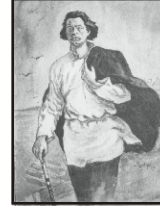
- செயல் - அதுவே சிறந்த சொல்

பொதுவுடைமை தத்துவ, அரசியல், பண்பாட்டு இலக்கிய இதழ்