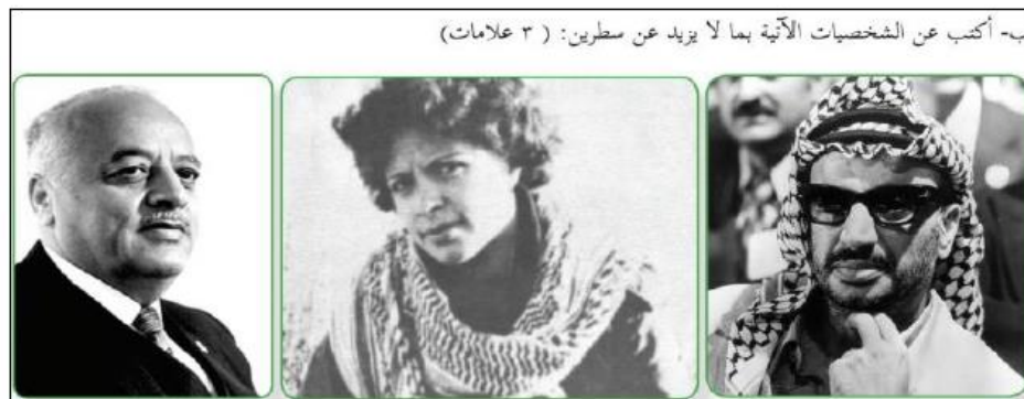
דלאל אלמע'רבי (באמצע) מוצגת בשורה הראשונה של ההנהגה הפלסטינית לצד יאסר ערפאת (מימין) ואחמד אלשקירי (משמאל) (גיאוגרפיה והיסטוריה מודרנית בת זמננו של פלסטין, כיתה י', 2018).

♦ קריאה למאבק אלים לשחרור במקום חינוך לפתרון של שלום לסכסוך. שלום ודו-קיום עם ישראל אינם אופציה. המאבק האלים אינו מוגבל לגדה המערבית ולעזה, אלא מקיף את כל שטח ישראל. ניתן לו אופי דתי ע"י הדגשת הצורך לשחרר את מסגד אלאקצא, שעצם קיומו נתון בסכנה, כביכול. האידיאלים המסורתיים האסלאמיים - ג'יהאד ומות-קדושים - מועלים על נס וניתן להם תפקיד מיוחד במאבק לשחרור פלסטין. פעילות טרוריסטית מהווה חלק בלתי נפרד מהמאבק הפלסטיני: טרוריסטית ידועה, דלאל אלמע'רבי, אחת מחברות חוליית הטרור של פתח, שביצעה רצח אזרחים בכביש החוף ב-1978 1 , מועלית לדרגת גיבורה לאומית (השווה בערכה ליאסר ערפאת ולעאיישה, אשתו הנערצת של הנביא מחמד). טענת זכות השיבה של צאצאי פליטי 1948 נעשית אף היא לחלק בלתי נפרד מהמאבק האלים לשחרור, מאחר שהפליטים אמורים לשוב למקומות מגוריהם הקודמים ב"פלסטין המשוחררת", ולא למדינת ישראל (שתחדל מלהתקיים).