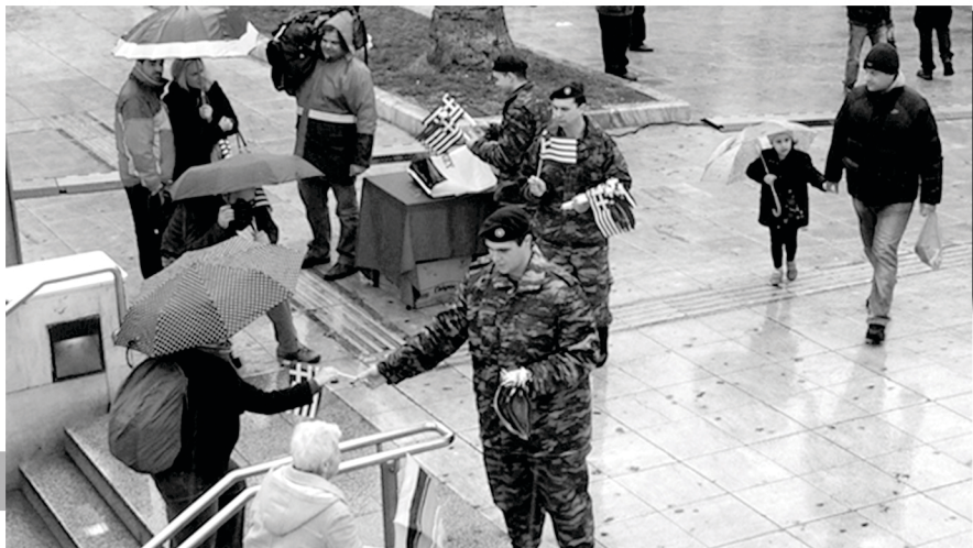
Φώτο από την παρέλαση της 25ης μάρτη. Τσάμπα τα γράφουμε, η εικόνα τα λείει όλα. Κι ένα σχόλιο: Εθνική ενότητα και κιτς πηγαίνουν πάντα μαζί...

Μα, τα αφεντικά φυσικά! Τα ντόπια αφεντικά, που συνεχίζουν και θα συνεχίζουν την επίθεσή τους στην (πολυεθνική) εργατική τάξη της ελληνικής επικράτειας. Τώρα όμως ποιος θα πει κάτι; Είμαστε όλοι μαζί ενάντια στο γερμανικό ζυγό! Κι αυτό το "όλοι μαζί" χωράει όλη την διαταξικότητα του κόσμου. Χωράει μικρά και μεγάλα αφεντικά που μας ξεζουμάνε, χωράει ρατσιστές/σεξιστές μικροαστούς και φασίστες. Γιατί τα voucher*, τα 490 ευρώ μισθός, τα στρατόπεδα συγκέντρωσης, τα ναυάγια, το ξύλο από τους μπάτσους κι όλα τα δεινά των "μνημονιακών" κυβερνήσεων είναι εδώ αλλά πλέον η (με εθνική υπερηφάνεια) τσαμπουκαλεμένη μας κυβέρνηση χτυπάει το χέρι στο τραπέζι του eurogroup!