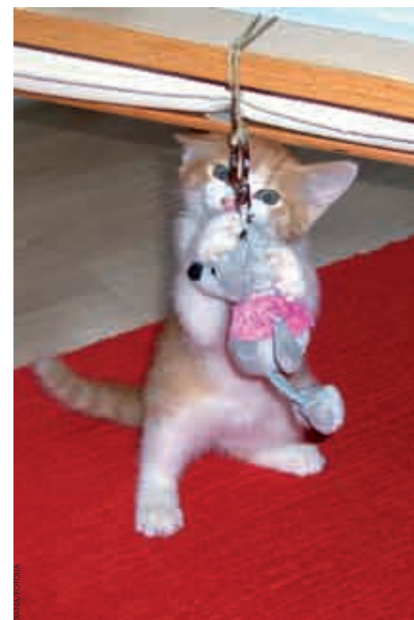
Pour jouer à chasser, tous les objets sont bons, à condition d'en changer régulièrement pour renouveler l'intérêt de l'animal.