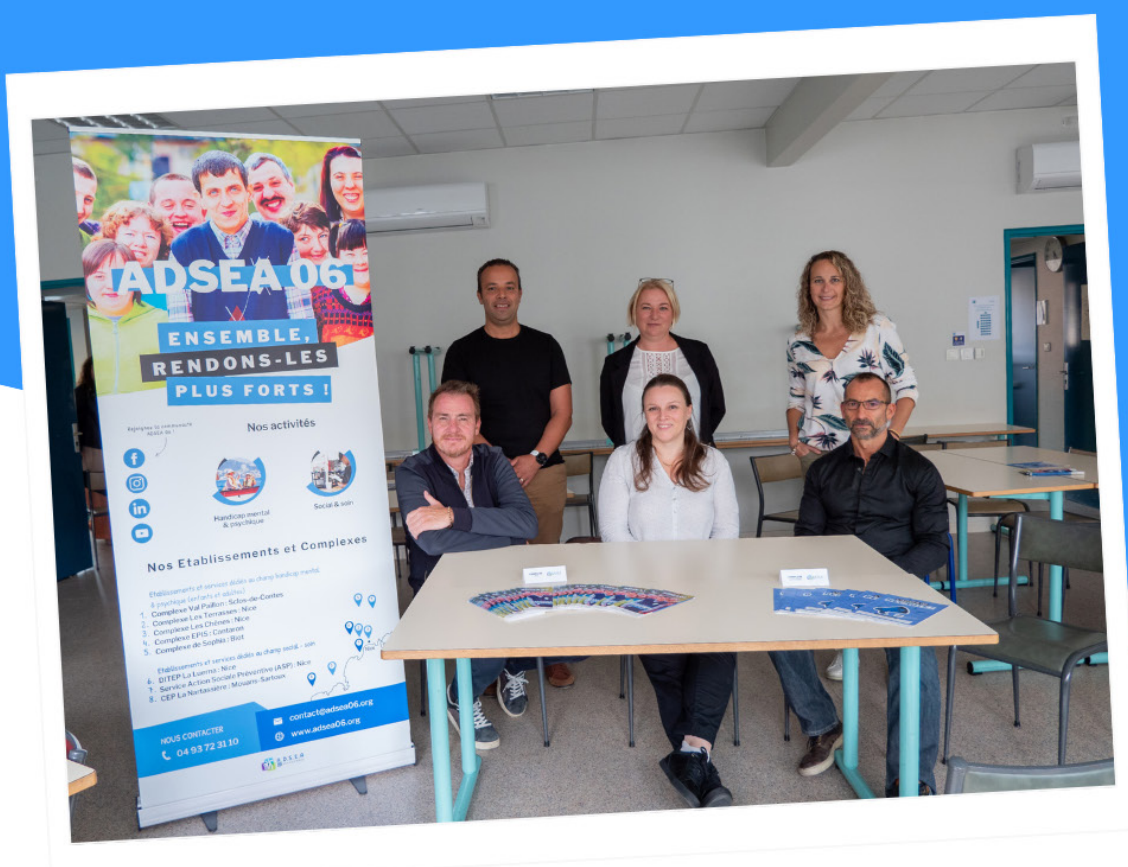
Forum des Institutions de Hétis