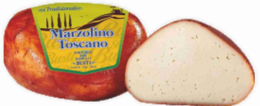
Marzolino Toscano Caseificio Busti al kg € 11,90