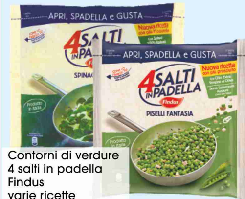
Contorni di verdure 4 salti in padella Findus varie ricette g 450 al kg € 5,98