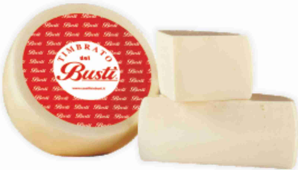
Pecorino Timbrato Caseificio Busti al kg € 11,90