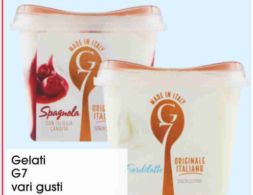
Gelati G7 vari gusti g 500 al kg € 4,58