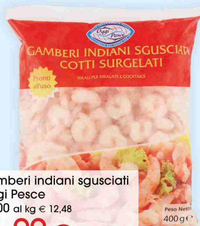
Gamberi indiani sgusciati Oggi Pesce g 400 al kg € 12,48