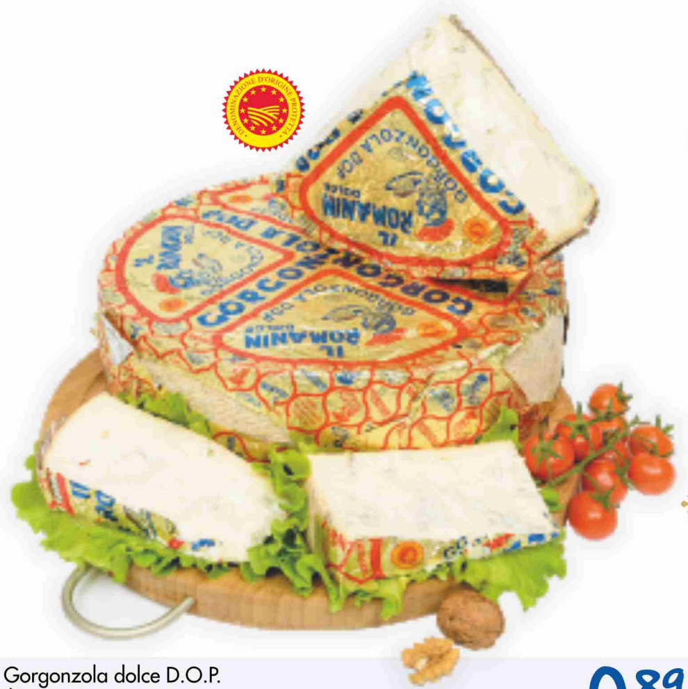
Gorgonzola dolce D.O.P. Il Romanin al kg € 8,90