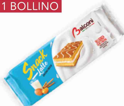
Snack al latte Balconi g 280