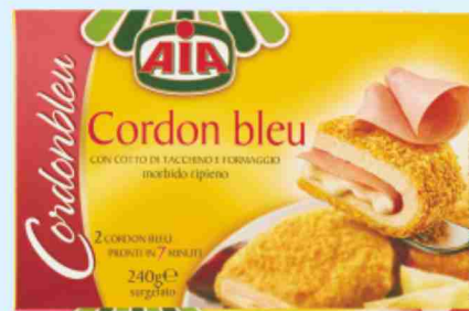
Cordon bleu Aia g 240 al kg € 6,21