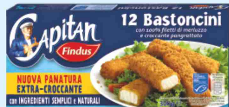
12 Bastoncini di merluzzo Findus g 300 al kg € 9,97