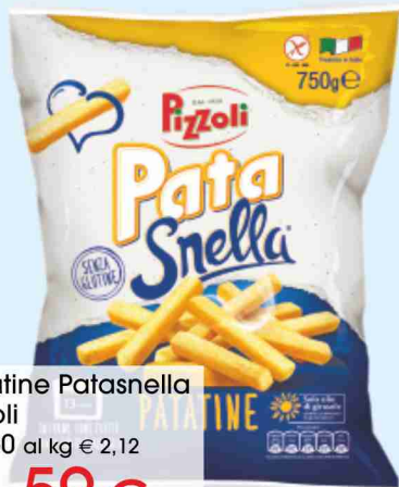
Patine Patasnella Pizzoli g 750 al kg € 2,12