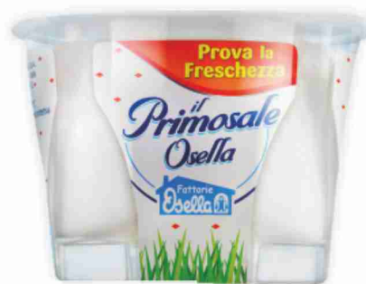
Primosale Osella g 125 al kg € 10,32