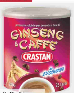
Ginseng & Caffè Crastan senza zucchero, g 200