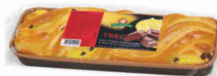
Treccia crema e cioccolato Gecchele g 300