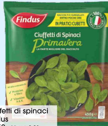
Ciuffetti di spinaci Findus g 450 al kg € 3,31