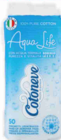
Dischetti levatrucco Aqua Life Cotoneve pezzi 50