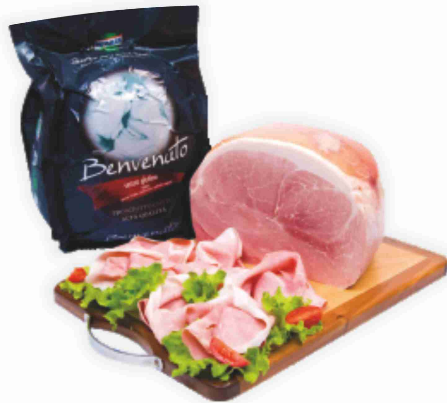
Prosciutto cotto Alta Qualità Benvenuto Kometa al kg € 11,90