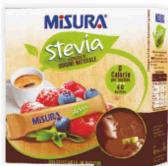
Dolcificante stevia Misura 40 bustine, g 60