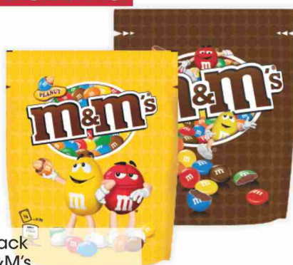
Snack M&M's peanut, chocolate g 200