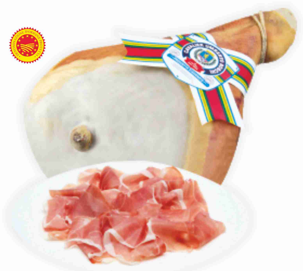
Prosciutto di Parma D.O.P. Cav. Umberto Boschi al kg € 22,90