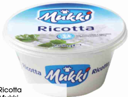
Ricotta Mukki g 250 al kg € 3,96