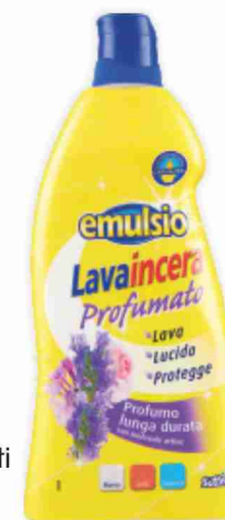
Lavaincera pavimenti Emulsio ml 900