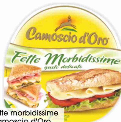
Fette morbidissime Camoscio d'Oro g 150 al kg € 12,60