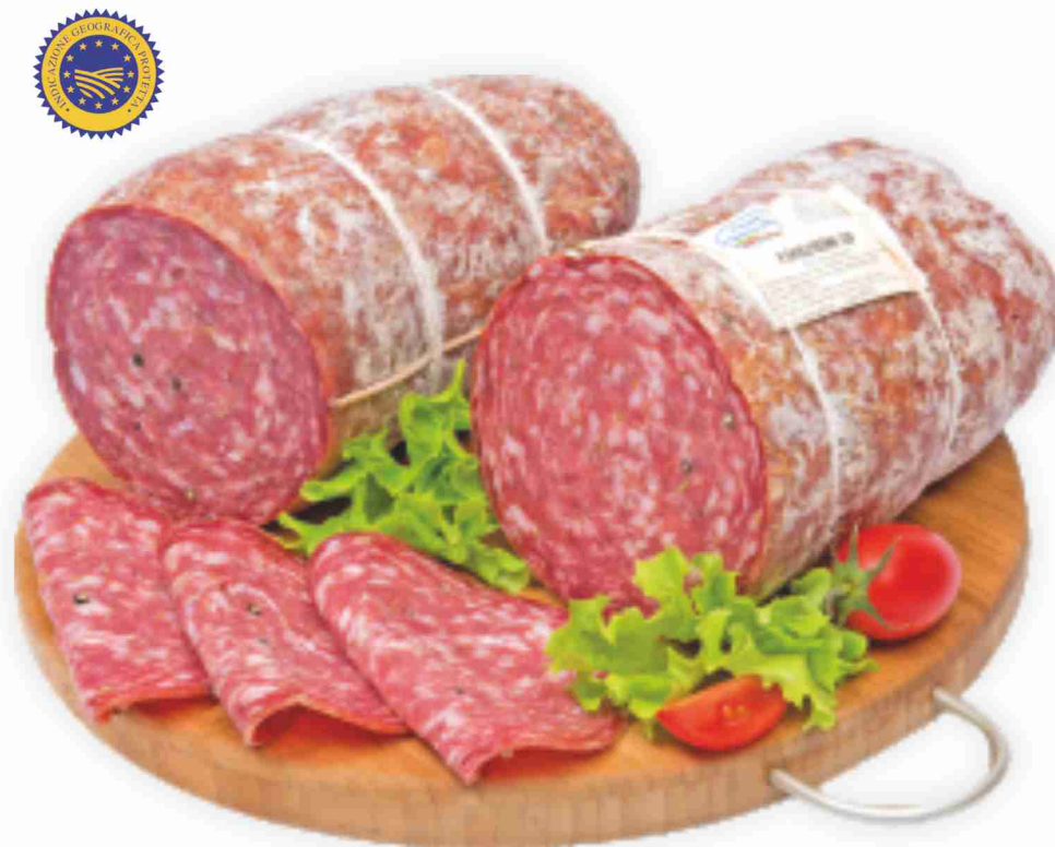
Finocchiona I.G.P. Salumeria Monte San Savino al kg € 8,90