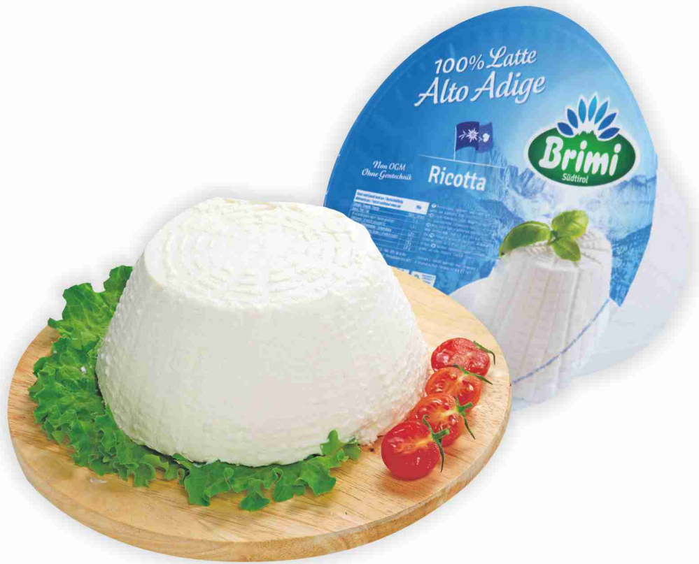
Ricotta Brimi al kg € 4,90