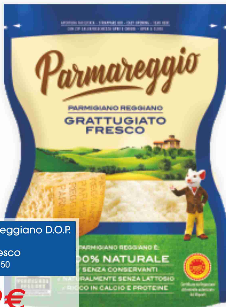
Parmigiano Reggiano D.O.P. Parmareggio grattugiato fresco g 60 al kg € 16,50