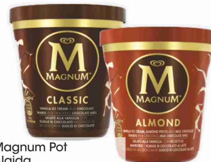
Magnum Pot Algida almond, classic, white g 297

Acquista questi prodotti per ottenere più bollini!