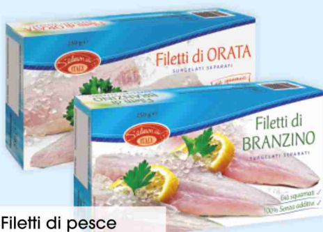
Filetti di pesce Salmon Club branzino, orata g 250 al kg € 17,96