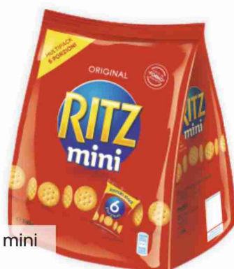
Salatini mini Ritz g 40x6