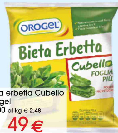
Bieta erbetta Cubello Orogel g 600 al kg € 2,48