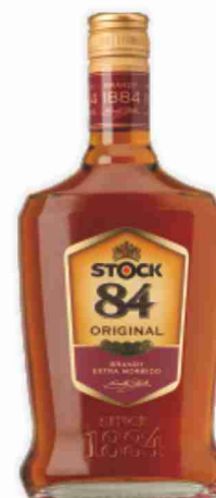
Brandy Original Stock 84 cl 70