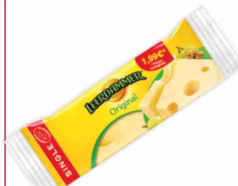
Leerdammer g 150 al kg € 11,27