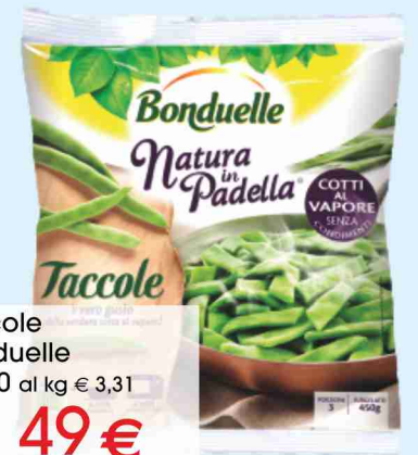
Taccole Bonduelle g 450 al kg € 3,31