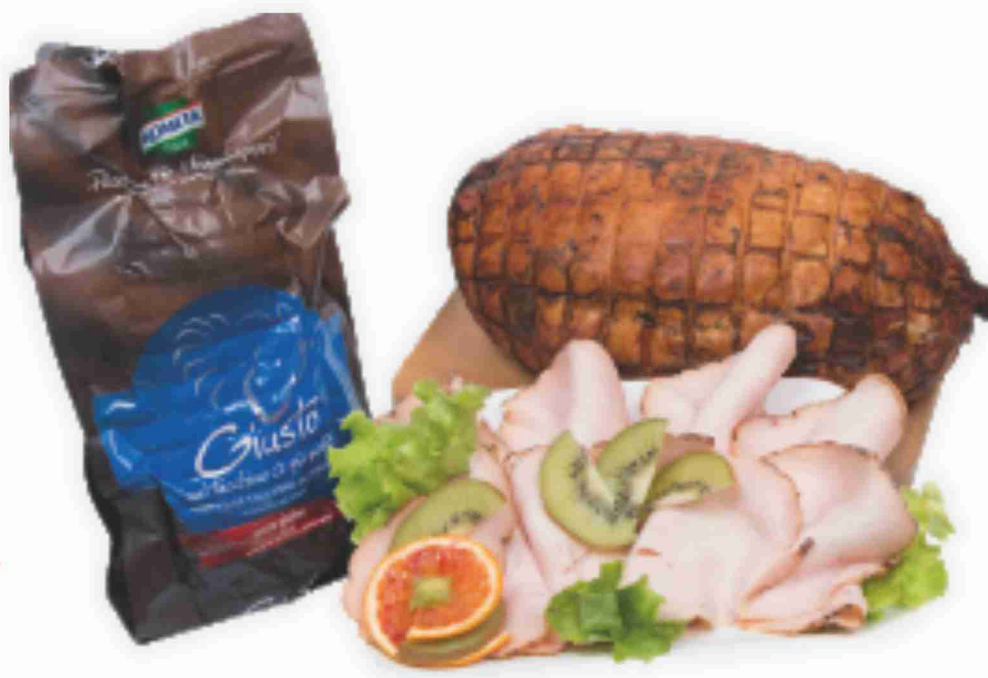
Petto di tacchino rustico Kometa al kg € 12,90