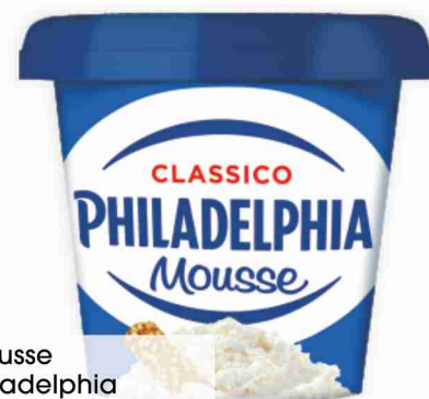
Mousse Philadelphia g 130 al kg € 11,46