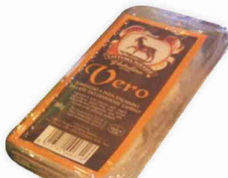
Formaggio di capra Vero Latteria Sociale Valtellina g 160 al kg € 12,44