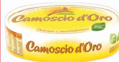
Camoscio d'Oro g 200 al kg € 11,45