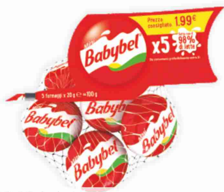
Mini Babybel g 100 al kg € 15,90