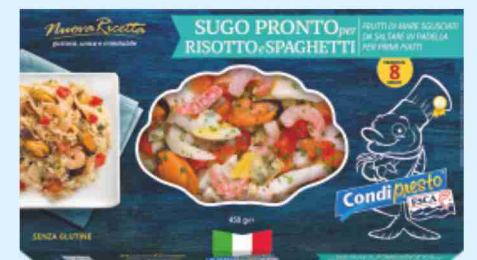
Sugo pronto per risotto e spaghetti Esca g 450 al kg € 6,64