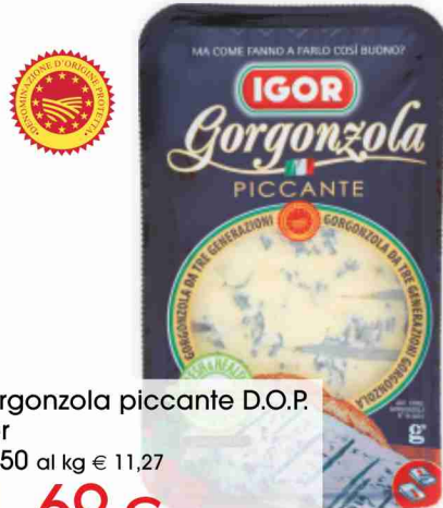
Gorgonzola piccante D.O.P. Igor g 150 al kg € 11,27