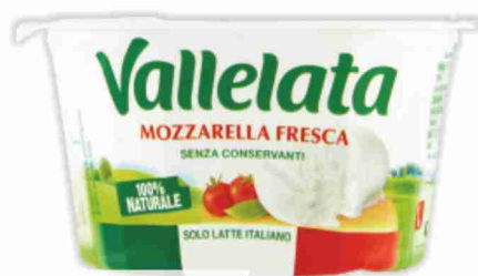
Mozzarella fresca Vallelata g 125 al kg € 8,80