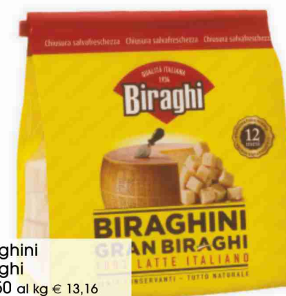
Biraghini Biraghi g 250 al kg € 13,16