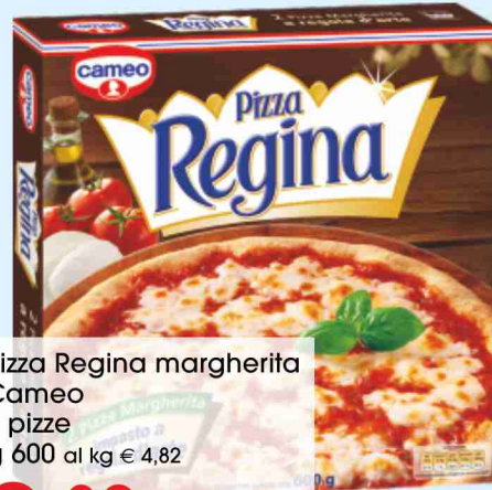
Pizza Regina margherita Cameo 2 pizze g 600 al kg € 4,82