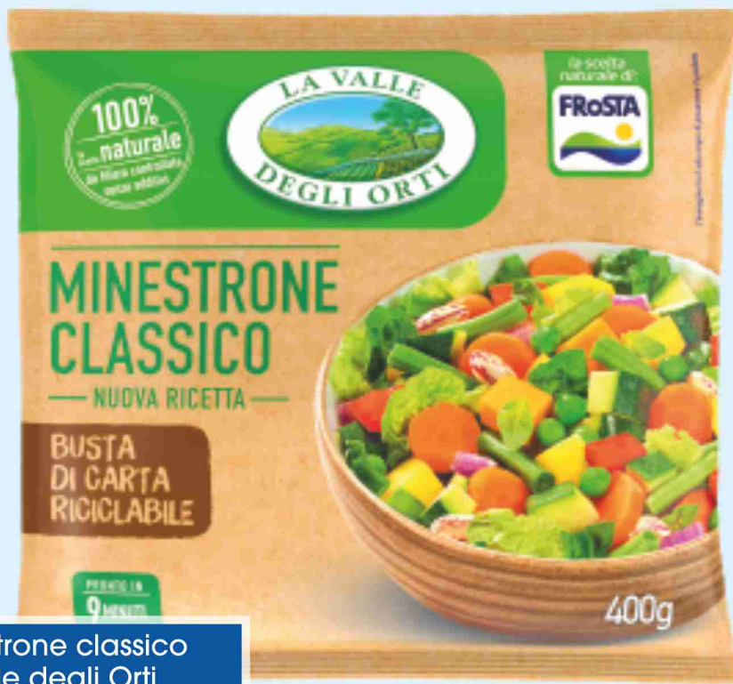
Minestrone classico La Valle degli Orti g 400 al kg € 2,48