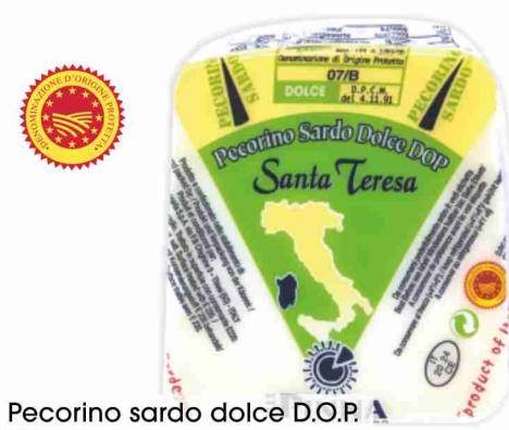
Pecorino sardo dolce D.O.P. Pinna g 200 al kg € 12,45