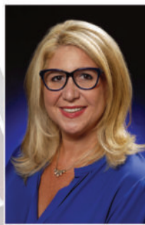
19 лет практики