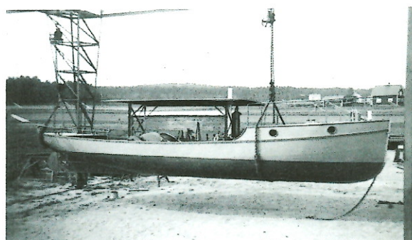
En BV15 båt, samme som Vesle Kari, ferdig laget og klar for oppdrag . Se www.lidwallsbatar.se