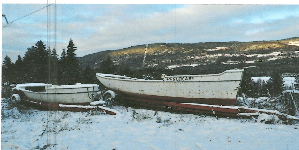
Båtene i vinteropplag rett opp for Sundvold bru. November 2010.