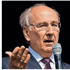
Фундації Temerty, громадянин Канади українсько-го походження (родом з Донеччини).

«Ви всі дуже добре знаєте Львів, знаєте як це є пройтися центром. Ви відчуваєте цю атмосферу нешироких вуличок, будинків, які мають 5 поверхів, і після кожного повороту відкривається щось особливо зворушливе. І тому в цьому місці мало бути щось хороше – у розмірах Львова, в атмосфері цього міста, але з XXI століття. У цьому місці, звідки мала йти комуністична пропаганда і контроль, мало постати щось дуже людське. І в країні, де ми не довіряємо один одному, навіть чверть століття після краху комунізму, ми хотіли, щоби довіра росла, також через архітектуру. Це – гуманне містечко, яке відновлює Богом дану людську гідність», – додав владика Борис Гудзяк.