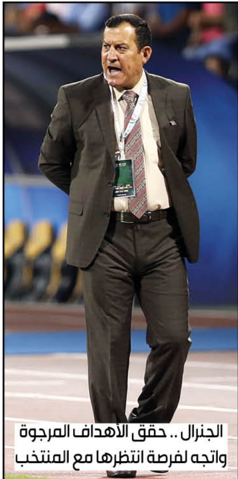
الجنرال .. حقق الأهداف المرجوة واتجه لفرصة انتظرها مع المنتخب