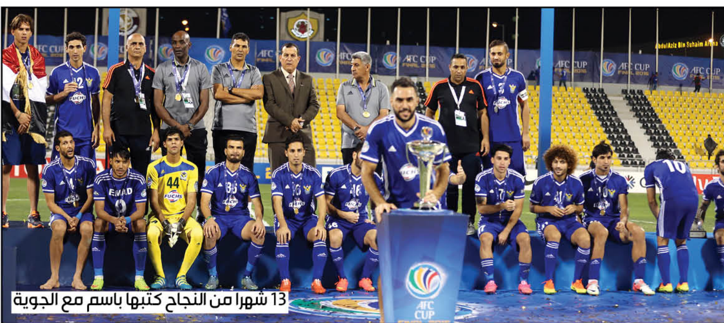
13 شهرا من النجاح كتبها باسم مع الجوية

اقتربت نهاية الموسم بالتزامن مع وجود مباراتين رسميتين متبقيتين للعراق في تصفيات كأس العالم مع تايلاند والإمارات وما يقتضيه الاستعداد لهما ، أصبح الجنرال يجاهر بأنه سيعمل في اتجاه واحد ، وعلينا أن نثمن موقفه على هذا الصعيد ، فهو يستلهم موقفه من المثل الشائع (صاحب بالين كذاب) ، فهو لم يشأ أن يخدع الجوون بالغموض أو العمل في اتجاهين ، ولم يكن مناورا أو مخادعا حين كشف النقاب عن نيته الاستمرار مع المنتخب في فرصة كان ينتظرها طويلا طويلا بعد أن تم حجب هذه الفرصة عنه وهي استحقاقه فيما أتاحت لكثير من المدربين المحليين غيره