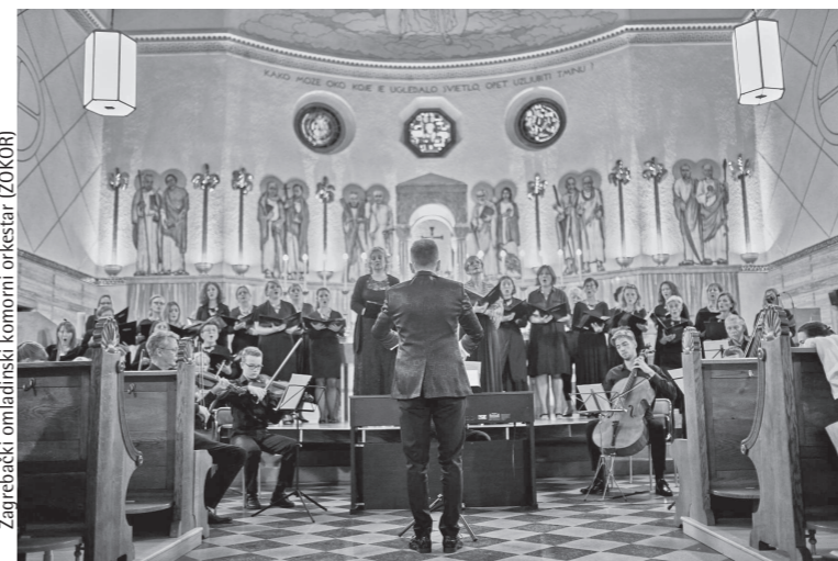
Zagrebački omladinski komorni orkestar (ZOKOR)