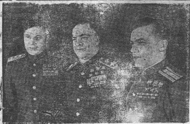
Трижды Герой Советского Союза гвардии полковник А. И. Покрышкин, Маршал Советского Союза Г. К. Жуков и гвардии майор И. Н. Кожедуб.

Фонд № Р-49 «Редакция газеты «Знамя Советов» Шелаболихинского района Алтайского края, с. Шелаболиха». Опись № 1К дел постоянного хранения. Дело № 2 «Контрольные экземпляры газеты «Знамя Советов» с № 1 по № 61 за 1946 год». Л. 47 — статьи «Наш Герой», «Гордитесь своим сыном», «Отважный воин-комсомолец» из газеты «Знамя Советов» от 07.11.1946 № 54.