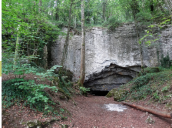
La Porte Aïve

Deze grot werd in het neolithicum als begraafplaats gebruikt. Er werden wapens, muntstukken en skeletten gevonden. In de tweede wereldoorlog werd de grot door het Duitse leger als commandopost gebruikt. De grot heeft een zeer grote zaal en je kan er twee smalle gangen verkennen, de langste is ongeveer dertig meter.