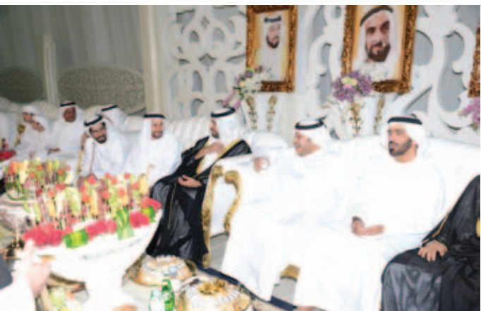
الشيخ سعيد بن طحنون والشيخ سالم بالركاض وفي الصورة الشيخ حمد بالركاض ومحمد بن نعيّف