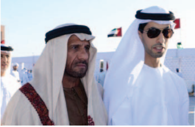
سمو الشيخ خالد بن زايد آل نهيان ومحمد بن نعيّف