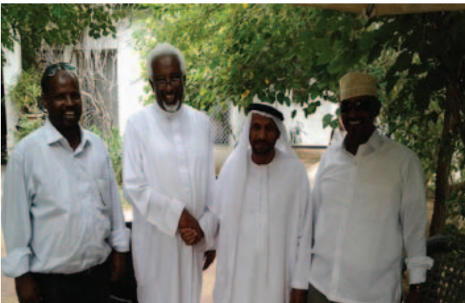
محمد بن نعيّف وإلى يمينه وزير داخلية الصومال وعلي يوسف وأحمد سودي في الصومال