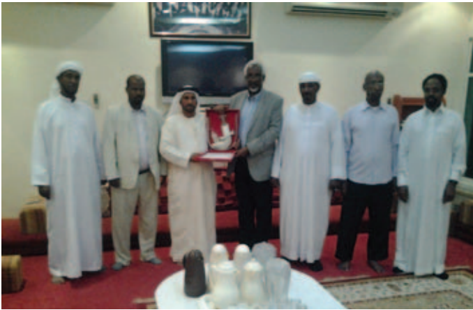
محمد بن نعيف يهدي وزير الداخلية الصومالي خنجر فضي