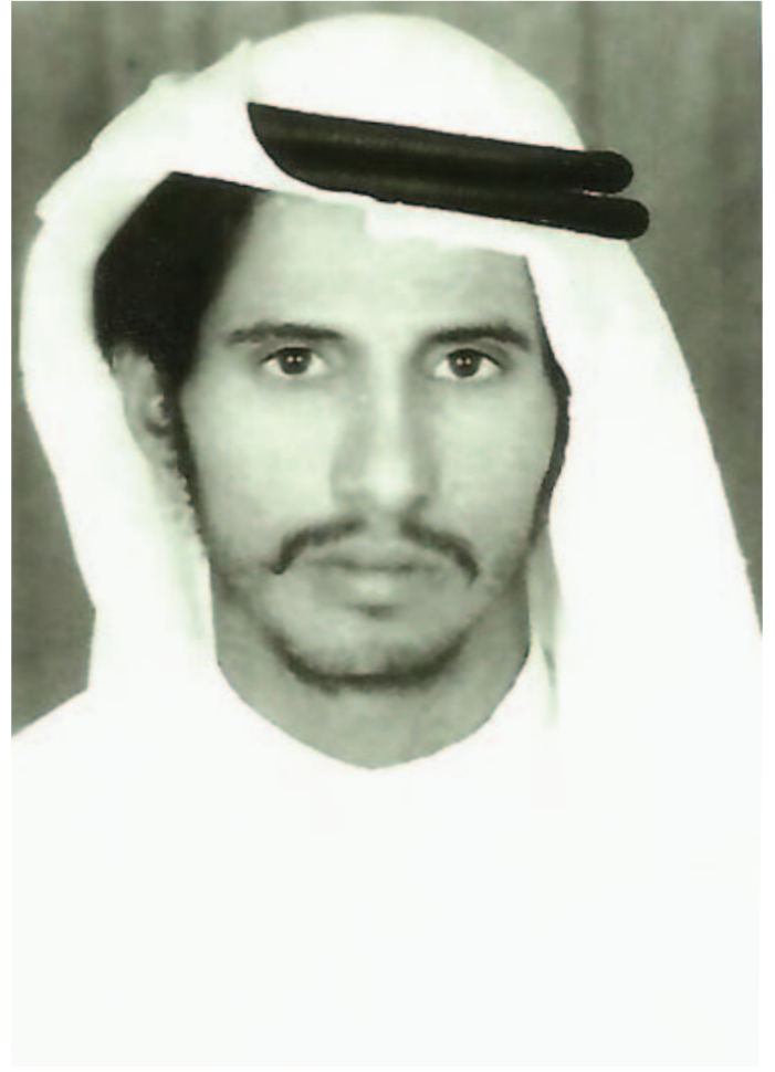
صورة قديمة للمؤلف