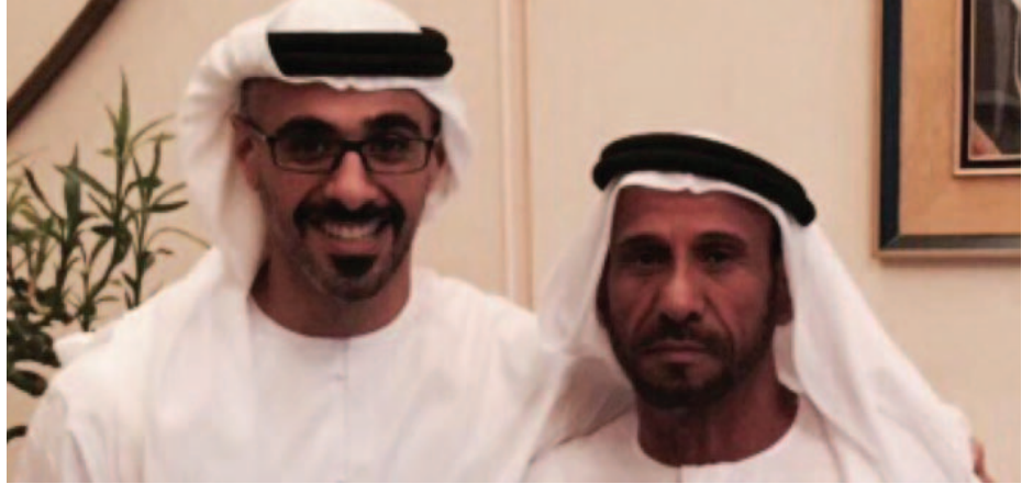
الشيخ خالد بن محمد بن زايد ومحمد بن سيف بن نعيف العامري