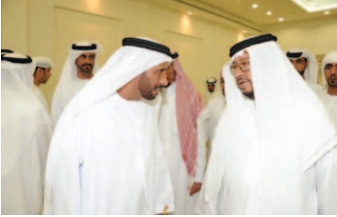
سمو الشيخ سلطان بن زايد ومحمد سيف بن نعييف وفي الصورة الشيخ سالم حمد بالركاض