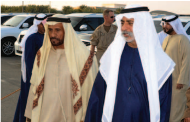
الشيخ نهيان بن مبارك ومحمد بن سيف بن نعييف العامري