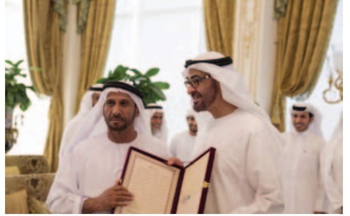
قصيدة من المؤلف مهداة لصاحب السمو الشيخ محمد بن زايد آل نهيان