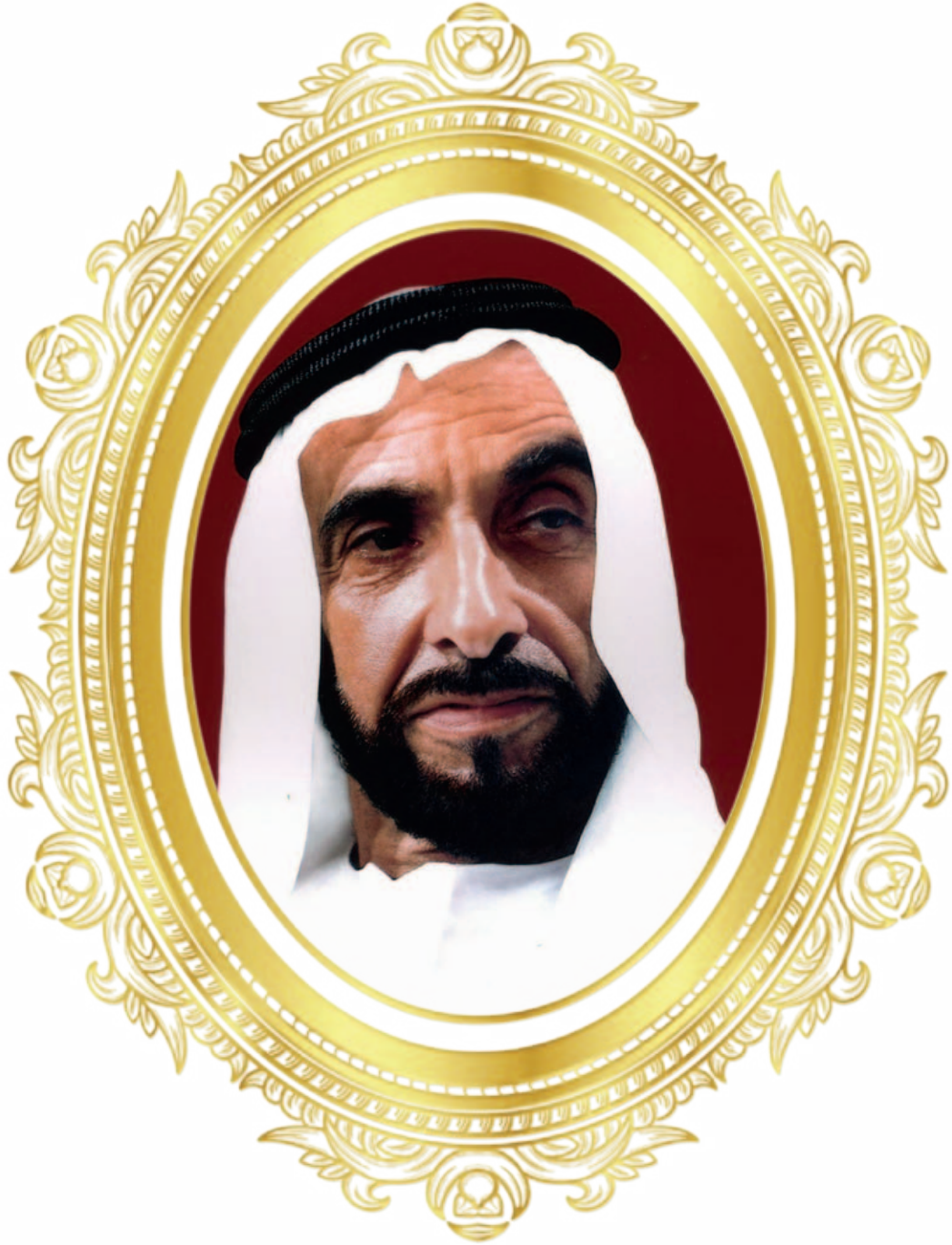
المغفور له الشيخ زايد بن سلطان آل نهيان تغمده الله بواسع رحمته