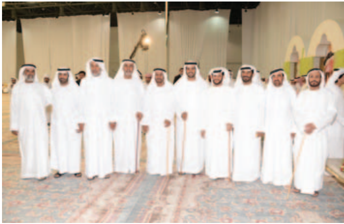
محمد بن نعيّف مع مجموعة من أعيان القبائل