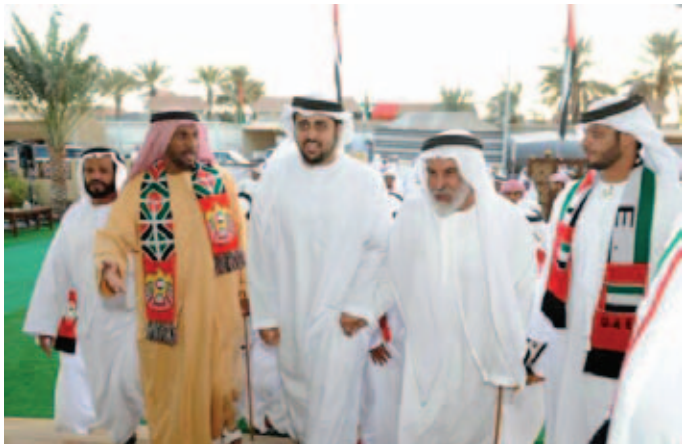
الشيخ ذياب بن محمد بن زايد آل نهيان ومحمد بن عبد الله بن نعيّف ومحمد بن سيف بن نعيّف وحمد بن نعيّف