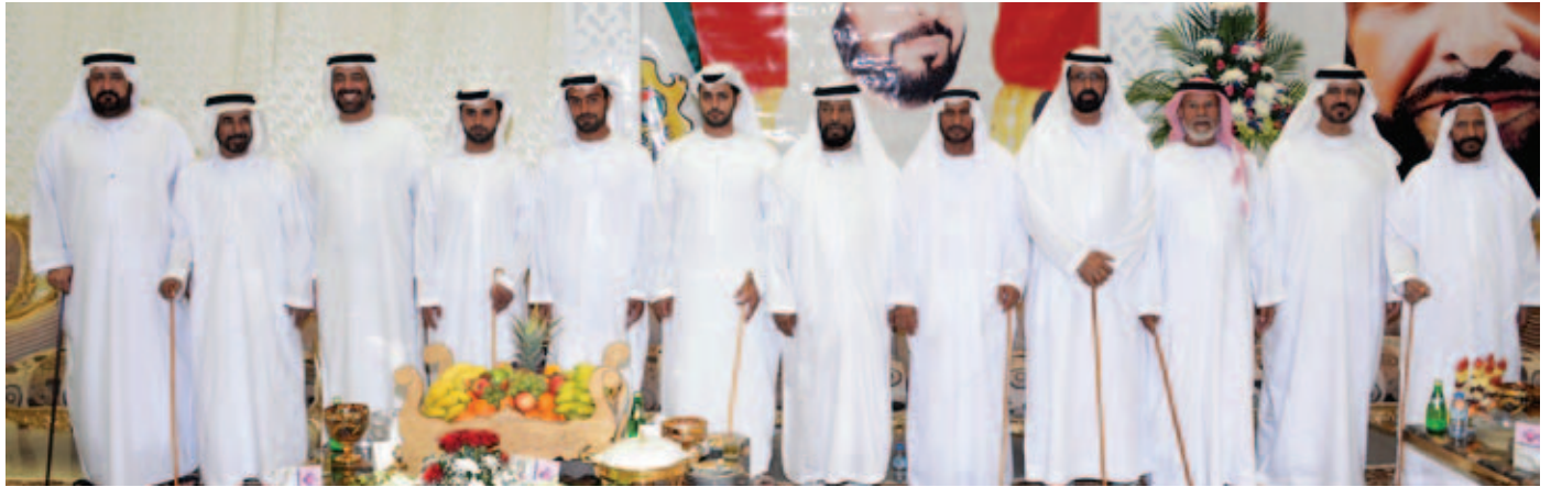
الشيخ محمد بن سعيد آل نهيان والشيخ محمد بالركاض ومحمد بن نعيف والشيخ سالم بالركاض ومجموعة من كبار الشخصيات