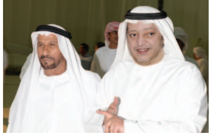
الشيخ سعيد بن طحنون آل نهيان ومحمد بن سيف بن نعيّف