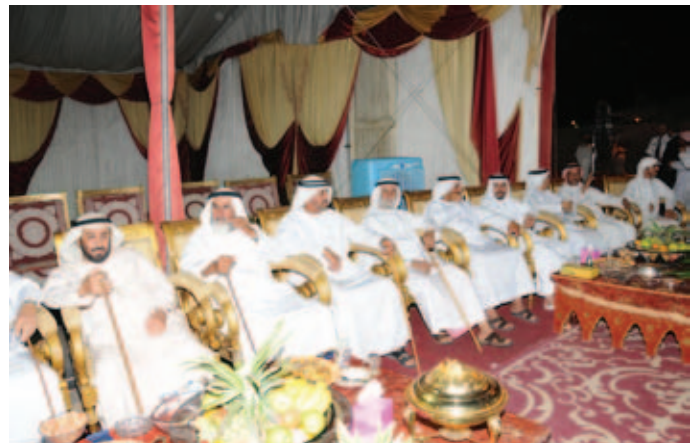
الشيخ ناصر بوقبي ومجموعة من أعيان وشيوخ القبائل أثناء حفل بن نعيّف