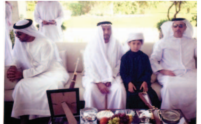
سمو الشيخ سيف بن زايد و سمو الشيخ حامد بن زايد يتوسطهما محمد سيف بن نعييف العامري ونجله سعيد