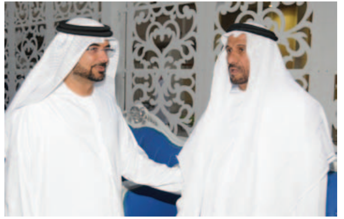
محمد بن سيف بن نعيف وسعادة الدكتور مبارك بن حمد بن مرزوق