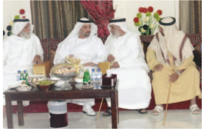
سمو الشيخ حمدان بن زايد ومحمد بن عبد الله بن نعيّف وعلی بن نعيّف ومحمد بن سيف بن نعيّف