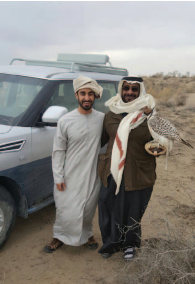
سمو الشيخ حمدان بن محمد بن زايد آل نهيان وحمد بن سالم بن العوف أثناء الصيد