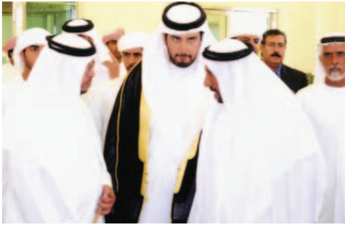
سمو الشيخ سلطان بن زايد والشيخ حمد بالركاض ومحمد بن نعيّف