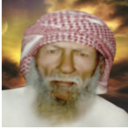
الزعيم سالم بالعرف العامري ( الملقب بأسد الغاية )