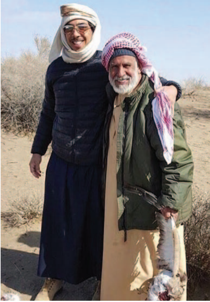
سمو الشيخ منصور بن زايد آل نهيان والمرافق الخاص محمد عبد الله بن نعييف أثناء رحلة صيد