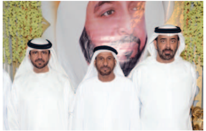
الشيخ سالم بالركاض وسعادة سهيل بن مرزوق يتوسّطهما محمد بن نعيّف