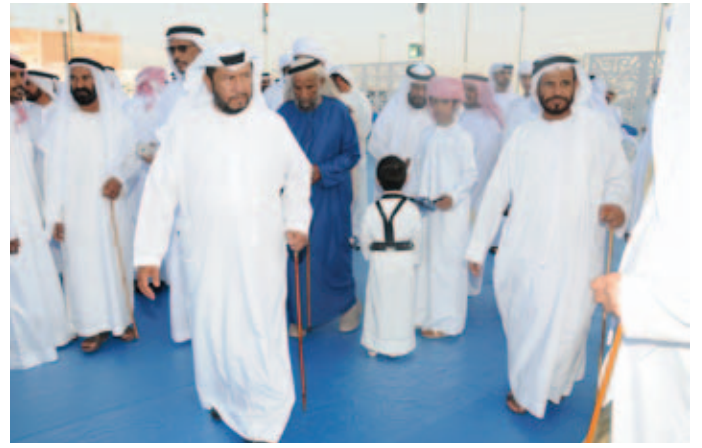
سمو الشيخ سلطان بن زايد ومحمد بن نعيّف وعبد الله بن نصرّة وصالح بن طرشم وسليّم بن شويرب ومجموعة من أعيان البلاد