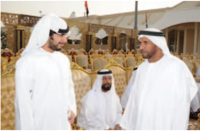
الشيخ زايد بن طحنون ومحمد بن نعيّف وفي الصورة الشيخ محمد بالركاض