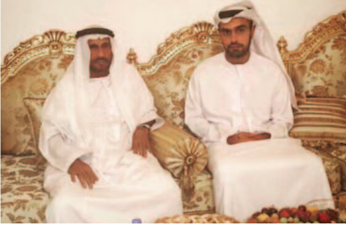
الشيخ محمد بن سعيد آل نهيان يزور محمد بن سيف بن نعيف العامري في مجلسه