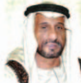
محمد سيف بن نعيّف الغامري

ورحب بن نعيّف، أسعى أيات النهضة والتّجديدات إلى مقام صاحب السمو الشيخ خليفة بن زايد آل نهيان رئيس الدولة، حفظه الله، وإلى صاحب السمو الشيخ محمد بن راشد آل مكتوم نائب رئيس الدولة رئيس مجلس الوزراء حاكم دبي، رعاه الله، وإخوانهما أصحاب السمو الشيخ أعضاء المجلس الأعلى حكام الإمارات، وإلى الفريق أول سمو الشيخ محمد بن زايد آل نهيان ولي عهد أبوظبي نائب القائد الأعلى للقوات المسلحة.