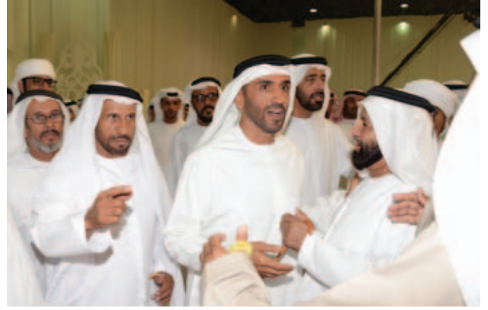
سمو الشيخ نهيان بن زايد وسالم بن غصنه ومحمد بن نعيّف ويظهر في الصورة الشيخ سالم بالركاض وسالم بن زعيتر وسهيل بن نخيرات