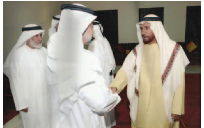
محمد سيف بن نعيف يصافح سمو الشيخ حمدان بن زايد