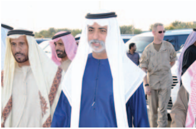
الشيخ نهيان بن مبارك ومحمد بن نعيّف وسعيد بن نعيّف أثناء حفل بن نعيّف