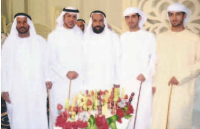
الشيخ منصور بن طحنون وأبناؤه والشيخ حمد بالركاض ومحمد بن سيف بن نعيّف