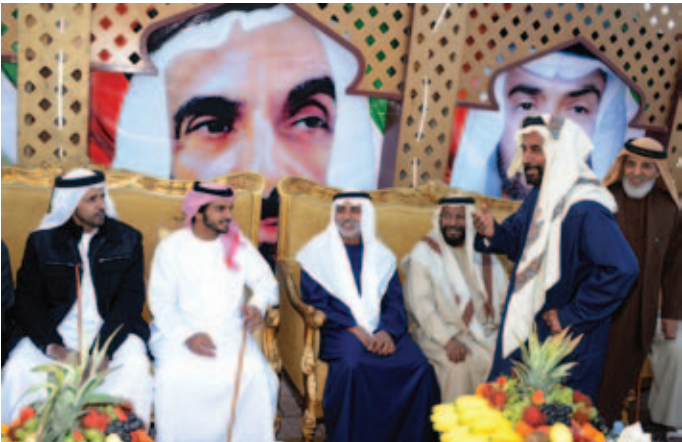
الشيخ نهيان بن مبارك مع الشيخ محمد بالركاض والشيخ محمد بن سالم بالركاض ونايف بن نعيّف وسهيل بن صالح وأمامهم يتحدث حمد بالهويمل