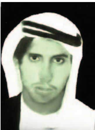
صورة قديمة للمولف