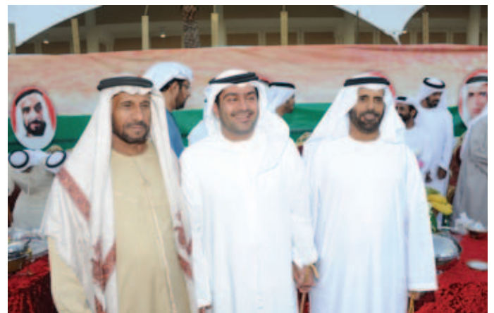
الشيخ خليفة بن سعيد آل نهيان ومحمد وسعيد بن نعيّف