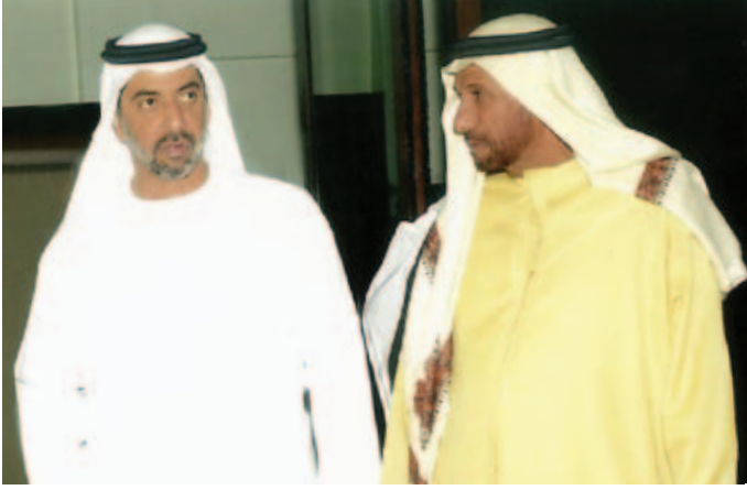
سمو الشيخ حمدان بن زايد ومحمد بن نعيّف العامري