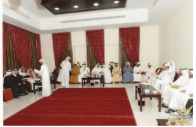
سمو الشيخ حمدان بن زايد يزور عائلة بن نعيف في مجلس الوثبة