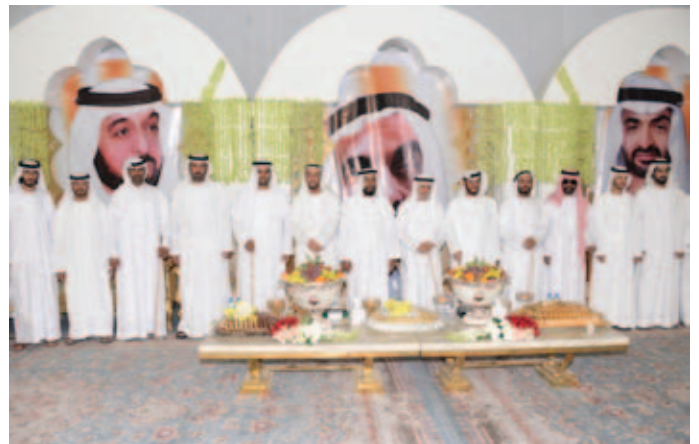
الشيخ محمد بالركاض يتوسّط مجموعة من شيوخ وأعيان القبائل أثناء حفل بن نعيّف العامري