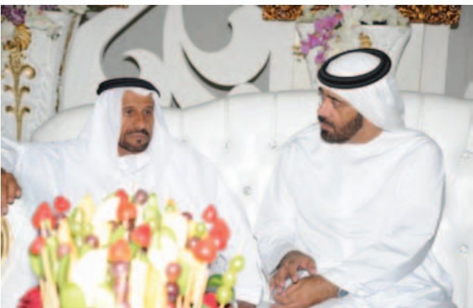
سعادة الشيخ سالم بن محمد بالركاض و محمد بن سيف بن نعييف العامري