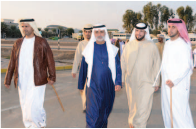
الشيخ نهيان بن مبارك وفي استقباله سيف بن نعيّف وسالم بن نعيّف وإلى يمينه الشيخ نهيان بالركاض