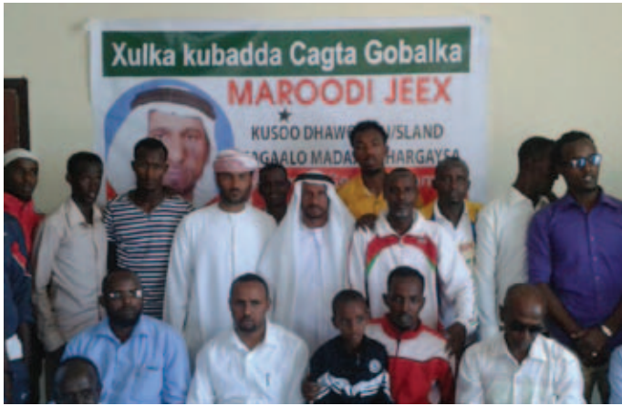
محمد بن نعييف مع نادي هر جاسة بأرض الصومال