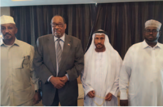
رئيس جمهورية الصومال و محمد بن سيف بن نعيّف ومرافقي الرئيس