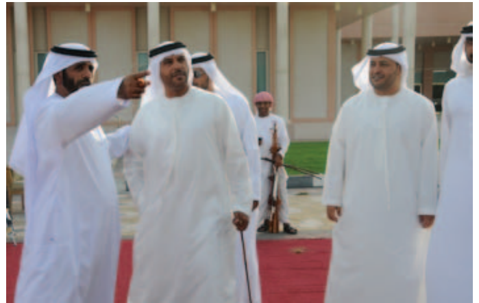
سعيد بن سيف وناصر بن مكتوم ومحمد بن مكتوم