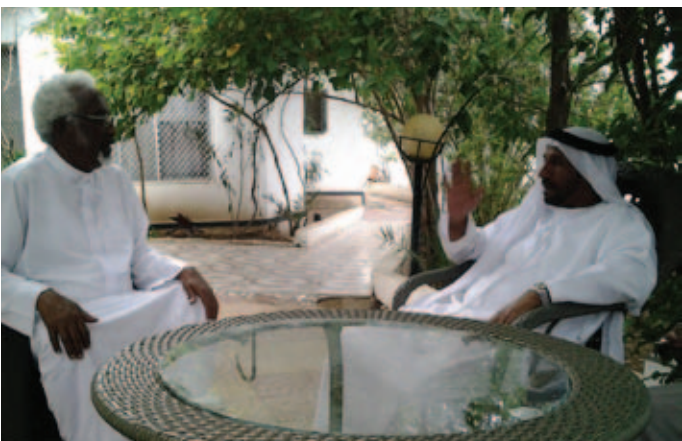
وزير داخلية أرض الصومال و محمد بن سیف بن نعيف