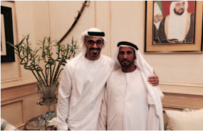
سمو الشيخ خالد بن محمد بن زايد ومحمد سيف بن نعييف العامري