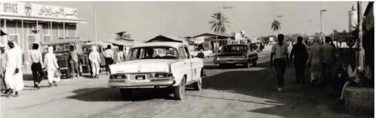
أبو ظبي قديماً