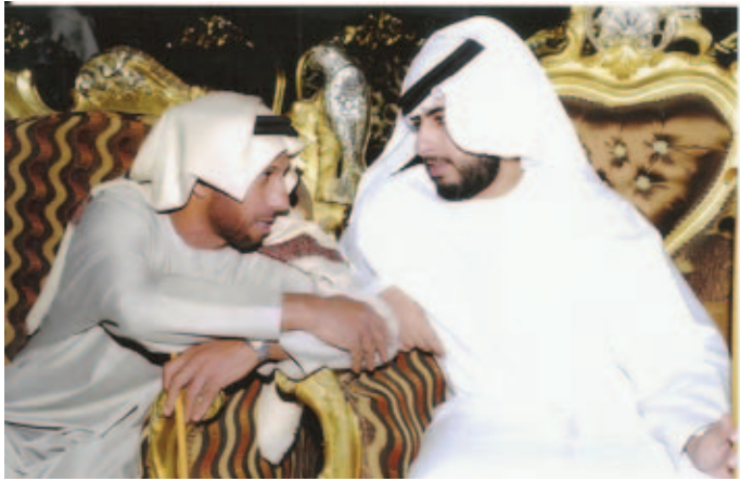
الشيخ زايد بن طحنون ومحمد بن سيف بن نعيّف العامري