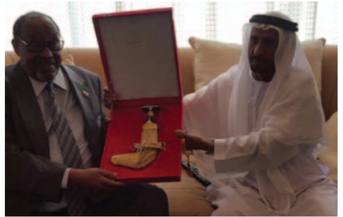
محمد سيف بن نعيف يهدي رئيس الصومال خنجر من ذهب