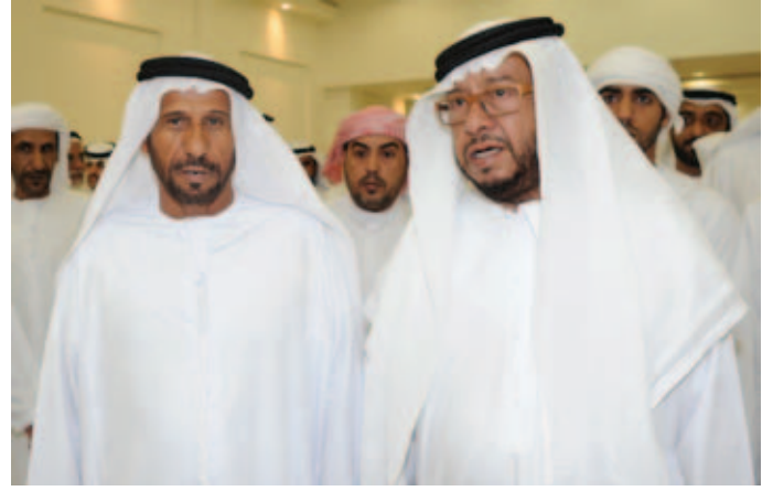
سمو الشيخ سلطان بن زايد ومحمد بن نعييف