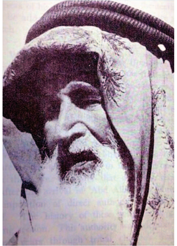
الزعيم الطعيف بن بروس