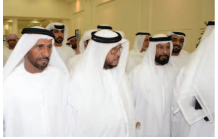
سمو الشيخ سلطان بن زايد والشيخ محمد بالركاض ومحمد بن سيف بن نعيّف