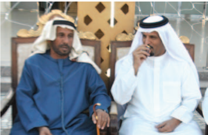
محمد بن سيف بن نعيّف العامري وسعادة السفير صالح محمد بن نصره العامري