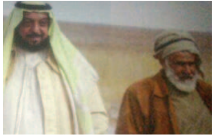
صاحب السمو الشيخ خليفة بن زايد ومحمد بن عبد الله بن نعييف العامري في رحلة خارج الدولة