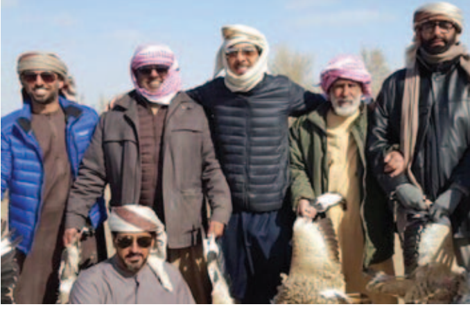
سمو الشيخ منصور بن زايد ومحمد بن عبد الله بن نعيّف ومحمد البواردي ومجموعة من الرجال