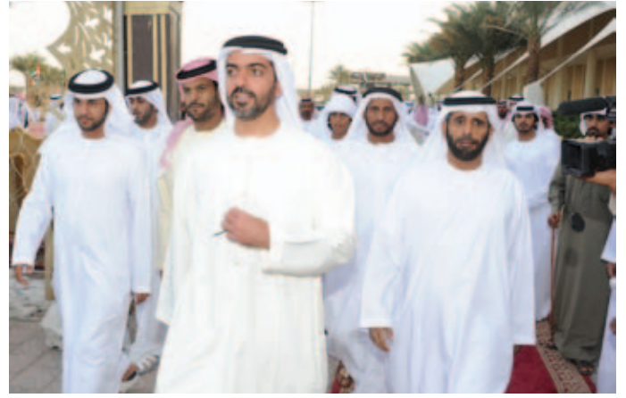
سمو الشيخ حامد بن زايد آل نهيان وسعيد سيف بن نعيّف