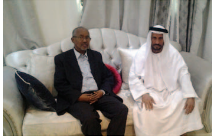
عبد الرحمن السلعي نائب رئيس الصومال ومحمد بن سيف بن نعييف