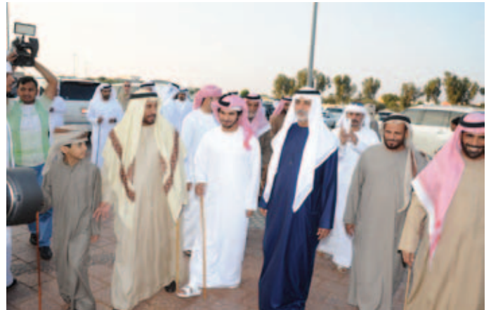
الشيخ نهيان وفي استقباله محمد بن نعيّف وحمد بن نعيّف وسعيد بن نعيّف ونايف بن نعيّف