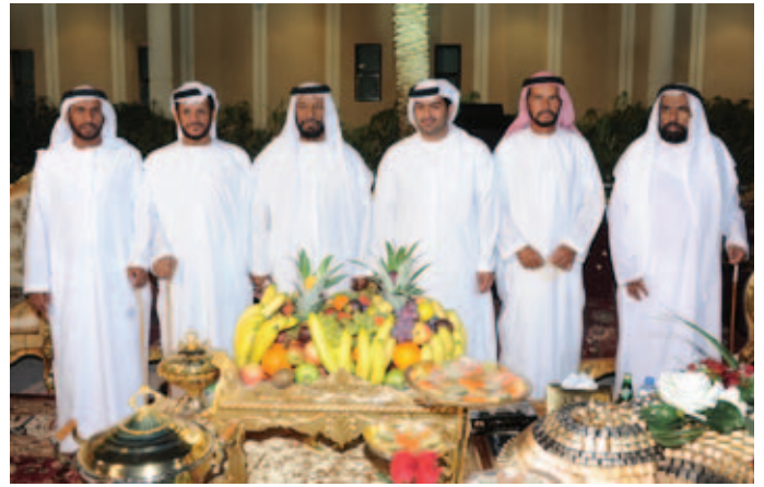
الشیخ خلیفة بن سعید آل نهیان و الشیخ محمد بالركاض و مظفر بن محمد و محمد بن نعيف و علی یساره سعید بن محمد بن زاہرہ و الشیخ حمد بن سالم بالركاض