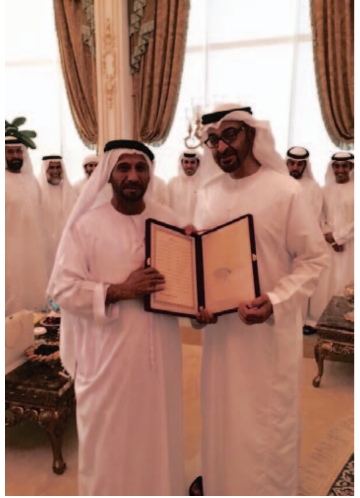
صاحب السمو الشيخ محمد بن زايد ومحمد بن سيف نعيف بن نعيف العامري