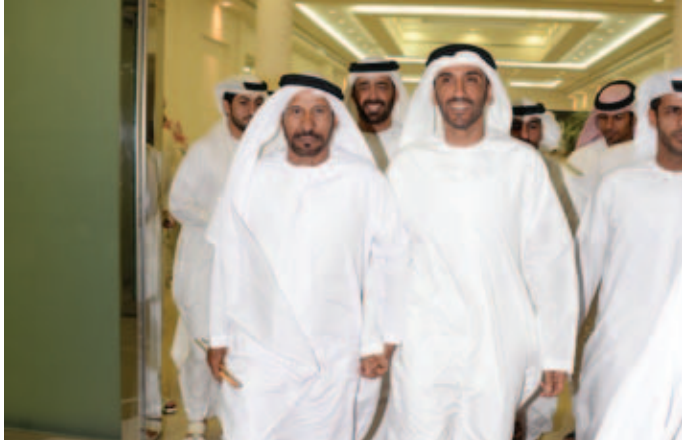
الشيخ نهيان بن زايد و محمد بن نعيّف وفي الصورة الشيخ سالم بن محمد بالركاض