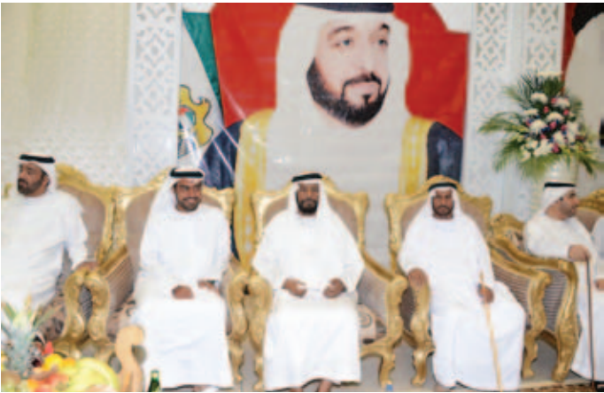
الشيخ محمد بن سعيد آل نهيان والشيخ محمد بالراكض والشيخ سالم بالراكض ومحمد بن نعيّف وإلى يساره سعادة أحمد ناصر الريسي