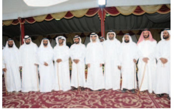
سمو الشيخ طحنون بن محمد آل نهيان مع مجموعة من أصحاب السمو الشيخوخ وعدد من وجهاء وأعيان القبائل في حفل بن نعيّف العامري