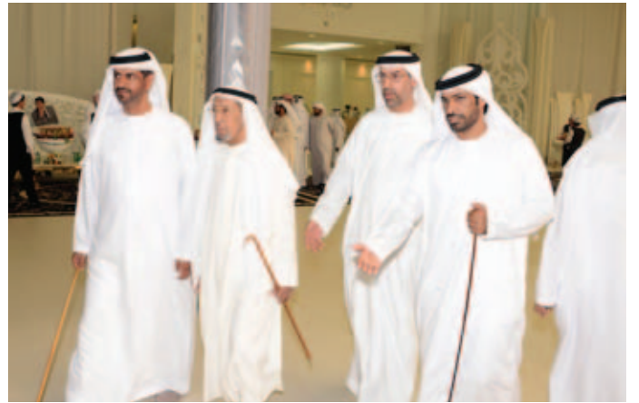
الشيخ سالم بن حمد بالركاض والشيخ نهيان بالركاض يستقبلون الشيخ شبيب بن هلال الظاهري ونجله الشيخ أحمد بن شبيب الظاهري