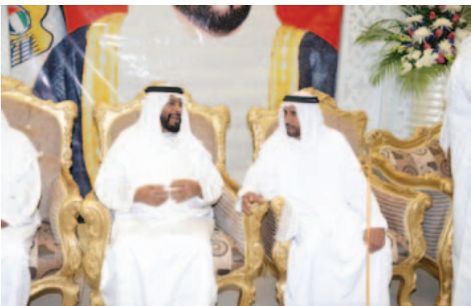
حديث ودي بين الشيخ محمد بالراكض ومحمد بن نعيّف