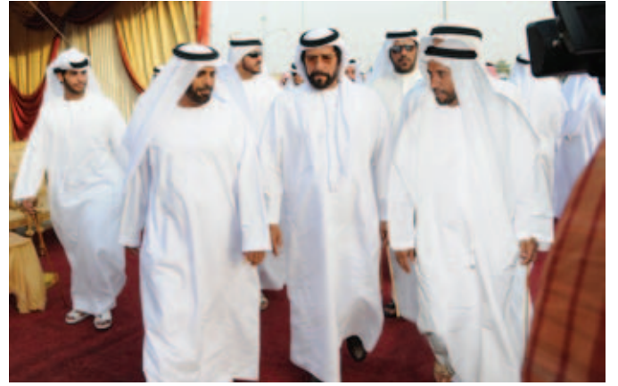
سمو الشيخ طحنون بن محمد وفي استقباله محمد بن سيف بن نعييف وسعيد بن سيف بن نعييف