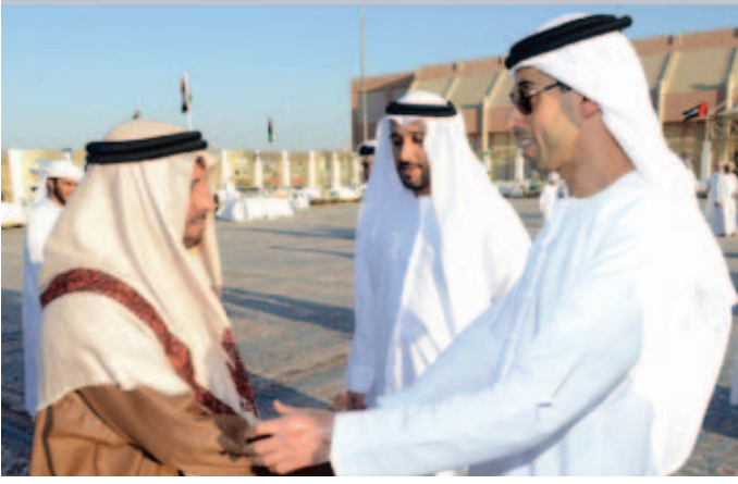
سمو الشيخ خالد بن زايد ومحمد بن سيف بن نعيف وفي الصورة مبارك بالروضه العامري