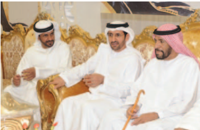
الشيخ سالم بن حمد بالركاض وسالم بن حمور أحد أعيان قبيلة العوامر يتوسطهما سعادة الدكتور مطر النعيمي