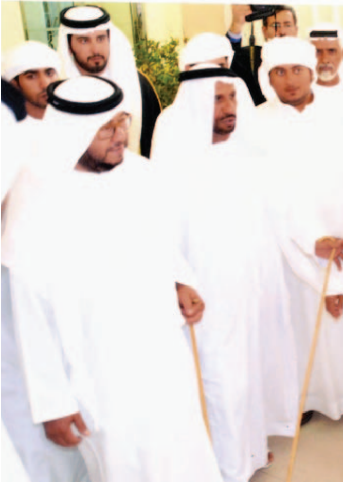
سمو الشيخ سلطان بن زايد ومحمد بن سيف بن نعييف والشيخ حمد بالركاض