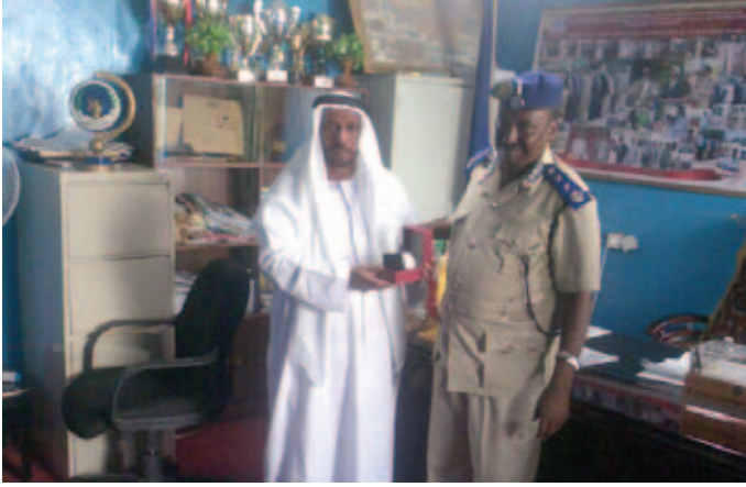
محمد بن نعيف ومدير شرطة أرض الصومال