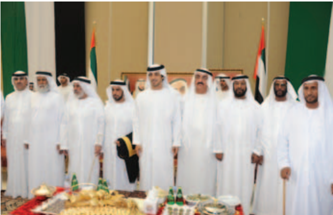
سمو الشيخ منصور بن زايد وإلى يمينه عبد الله ومحمد وعلي بن نعييف وإلى يساره الشيخ محمد بالركاض وسعيد بالكييلة أحد أعيان قبيلة العوامر ومحمد بن نعييف العامري