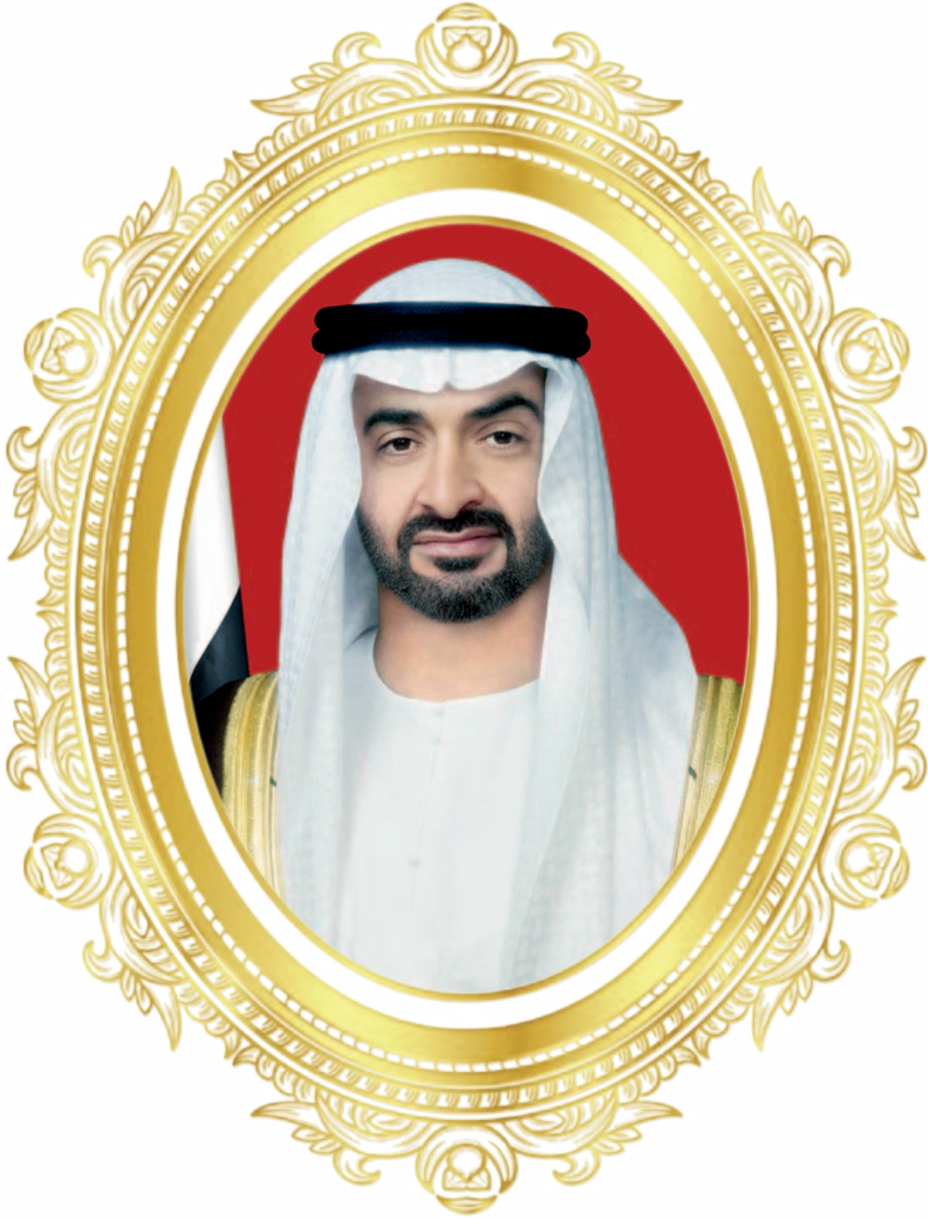
صاحب السمو الشيخ محمد بن زايد آل نهيان ولي عهد أبوظبي نائب القائد الأعلى للقوات المسلحة