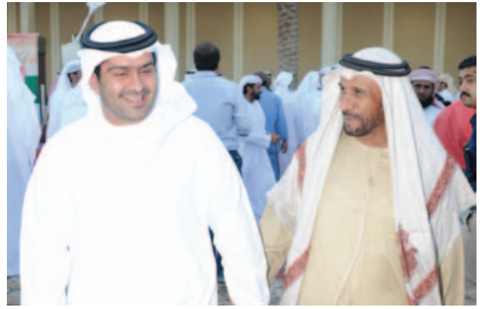
الشيخ خليفة بن سعيد آل نهيان ومحمد بن نعيّف