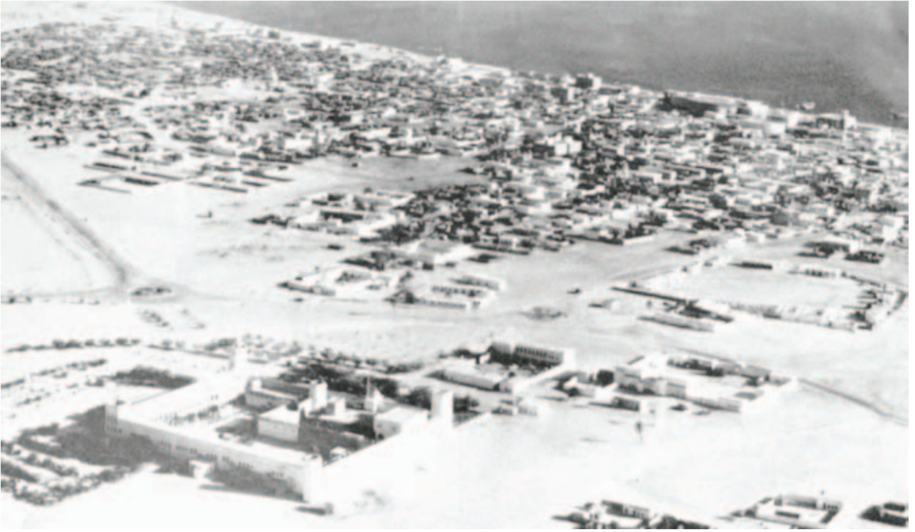
قصر الحصن - أبو ظبي