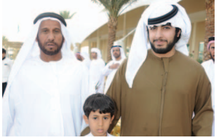
الشيخ زايد بن طحنون ومحمد بن نعيّف وسعيد بن محمد بن نعيّف