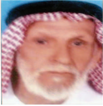
عيسى بن النايح اشتهر بالشجاعة والقوة وكان يضرب به المثل في القوة