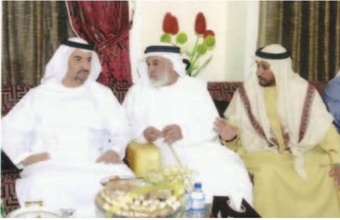
سمو الشيخ حمدان بن زايد ومحمد بن عبد الله بن نعييف ومحمد بن سيف بن نعييف العامري