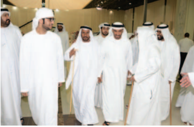
الشيخ نهيان بن زايد ومحمد بن نعييف ومحمد بالحلب العامري