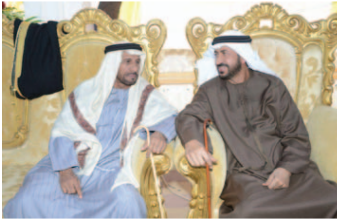
سعادة السفير سلطان بن محمد القرطاسي ومحمد بن سيف بن نعيّف العامري