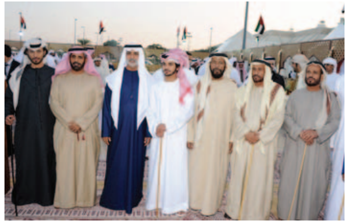
الشيخ نهيان بن مبارك وعلى يمينه سعيد بن سيف بن نعيف ومحمد بن حمد بن نعيف وعلى يساره نايف بن حمد بن نعيف والشيخ محمد بن حمد بالركاض ومحمد بن سيف بن نعيف وحمد بن سيف بن نعيف