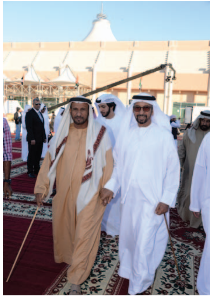
سعادة حمد بن سهيل الخبيلي ومحمد بن نعيّف