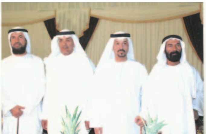
الشيخ نهيان بالركاض وحمد بن مهنا وسعادة علي سالم العامري وسليم بن شورب أثناء حفل بن نعيّف