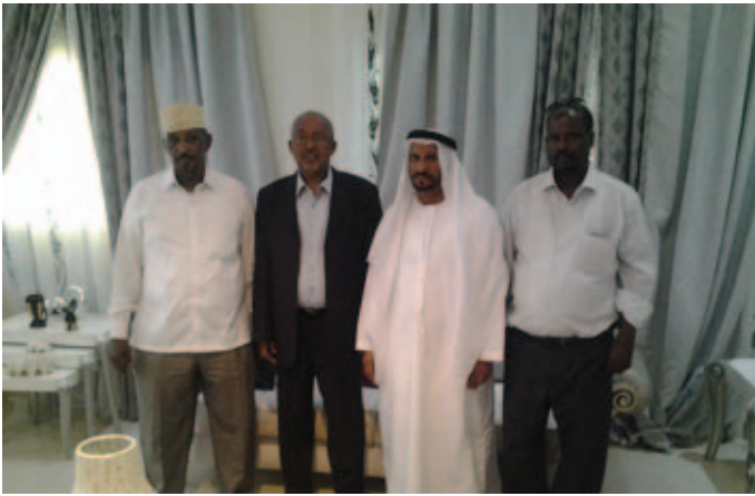
نائب رئيس جمهورية الصومال و مرافقيه ومحمد سيف بن نعيف