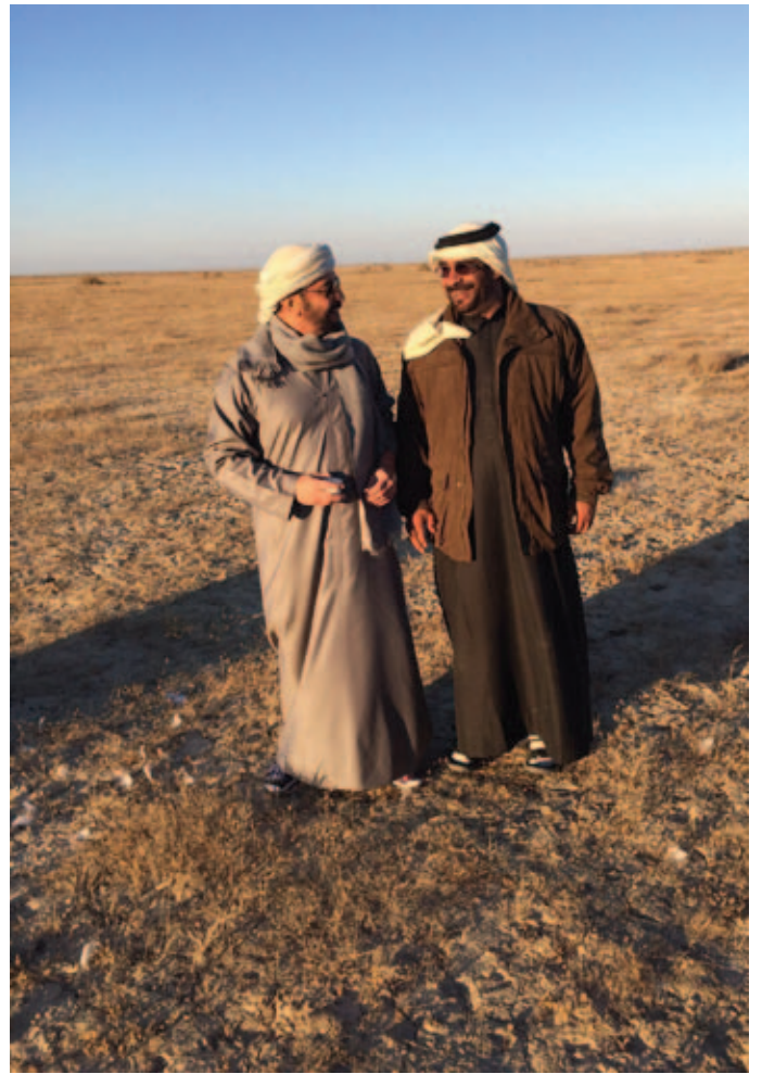
سمو الشيخ حمدان بن زايد آل نهيان وحمد بن سالم بن العوف أثناء الصيد