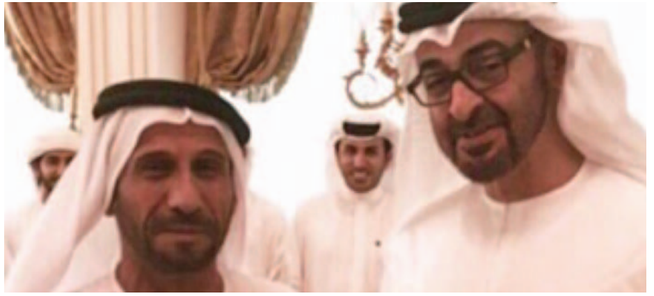
المؤلف مع صاحب السمو الشيخ محمد بن زايد آل نهيان