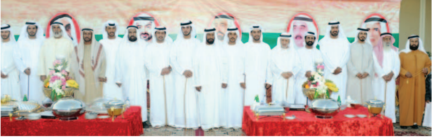
عدد من شيوخ وأعيان القبائل خلال حضورهم أفراح بن نعيف