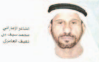
الشاعر الإماراتي محمد سيف بن نعيّف الغامري