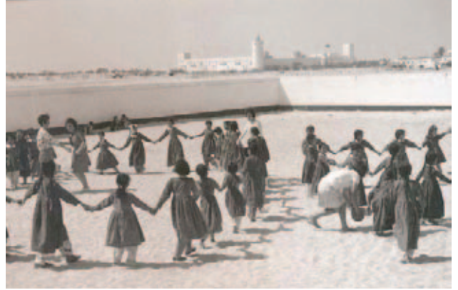
أبو ظبي قبل خمسة عقود