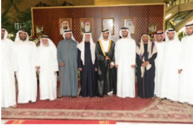
سمو الشيخ ذياب بن محمد والشيخ نهيان بن مبارك ومحمد بن العوف ومحمد بن عبد الله بن نعيّف أثناء حفل بالعوف