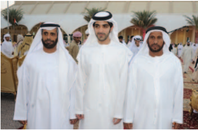
الشيخ هزاع بن طحون آل نهيان و سعيد سيف بن نعيّف العامري ومحمد سيف بن نعيّف العامري