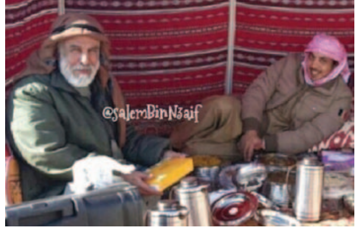
سمو الشيخ منصور بن زايد والمرافق الخاص محمد بن نعيّف أحد أعيان قبيلة العوامر