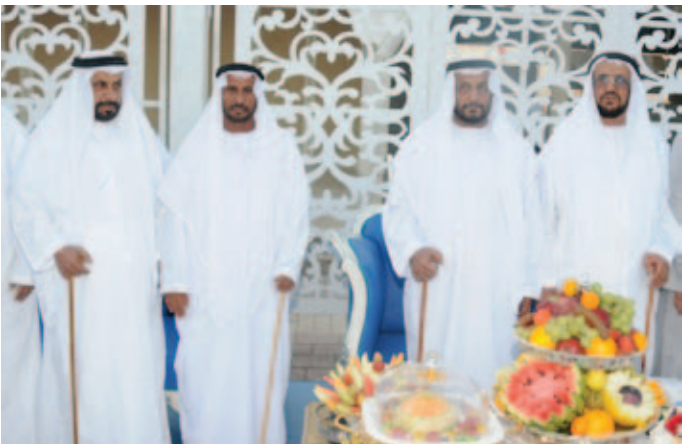
معالي محمد بن بدوه وعبيد اليبهوني ومحمد بن نعيّف وسعادة عبد الله بن بدوه الدرمني