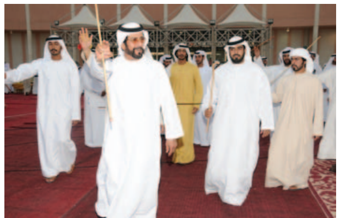
سمو الشيخ طحنون بن محمد والشيخ ذياب بن طحنون والشيخ خليفة بن طحنون أثناء حفل بن نعيّف العامري