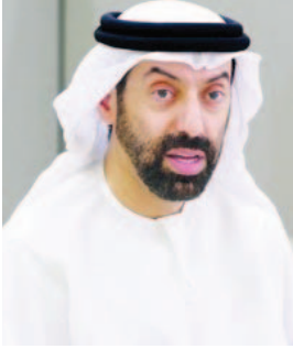
بقلم: سعادة أحمد شبيب الظاهري

قال تعالى ﴿وجعلناكم شعوباً وقبائل لتعارفوا، إن أكرمكم عند الله أتقاكم﴾ صدق الله العظيم.