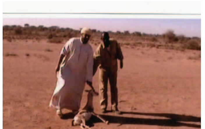
سيف بن محمد بن نعيف أثناء الصيد