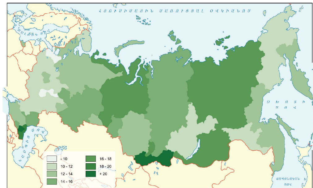
Ծնելիությունը Ռուսաստանում, 2012թ. (1000 մարդու հաշվով)

Ռուսաստանում նկատելի է նաև արտագաղթի երևույթը: Երկրից հեռանում են գերմանացիները, հրեաները, նաև մեծ թվով ռուսներ: