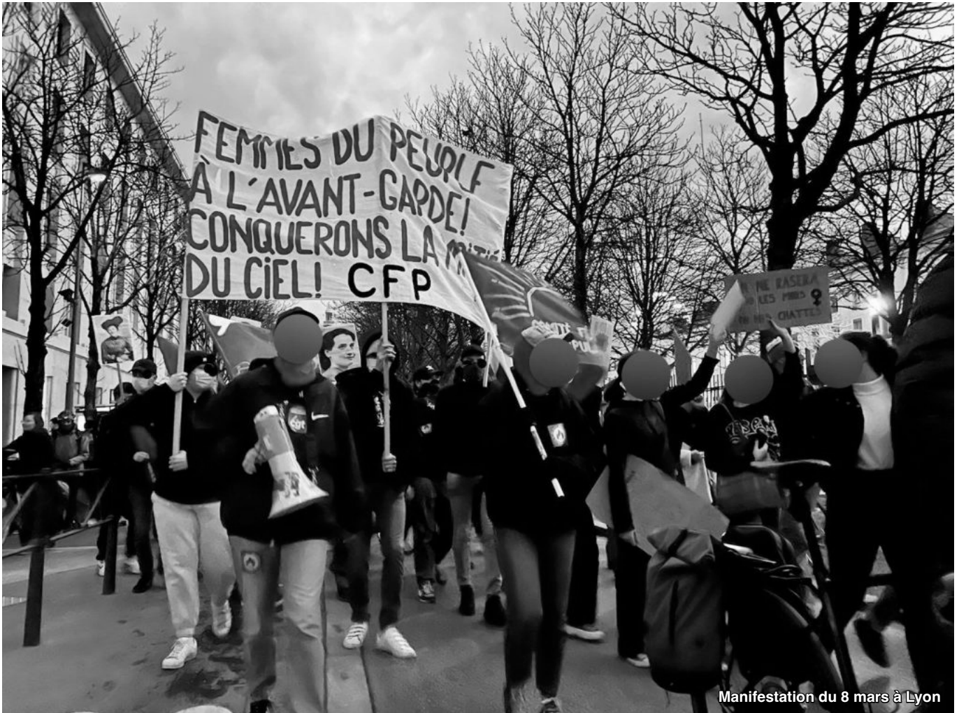
Manifestation du 8 mars à Lyon

nous allons les régler. Pour cela nous avons commencé à développer des cercles de paroles où chacune peut parler de ses problèmes concrets et où nous pourrions commencer à les régler ensemble. Le patriarcat souhaite nous réduire au silence, et bien commençons à parler et à nous organiser pour le renverser.