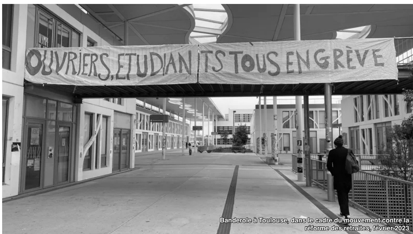
Banderole à Toulouse, dans le cadre du mouvement contre la réforme des retraites, février 2023

L'autre aspect plus caché et qui est le véritable fond du problème c'est la peur que la lutte sorte du cadre actuel, qui est fondamentalement pacifiste. C'est pour cela que ces organisations se font et se défont en permanence. Ces méthodes existent depuis bien longtemps, les organisations et les personnes changent, mais le courant d'idées reste. Il perdra de l'influence dans les années à venir, avec le retour aigu de la lutte révolutionnaire, car elle est implacable et tout va devenir sérieux. Lutter contre l'opportunisme est un devoir révolutionnaire et plus largement démocratique, et tout cela se fait en levant fermement nos principes. ■