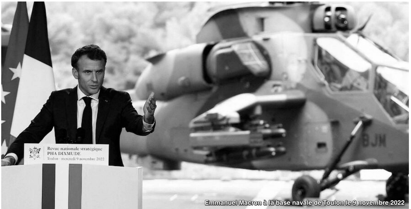
Emmanuel Macron à la base navale de Toulon le 9 novembre 2022

Tout est lié : la situation politique interne des États a à voir directement avec la situation mondiale, et la réforme des retraites ne déroge pas à la règle. Tout d'abord, il faut clairement expliquer quelle est la situation mondiale. Le Covid et la guerre en Ukraine ont été de grands accélérateurs historiques, ils ont accentué la seconde crise générale du capitalisme, crise historique, crise du pourrissement de ce mode de production. De l'autre côté, cela a accentué la lutte pour le repartage du monde entre puissances impérialistes. Pour se maintenir, les puissances impérialistes ont besoin de se repartager le gâteau sur le dos des peuples du monde. Ce repartage est une lutte âpre, faite de conflits plus ou moins ouverts, de collusion, de formation de blocs d'alliances... Tout cela mène à d'extrêmes tensions, principalement entre les deux puissances principales : la superpuissance hégémonique USA et son concurrent la Chine, qui cherche à lui ravir la place. La guerre en Ukraine est l'expression de cette lutte pour le repartage du monde sur le dos des nations opprimées. La Russie veut détruire la nation ukrainienne pour tenter de conjurer le plan des USA contre elle, et surtout son propre effondrement. Les USA, de leur côté, ont besoin d'écraser la Russie (seule puissance à même de les détruire) pour avoir les coudées franches contre la Chine.