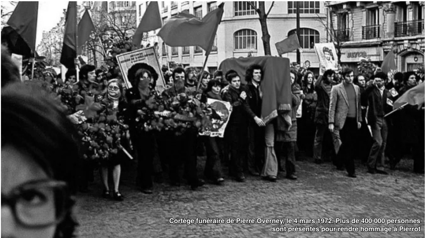
Cortège funéraire de Pierre Overney, le 4 mars 1972. Plus de 400 000 personnes sont présentes pour rendre hommage à Pierrot