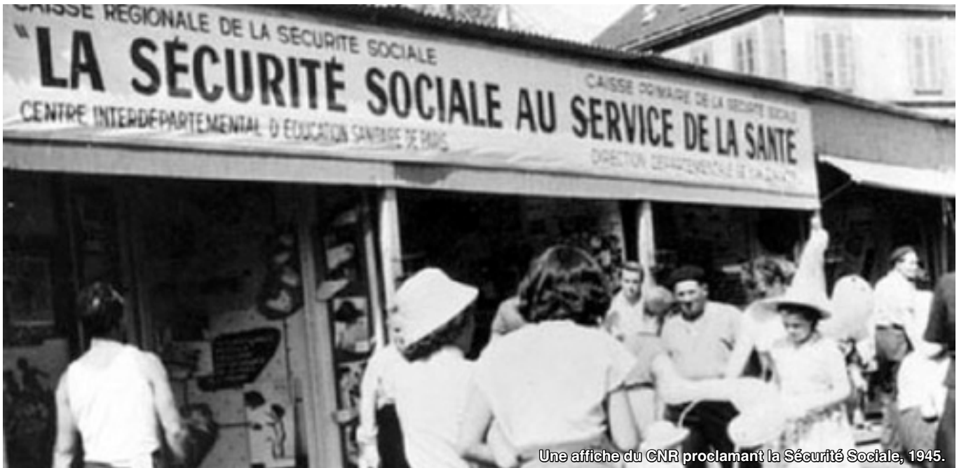
Une affiche du CNR proclamant la Sécurité Sociale, 1945.

volution Culturelle Proletarienne (GRCP) en Chine, les Black Panthers et les mouvements révolutionnaires aux USA, c'est la victoire du Front de Libération Nationale (FLN) au Vietnam ; c'est l'Algérie indépendante, la période glorieuse de l'Irish Republican Army (IRA)... bref, la situation est instable.