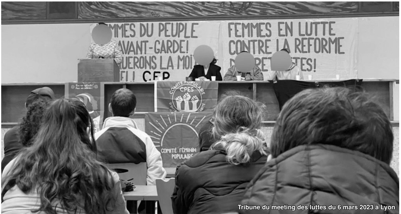
Tribune du meeting des luttes du 6 mars 2023 à Lyon

Ce 8 mars 2023 aura été une journée internationale des droits de la femme travailleuse particulière, un moment aux accents historiques, qui restera gravé dans les annales du mouvement d'émancipation des femmes et de la classe. Bien entendu, c'est le temps qui révélera toujours plus le côté historique de ce 8 mars 2023. Il est donc important de comprendre l'époque pour comprendre la signification du Meeting des luttes organisé à Lyon le lundi 6 mars, où a été présenté officiellement le Comité Féminin Populaire, mais aussi les activités populaires réalisées dans la même semaine.