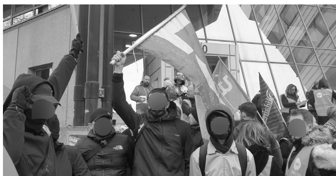
A Toulouse et Grenoble, les activistes sont totalement impliqués dans les luttes au jour le jour, qui se développent dans de nombreux secteurs et s'organisent d'une manière de plus en plus déterminée.