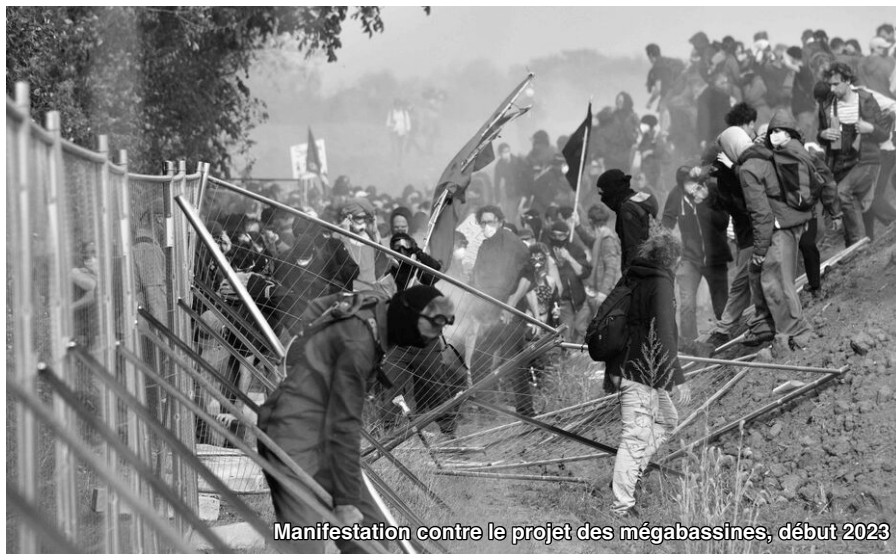
Manifestation contre le projet des mégabassines, début 2023

n'a qu'un seul objectif, le profit. Que ce soit dans le cadre de « l'agriculture paysanne », ou les petits producteurs indépendants doivent survivre, écrasés de dettes, poussés par le besoin de payer leur loyer et de nourrir leur famille, ou dans le cadre de la grande industrie, une entreprise doit avant tout dégager un profit, de plus en plus important. En ce sens, on a favorisé la création de monocultures ; les prix ont baissé (relativement aux salaires) par la spécialisation de la production. On arrache les haies, on fait de la monoculture, et on peut produire très vite sur une grande surface. On vend, les prix baissent. Il faut donc dégager de nouveaux marchés, continuer à spécialiser pour faire face à la concurrence, etc.