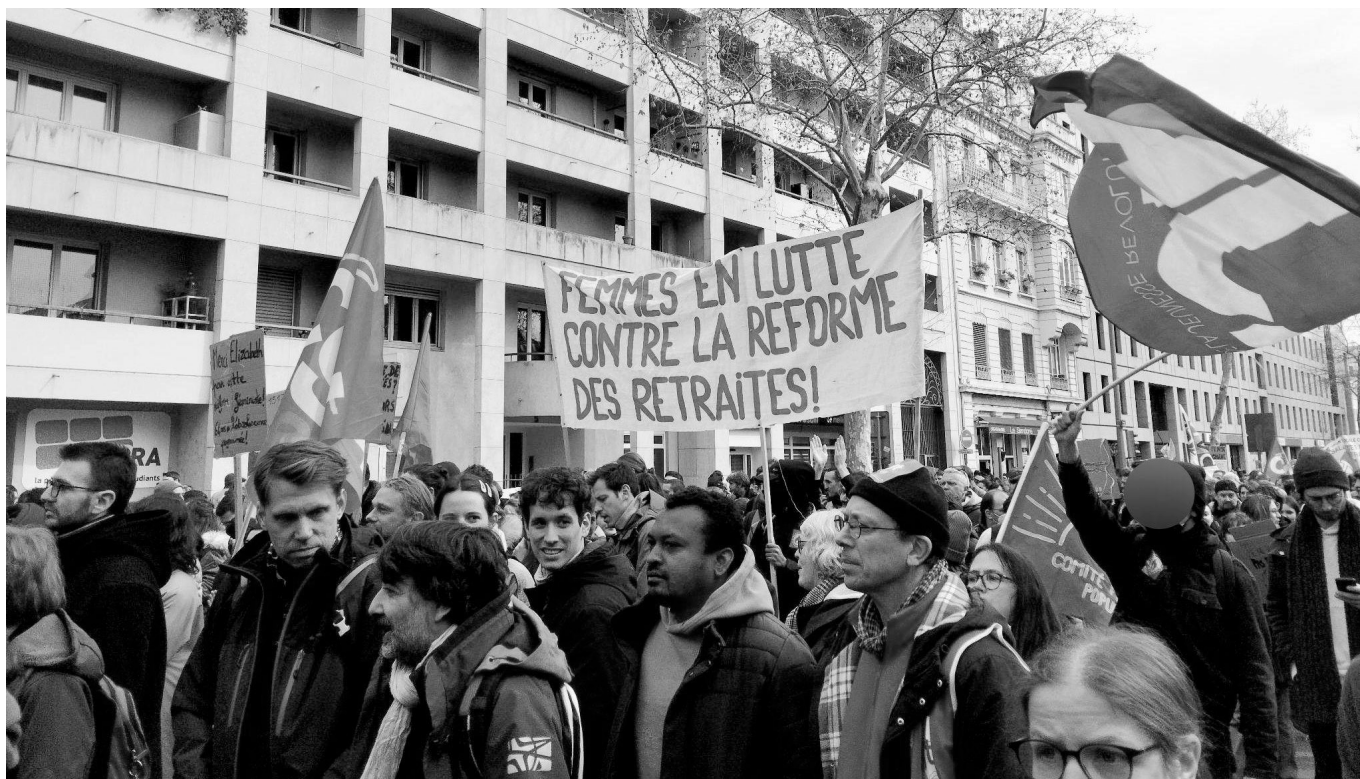
Lyon : les membres de la Ligue de la Jeunesse Révolutionnaire (LJR) sont mobilisés à fond depuis le début du mouvement contre la réforme des retraites pour faire entendre une voix-combative et anti-opportuniste au sein de celui-ci. De nombreuses actions appelant à la mobilisation sont organisées en parallèle des manifestations, dans les quartiers prolétaires de la ville notamment.