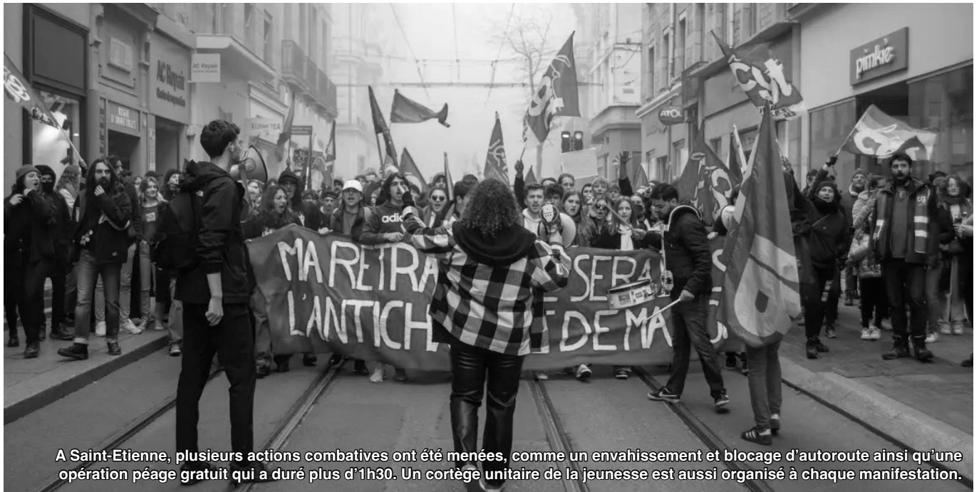
A Saint-Etienne, plusieurs actions combatives ont été menées, comme un envahissement et blocage d'autoroute ainsi qu'une opération péage gratuit qui a duré plus d'1h30. Un cortège unitaire de la jeunesse est aussi organisé à chaque manifestation.