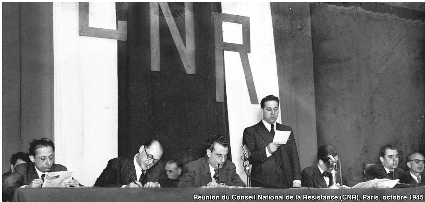
Réunion du Conseil National de la Résistance (CNR), Paris, octobre 1945

On entend souvent, lors de chaque réforme des retraites, cet argument massue : « Il faut sauver notre régime de retraite par répartition ». La majorité de la population est attachée à ce système, qui nous protège du travail quand nous sommes trop âgés, et permet de profiter de la vie pour les prolétaires qui y arrivent en bonne santé. Le système de retraite est en fait une partie d'un régime de sécurité sociale plus large, qui « assure contre la maladie, la vieillesse, et le chômage », selon les mots d'Ambroise Croizat. Toutes ces prestations sont, en fait, un salaire différé. Le patron nous paye notre salaire net qui nous sert à vivre « tout de suite », et cotise (via les cotisations du salaire brut et les cotisations patronales) pour le salaire qui nous servira « plus tard ».