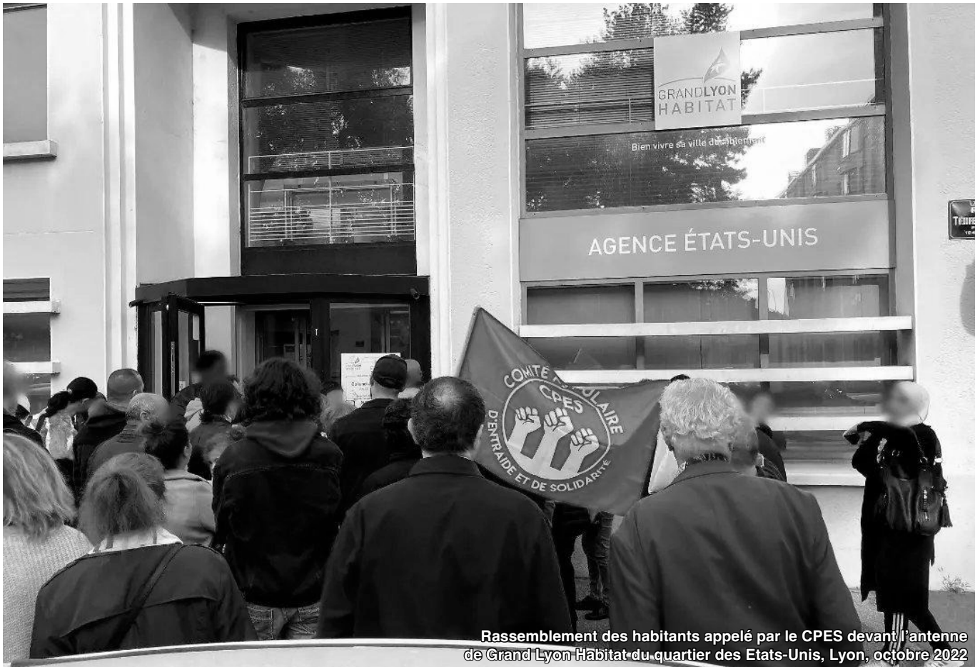
Rassemblement des habitants appelé par le CPES devant l'antenne de Grand Lyon Habitat du quartier des Etats-Unis, Lyon, octobre 2022

Bilan d'une lutte dans un quartier prolétaire : les habitants face à un bailleur social carnivore.