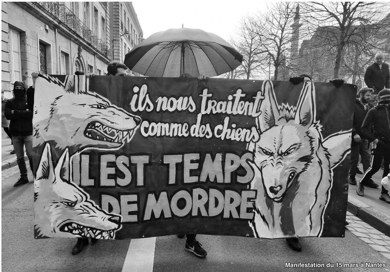
Manifestation du 15 mars à Nantes

traques, ils ont attaqué le rassemblement qui s'est défendu avec combativité. Ce type d'actions symboliques et très revendicatives sont à multiplier, pour augmenter le niveau de détermination. Cheminots, éboueurs, salariés du privés... : il est temps d'aller chercher ces ordures là où elles se trouvent pour leur faire entendre ce qu'elles refusent de voir. ■