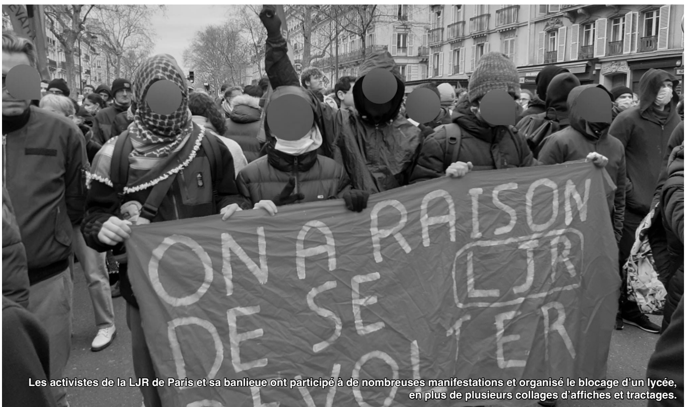
Les activistes de la LJR de Paris et sa banlieue ont participé à de nombreuses manifestations et organisé le blocage d'un lycée, en plus de plusieurs collages d'affiches et tracts.