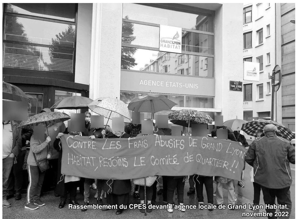
Rassemblement du CPES devant l'agence locale de Grand Lyon Habitat, novembre 2022

Si aujourd'hui la lutte contre ces charges n'a plus la même intensité qu'il y a 4 mois, le CPES a tout de même permis d'obtenir des victoires concrètes, et de forger un noyau d'habitants, qui à n'en pas douter, lors de la prochaine injustice, sauront se lever avec le CPES, pour obtenir encore plus de victoires ! Les habitants savent qu'ils peuvent véritablement participer à la vie du quartier, et commencent à entrevoir ce qu'est une véritable démocratie. ■