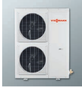
Vitoclima 100-S Ticari tip split klima R410A, On-off dış ünite 14 - 16 kW soğutma kapasitesi