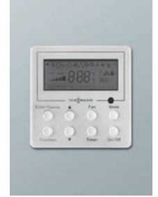
Kablolu kumanda Vitoclima 100-S / Vitoclima 200-S/HE