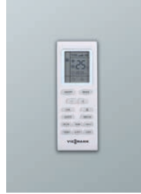
Kablosuz kumanda VITOClima 100-S