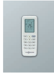
Kablosuz kumanda Vitoclima 200-S/HE