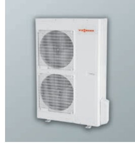
Vitoclima 200-S/HE Ticari tip split klima R410A, DC inverter dış ünite 14 - 16 kW soğutma kapasitesi