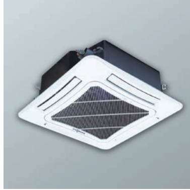
Kaset tipi iç ünite 7,1-11 kW