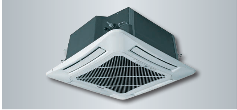
Vitoclima 100-S Kaset tipi iç ünite