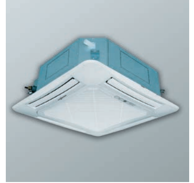
Kaset tipi iç ünite 14 kW