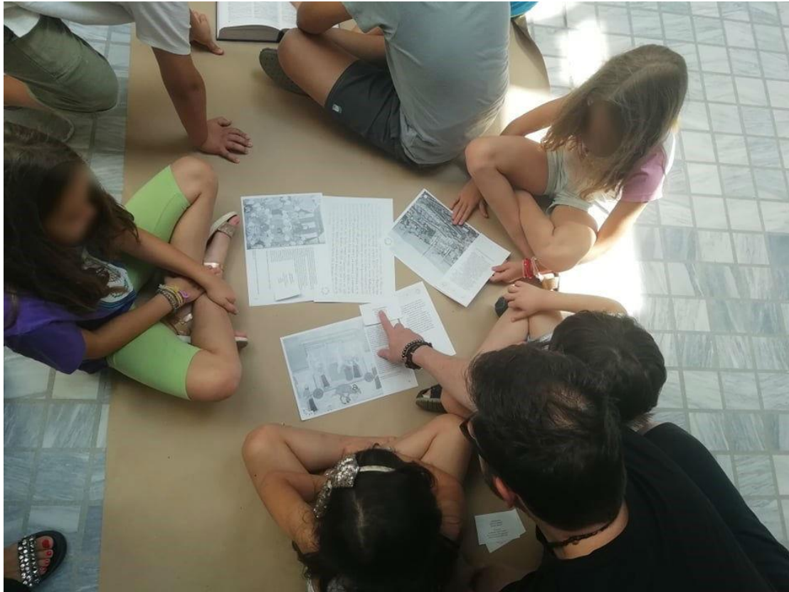
Η 14η δράση της Καλοκαιρινής Εκστρατείας 2018: «Περασμένα δεδομένα: Η Κωνσταντινούπολη τον 17ο αιώνα»

Ένα μακρινό ταξίδι μέχρι την Κωνσταντινούπολη πραγματοποίησαν νοερά τα παιδιά, με αφορμή τη δράση της Δευτέρας.