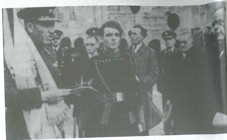
Ο πρωθυπουργός της Κατοχής Ιωάννης Ράλλης παραδίδει την ελληνική σημαία στον Ταγματάρχη Πλυτσανόπουλο, αρχηγό των Ταγμάτων Ασφαλείας Αττικής, μπροστά στο μνημείο του Αγνώστου Στρατιώτη.