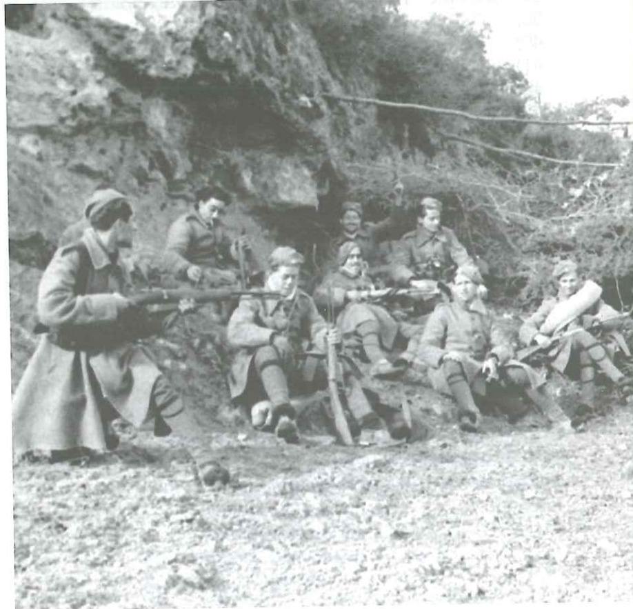
Οπλίτες των Ταγμάτων Ασφαλείας.