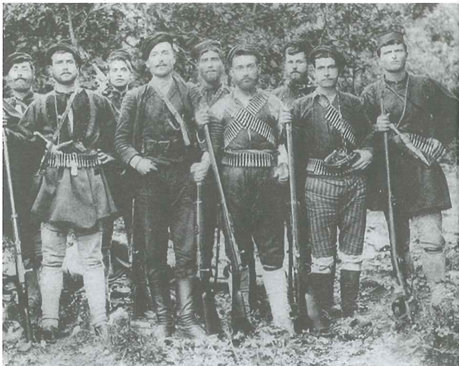
Ο Παύλος Γυπάρης (που είχε διατελέσει επικεφαλής ένοπλων πολιτών στη Μάχη της Κρήτης) συνέτριψε στην Κρήτη τον ΕΛΑΣ.