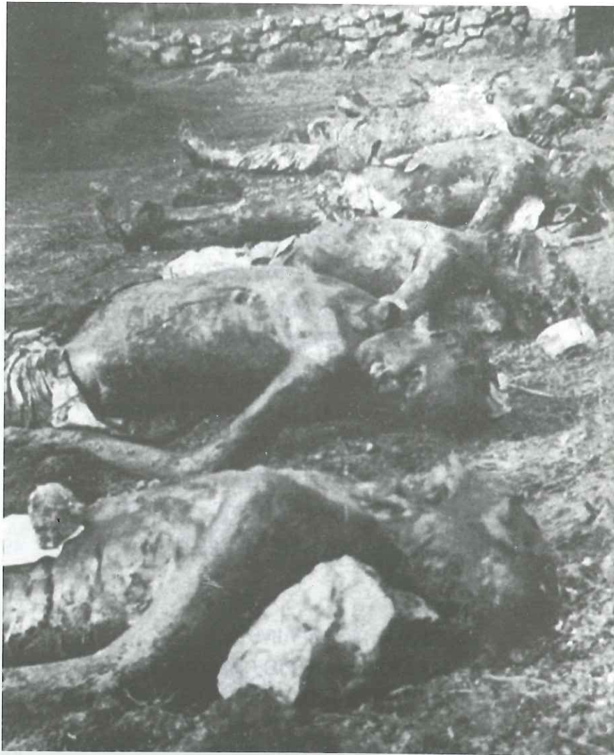
Από τα εγκλήματα του ΕΛΑΣ.