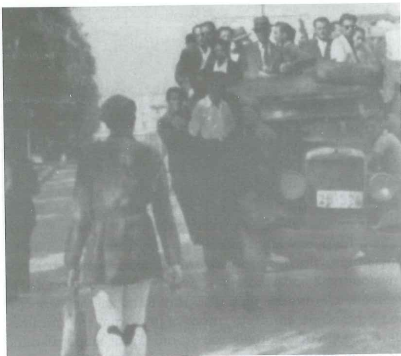
Εύζωνος επιστρέφει στο σπίτι του ύστερα από την υπηρεσία του.

προσέφερε τη γυναίκα και την κόρη του ως ομήρους στους Γερμανούς για να πείσει ότι δεν προτίθεται να πολεμήσει αυτούς, προσφορά που οι Γερμανοί αρνήθηκαν δείχνοντας εμπιστοσύνη. Η σύνθεση του δεύτερου Σιρατηγείου Χωροφυλακής στην Πελοπόννησο σε επιτελικό επίπεδο είχε ως εξής: