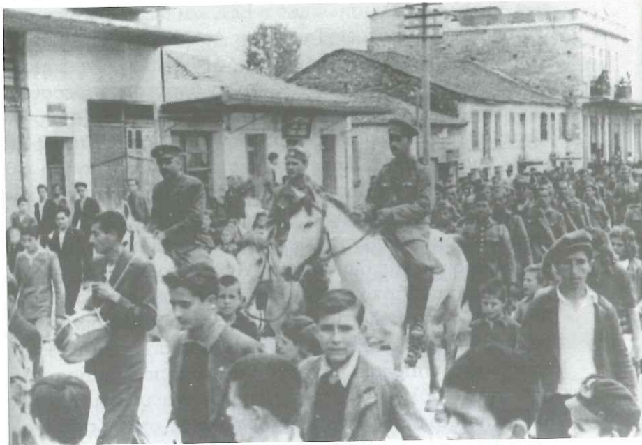
Ο Συνταγματάρχης Γεώργιος Πούλος με τις δυνάμεις του, συνοδευόμενοι από πλήθος λαού.