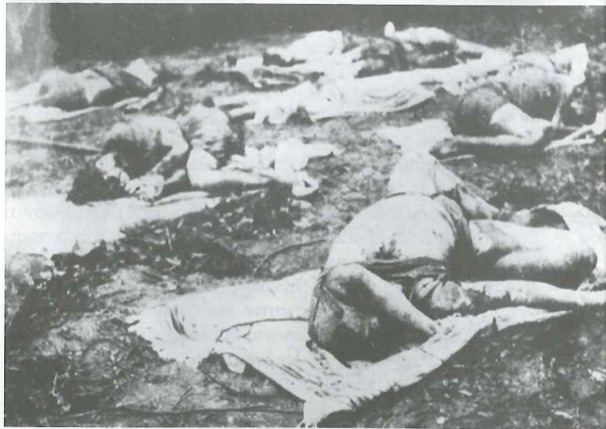
Από την αιματηρή πορεία του ΕΛΑΣ.

ζώνων» και τα «Εθελοντικά Τάγματα Ασφαλείας» με δυσπιστία. Η δημιουργία τους όμως ήταν αποκλειστικά μεθοδευση της τότε ελληνικής κυβέρνησης των Αθηνών, η οποία κατάφερε με έξυπνο τρόπο να πλασάρει την δημιουργία τους στις δυνάμεις κατοχής ως συμφέρουσα και για τη δική τους πλευρά, κάτι που ως ένα σημείο ήταν αληθές αλλά επί της ουσίας πλέον μέρος της εξουσίας επιβολής της τάξεως περνούσε σε ελληνικά χέρια, το οποίο σημαίνει ισοχυροποίηση της ελληνικής κυβέρνησης η οποία γνώριζε ότι αποχώρηση των δυνάμεων κατοχής, που το 1943 ήταν πλέον ορατή, θα δημιουργούσε φαινόμενα αναρχίας διότι έως ότου επιστρέψουν οι στρατιωτικές δυνάμεις από την Μ. Ανατολή -θα απαιτούνταν ένα εύλογο χρονικό διάστημα - ο ΕΛΑΣ θα λυμαινόταν τόσο την ύπαιθρο όσο και τα αστικά κέντρα.