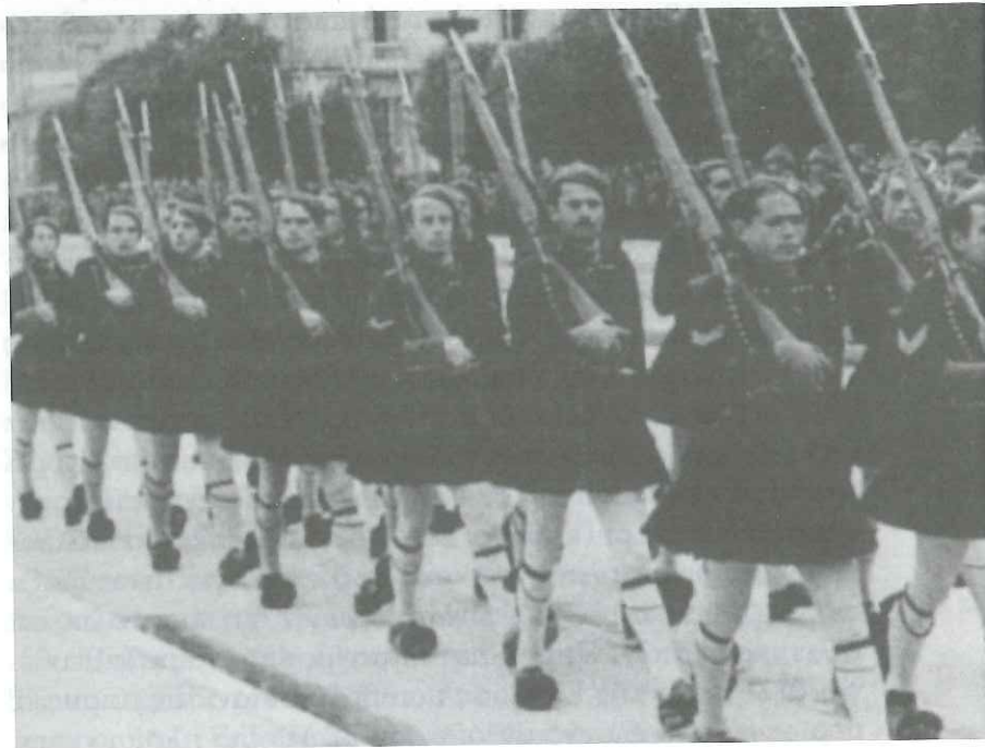
Παρέλαση Ευζωνικού Τάγματος.