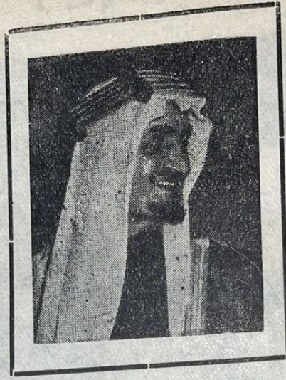
سمو الأمير فيصل آل سعود رئيس وزراء المملكة السعودية ورائد المؤتمر الاسلامي