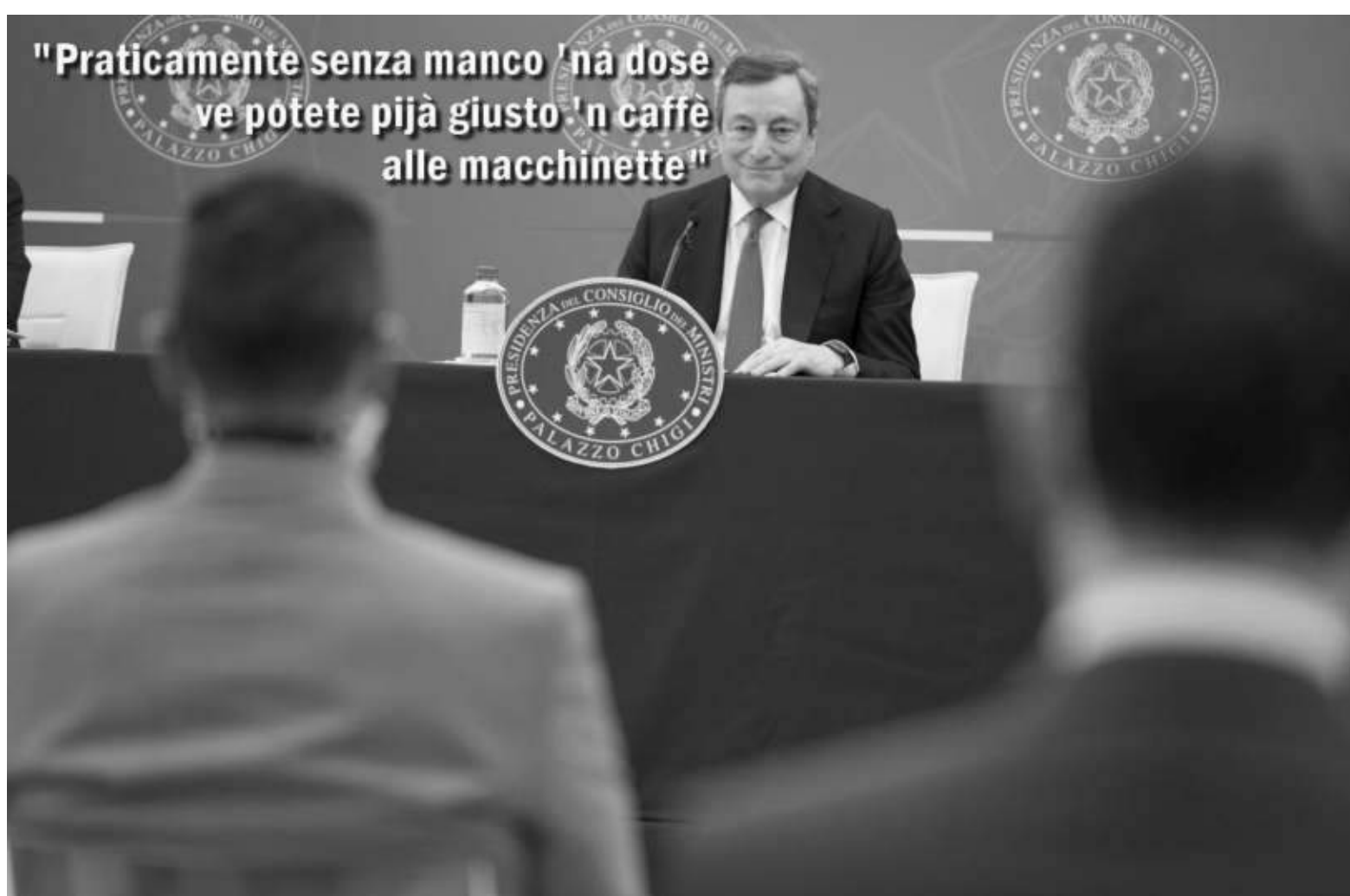
Martini a pagina 2