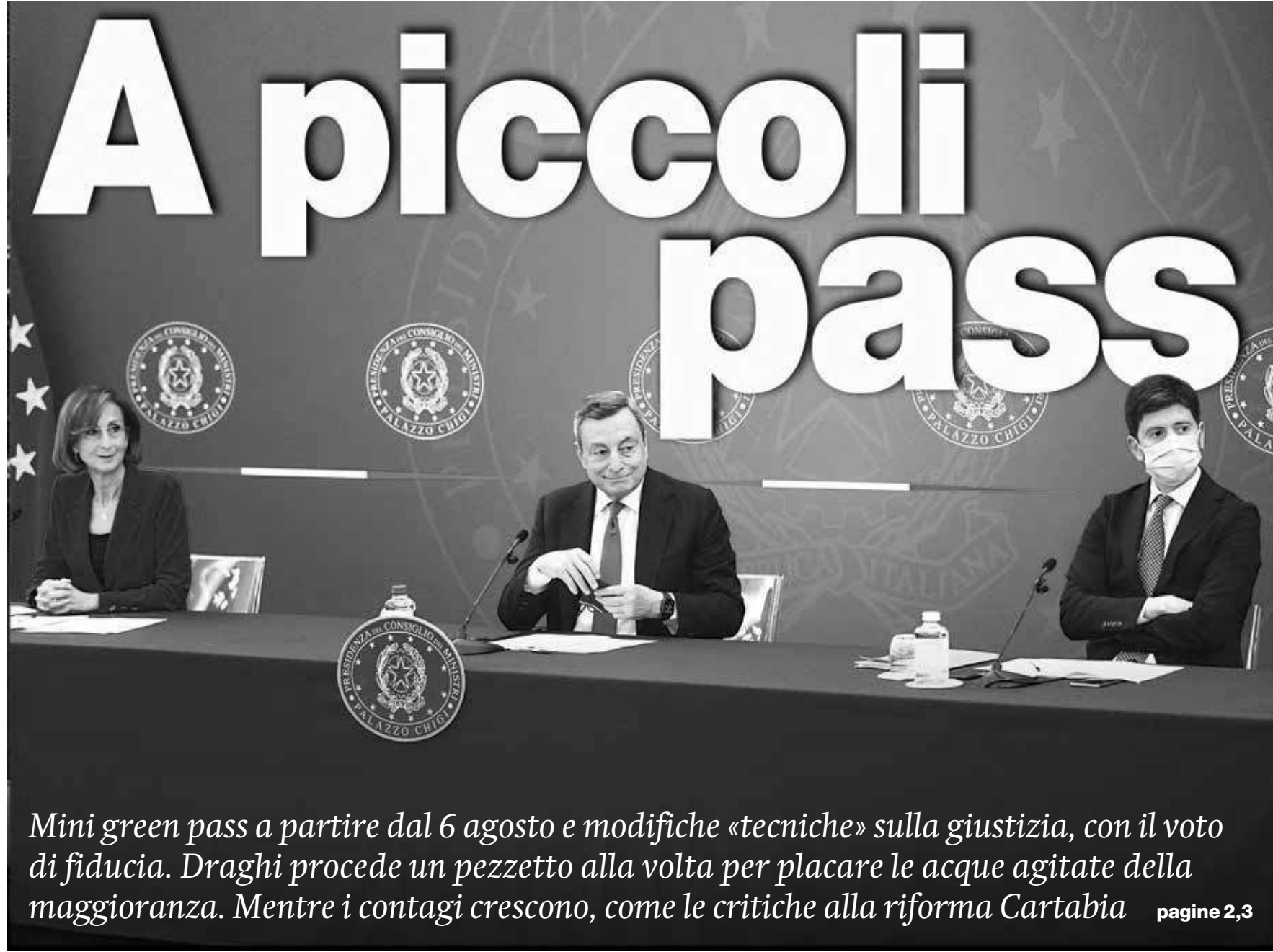
Mario Draghi tra i ministri Cartabia e Speranza durante la conferenza stampa di ieri

Mini green pass a partire dal 6 agosto e modifiche «tecniche» sulla giustizia, con il voto di fiducia. Draghi procede un pezzetto alla volta per placare le acque agitate della maggioranza. Mentre i contagi crescono, come le critiche alla riforma Cartabia pagine 2,3