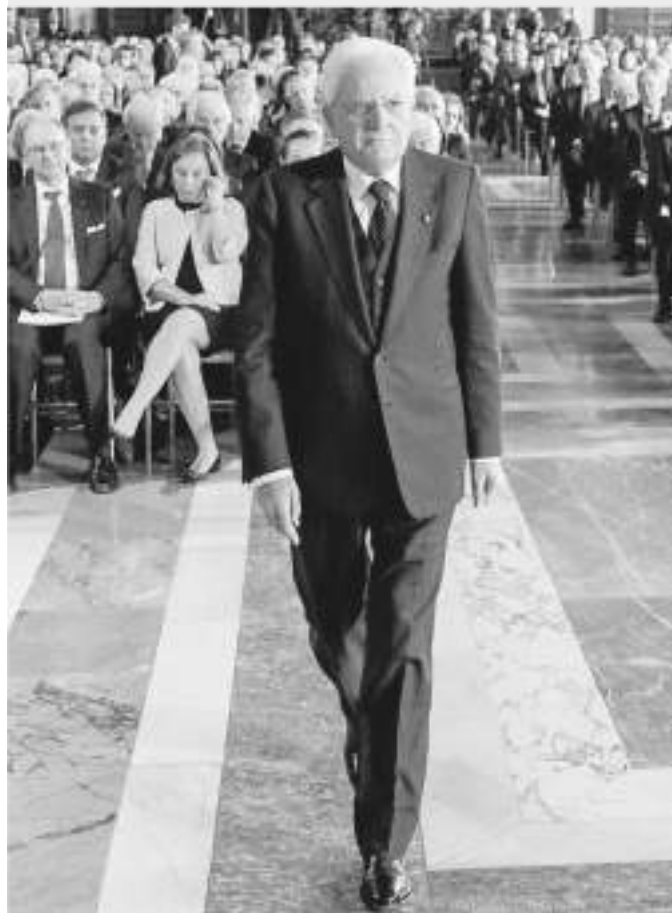
AUGURI Il capo dello Stato Sergio Mattarella è al Colle dal 2015

« E ccoci, siamo all'ultima curva», sospira brindando con i suoi consiglieri. Del resto basta sfogliare il calendario per capire l'aria che tira: oggi il capo dello Stato compie ottant'anni, la settimana prossima nei giardini del Quirinale si congederà dai giornalisti, il tre agosto scatterà il semestre bianco e quindi non potrà più sciogliere le Camere e a febbraio 2022 scadrà il suo incarico. Ma davvero siamo all'ultima curva? O ci sarà un bis? Chi può dirlo? Certamente non può dirlo Sergio Mattarella. Fosse per lui, nessuna proroga. Ma la scelta non dipende solo da lui.