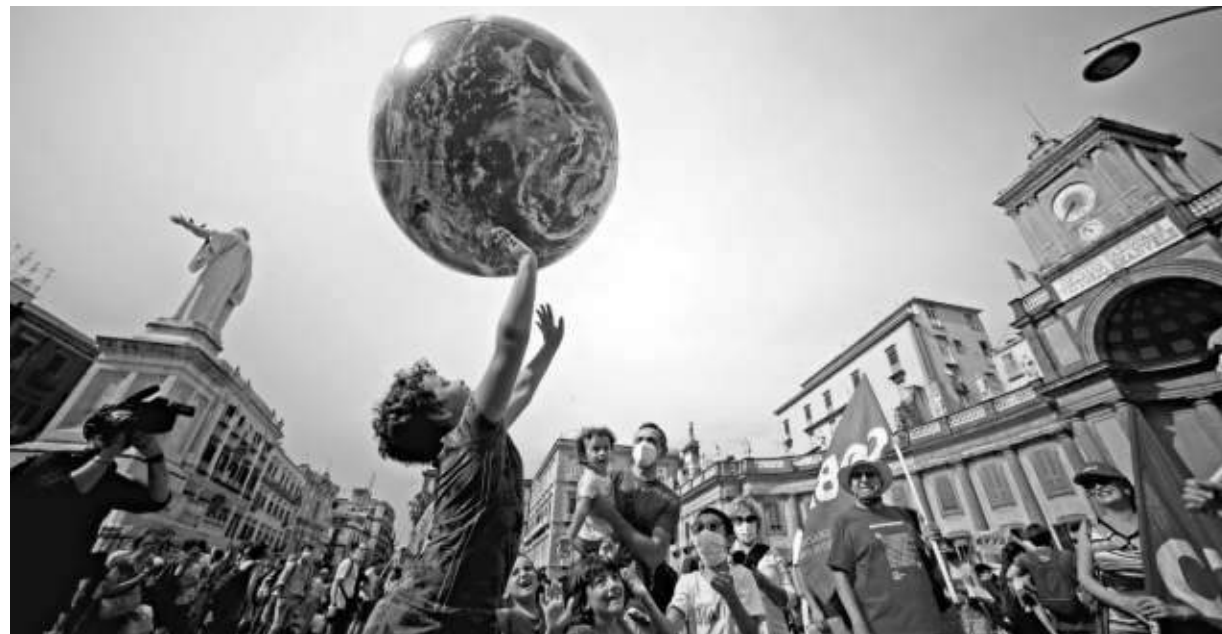
▲ In piazza Napoli, manifestanti contro il vertice del G20 dell'Ambiente