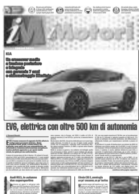
EV6 , elettrica con oltre 500 km di autonomia