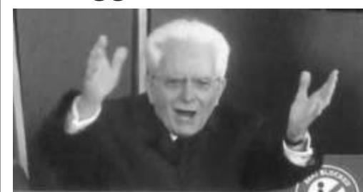
Carta a pagina 6

Il presidente compie 80 anni Ha festeggiato l'Italia ora tocca agli italiani festeggiare Mattarella