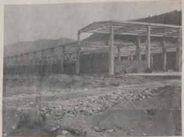
Fabrika Ana Binası

İlk 500.000.000 TL. olacaktır. Bunun da 100.000.000 TL. si de diğer ortak olacaktır.