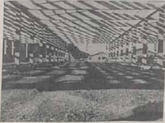
Fabrika Ana Binasının içten görünümü.

Bu durumda mevcut gelişimi ve gelişimi olan bir şirkettir.