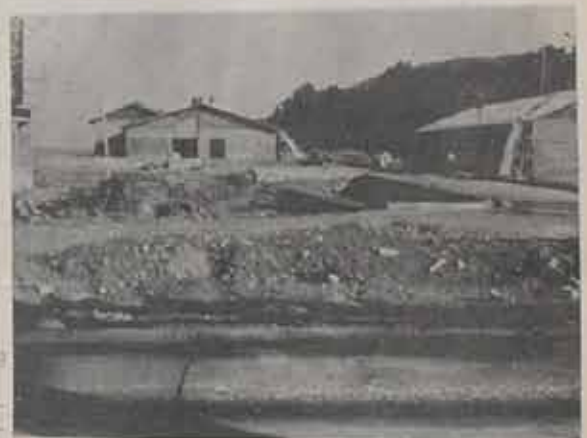
Sermaye, Sosyal ve İdari Bina

Bu ortaklık sermayesi 200.000.000 TL. ile çıkarılacak. Sermaye artırımının 1/4'ü