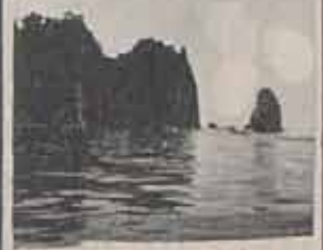
Seğirtek (Hacıvelic)

"SAHİPSİZ MEMLEKETİN BATMASI HAKTIR, SENSAHİP OLURSAN ABANA'N BATMAYACAKTIR" Behçet Kemal Çağlar