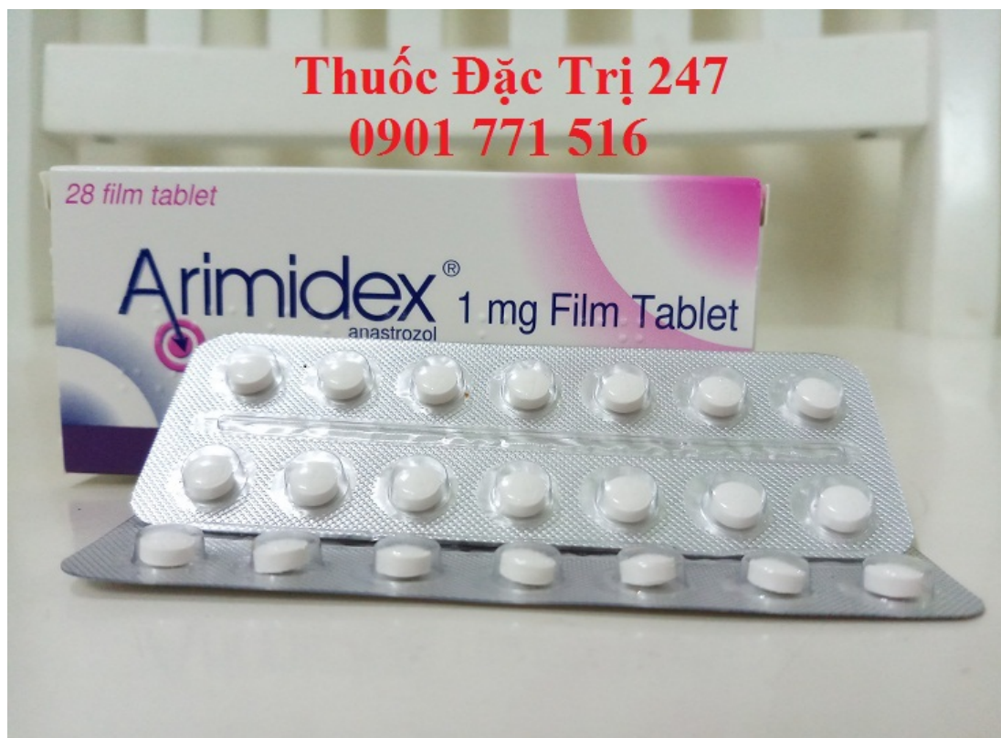
Thuốc Arimidex 1mg Anastrozole trị ung thư vú giai đoạn sớm - Thuốc đặc trị 247 (1)

Giá Thuốc Arimidex : Bình Luận bên dưới để biết giá hoặc liên hệ với chúng tôi qua Fanpage Thuốc Đặc Trị 247