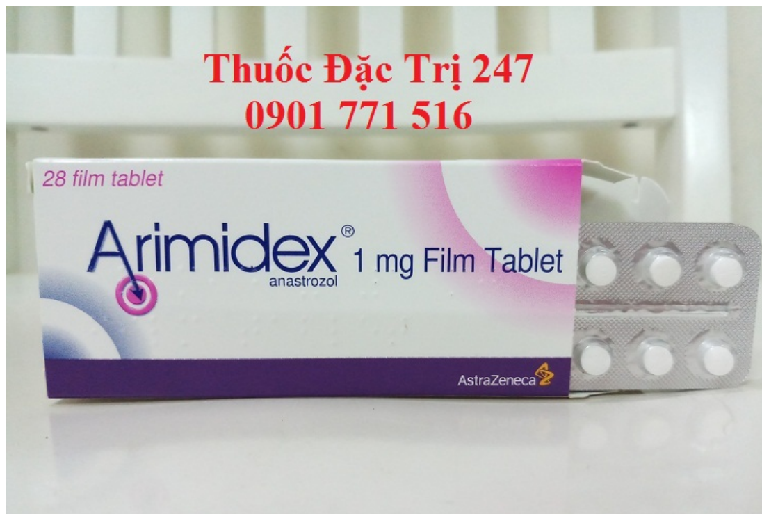
Thuốc Arimidex 1mg Anastrozole trị ung thư vú giai đoạn sớm - Thuốc đặc trị 247 (2)