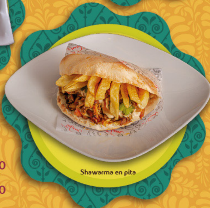
Shawarma en pita