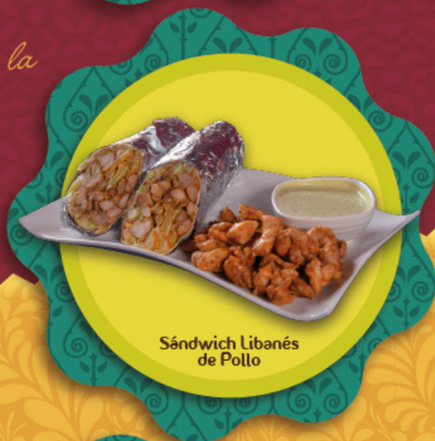
Sándwich Libanés de Pollo

El sándwich tradicional viene con Hummus y tahina, ensalada árabe y papas a la francesa envuelto en el pan árabe. Puede ordenar el sándwich a su gusto, informe si desea realizar cambio de ensalada o papas