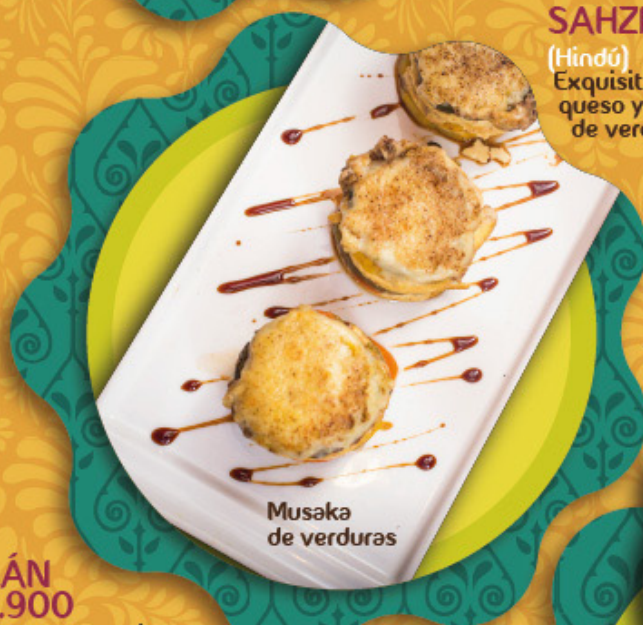
Musaka de verduras