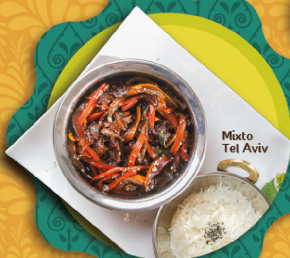
Mixto Tel Aviv