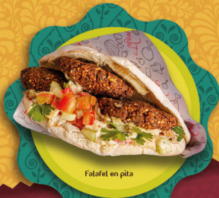
Falafel en pita

El sándwich tradicional viene con Hummus y tahina, ensalada árabe y papas a la francesa envuelto en el pan árabe. Puede ordenar el sándwich a su gusto, informe si desea realizar cambio de ensalada o papas