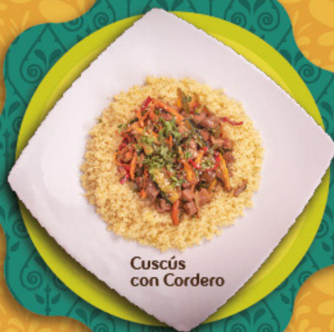
Cuscús con Cordero