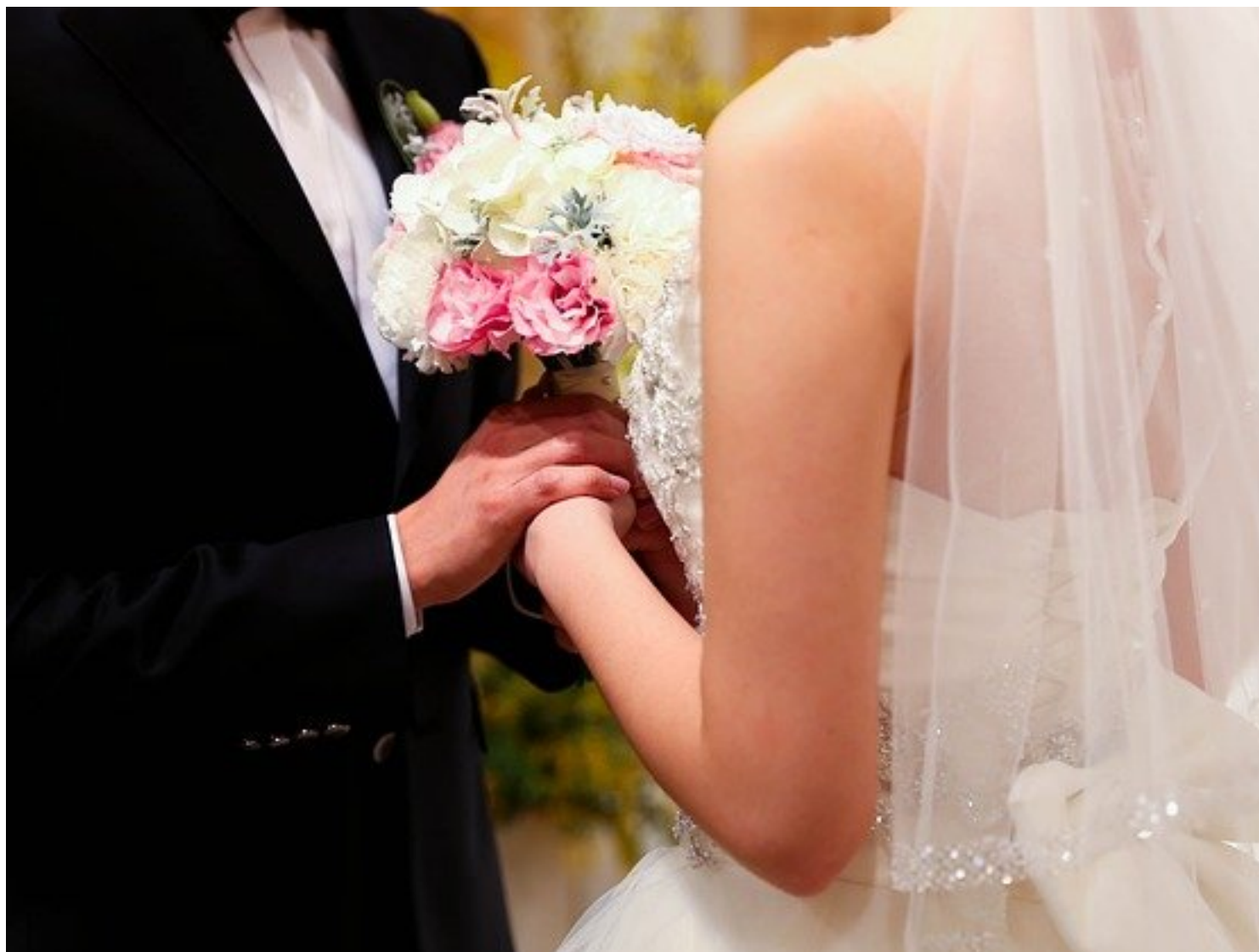
Bruidsjurk Laten Maken - Uniek En Eigentijds regio Castricum

Als je je budget geeft aan een verkoopster, laat dan altijd weten of dit inclusief of exclusief kosten voor vermaken en andere accessoires is - Bruidsmode Castricum. Trouwjurk Op Maat Laten Maken Soms wordt een vast bedrag aangeboden, voornamelijk door de bruidsmodezaken waar je ook je trouwjurk koopt. Je kan je trouwjurk door een professionele coupeuse laten vermaken.