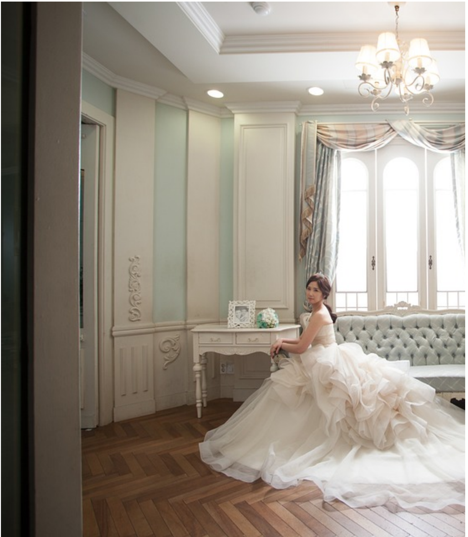
Jouw Trouwjurk Laten Maken Castricum

Een van de coupeuses zegt hier nog over: "Misschien is het nog goed om te vermelden dat een bruidsjapon vermaken echt heel specialistisch werk is (Blijft een strapless bruidsjurk wel goed zitten?)."..