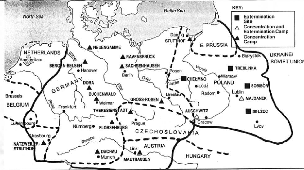
Map of Nazi Concentration and Extermination Camps from: Arno Mayer, Why did the Heavens not Darken? The "Final Solution" in History (New York: Pantheon, 1988), xvii.

— BOUNDARY OF REICH - - - PRE-1939 NATIONAL BORDERS