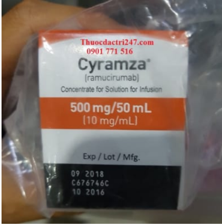
Thuốc cyramza 10mg/ml ramucirumab điều trị một số loại ung thư di căn (2)