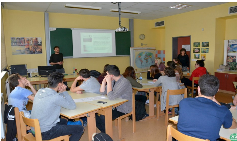
Fotografija: Testiranje učnih scenarijev in snemanje izobraževalnega dokumentarnega filma je potekalo tudi v Sloveniji na Dvojezični srednji šoli Lendava - Kétnyelvű Középiskola, Lendva.

Mirovni inštitut je v sodelovanju s partnerji v okviru projekta MEET, medijska vzgoja za pravičnost in strpnost izdelal multimedijško zbirko orodij za učiteljice in učitelje s številnimi praktičnimi primeri, kako je mogoče hkrati poučevati medkulturno in medijsko vzgojo ter pri tem spodbujati demokratično kulturo pri dijakih in dijakinjah. Zbirko orodij sestavljajo teoretski uvod, smernice za oblikovanje učnih aktivnosti, šest učnih scenarijev in izobraževalni dokumentarni film, ki je bil posnet tudi v Sloveniji. Vsa gradiva so prosto dostopna na spletni strani projekta . Vabljeni k ogledu in uporabi.