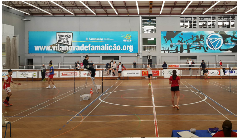
5ª Jornada Seniores - Zonal

No próximo fim de semana, o Pavilhão Municipal de Angeja vai ser palco de três eventos organizados pelo Clube de Albergaria. No sábado, decorre a 5ª Jornada Nacional de Veteranos, enquanto no domingo decorre, em simultâneo, a 2ª jornada do II "Masters Fernando Silva" que reúne os melhores atletas nacionais, e o 4º Torneio de Divulgação.