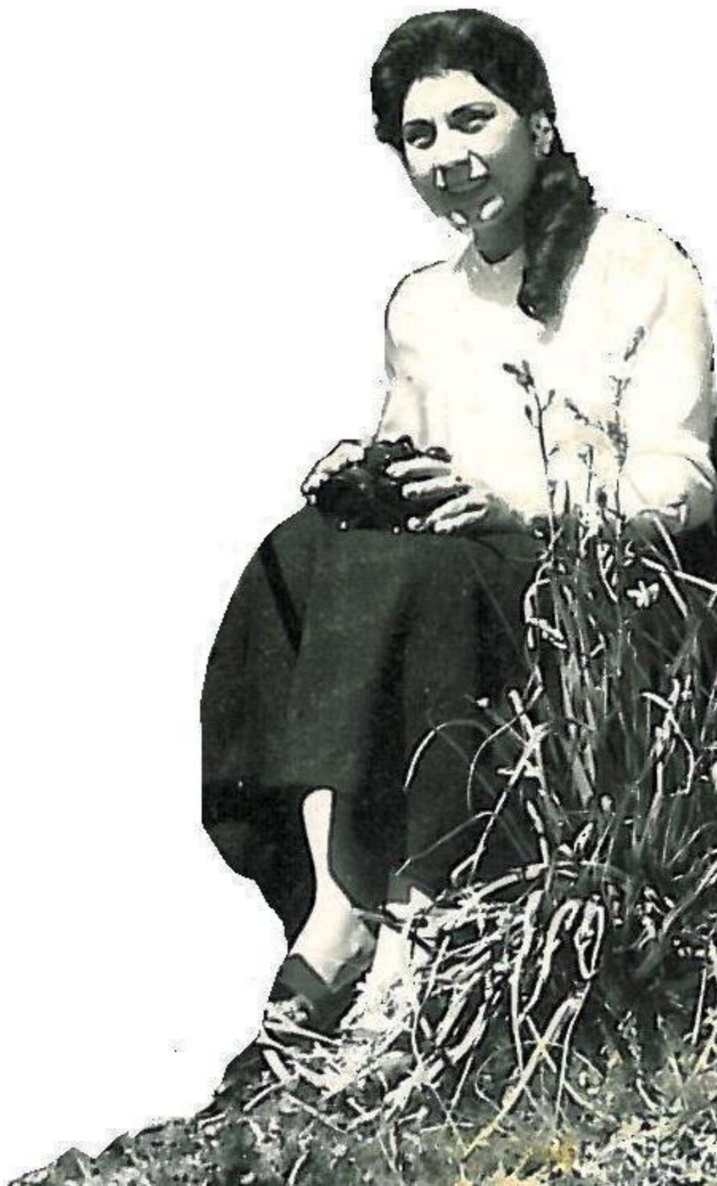
ΖΗΝΑ, Η ΖΩΗ ΤΗΣ ΕΝΑ ΠΑΡΑΜΥΘΙ