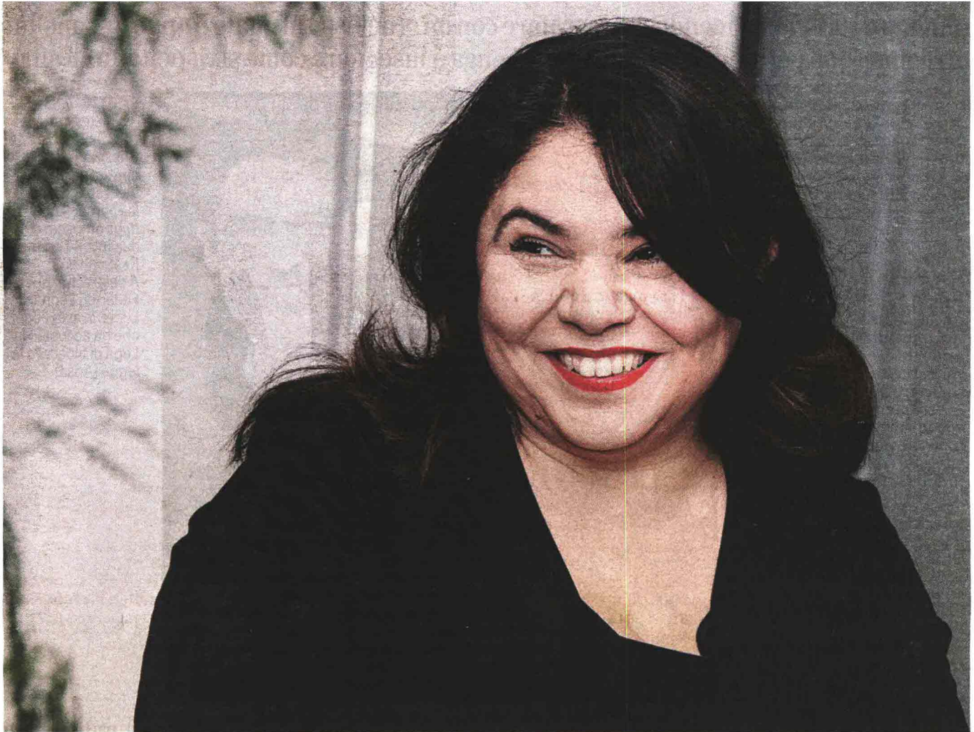
TALEBANA La scrittrice e attivista di sinistra Michela Murgia ha duramente criticato Matteo Salvini e Marco Minniti