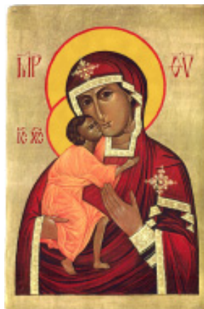
Mother of God Fedorivska wood, egg tempera, gold leaf