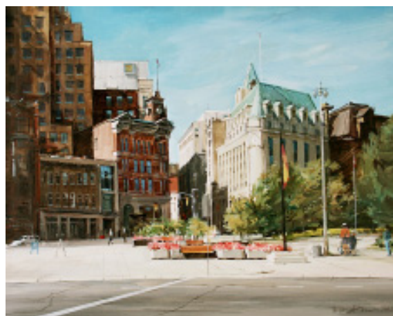
Elgin St. acrylic, 16"x 20", 2002

Якщо Ви самі творча людина, маєте цікаві неординарні захоплення, або навіть попросту знаєте таких осіб, про яких варто розповісти нашим сучасникам — пишiть, присилайте е-листи, дзвонiть. В наступному числi — знайомство з Богданом Том'юком