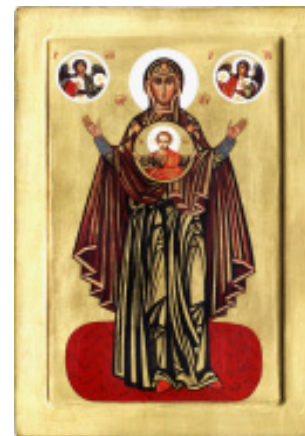
PANAGIA wood, egg tempera