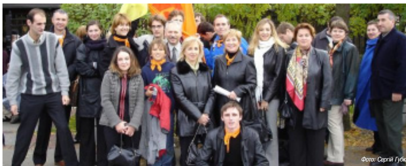
Виборці з Товариства «ЗУСТРІЧ» в Оттаві