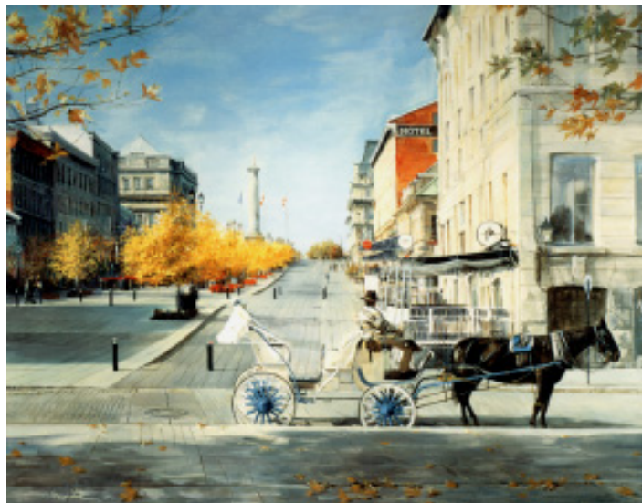
End of season Acrylic, 48"x60", 2001

Master's degree in Graphic Art, Member of the Union of Artists of Ukraine, Member of the Ottawa Art Gallery, Member of the Sacred Arts Association of Canada