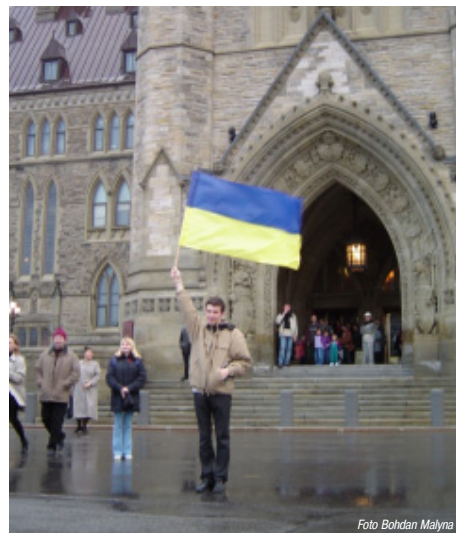
З туристичної екскурсії по Оттаві після виборів. Перед Канадським Парламентом. До речі, з українським прапором всередину не впустили.

ПІДТРИМУЙТЕ “ОТТАВСЬКИЙ ВІСНИК” єдине українське друковане видання в столиці Канади