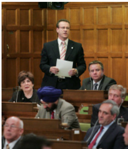
Виступ у Парламенті 13 жовтня, 2004 р.

- На одних з попередніх виборів, в Торонто було два кандидати-українці від різних партій. Не пригадую зараз деталей чи фамілій цих депутатів. Але що найбільше запам'яталося - їхні передвиборні інтерв'ю для програми "Світогляд", котра окремо надала їм обом ефір. Що один, що другий, з викивав купу претензій на опонента і закликав українців віддати голоси тільки за себе. В результаті ні один з них не пройшов, хоча українці за них таки голосували - розділених голосів виявилось не досить. Майже подібна історія трапилася і з нашим першим послом Лучковичом, - як тільки він став кандидувати від об'єднання