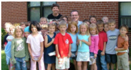
Start of the school year at St. George's Junior School in Etobicoke

- Одна з найдовших і болючіших проблем – це справа інтернованих українців під час Першої світової війни, яку безуспішно