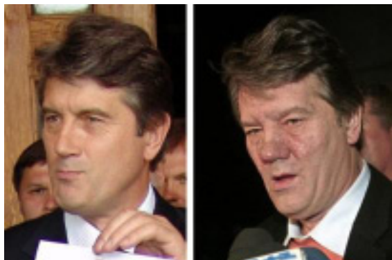
Кандидат на Президента України Віктор Ющенко перед виборами, до і після отруєння у вересні ц.р.