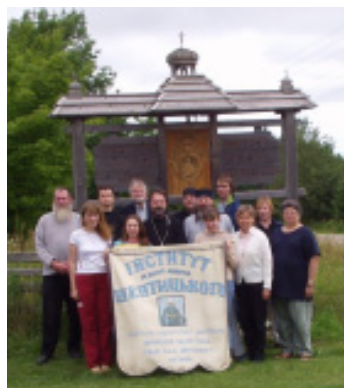
Students and professors gather for a group photo outside the Monastery of the Most Holy Theotokos in Orangeville, Ontario

The Metropolitan Andrey Sheptytsky Institute of Eastern Christian Studies Saint Paul University 223 Main Street, Ottawa ON K1S 1C4 Canada Tel: (613) 236-1393, ext. 2332 Fax: (613) 782-3026 E-mail: sheptytsky@ustpaul.ca Web: www.ustpaul.ca/Sheptytsky