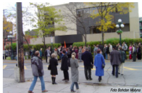
Біля виборчої дільниці № 41 перед приміщенням Посольства України в Канаді

Повертаючись до "Зустрічі", товариство створювалося з якою метою? — Історія така. Був такий, він і зараз