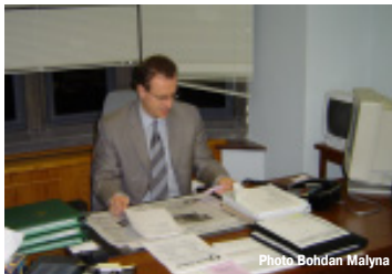
На робочому місці

депутат Михайло Лучкович. Відтоді в обох палатах парламенту побувало понад тридцять депутатів україн-ців, серед них відомий, як сенатор Юзик, Майкл Стар або Джон Гнатишин. На вашу думку, це багато чи мало в порівнянні до числа канадських українців? - Думаю, що це абсолютно зрозуміло, що це дуже мала цифра, а ще коли відрізати між сенатом і парламентом, то взагалі, дуже дивне явище, що так мало українців були в парламенті Канади.