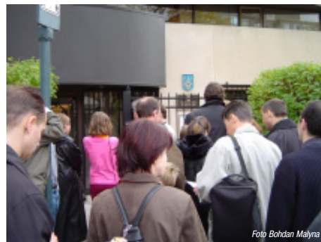
Виборці сходяться на дільницю.