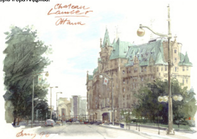
CHATEAU LAURIER water colour, 5"x 7", 1996

Його роботи духовно насичені, світлоносні, в глибинах яких ідуть постійні роздуми майстра про життя. У своїх картинах він з наполегливістю справжнього експериментатора продовжує пошуки образної мови. Вишуканий професіоналізм, технічна віртуозність, рука першокласного майстра – все це беззаперечні якості творів Ігора Андріїва.