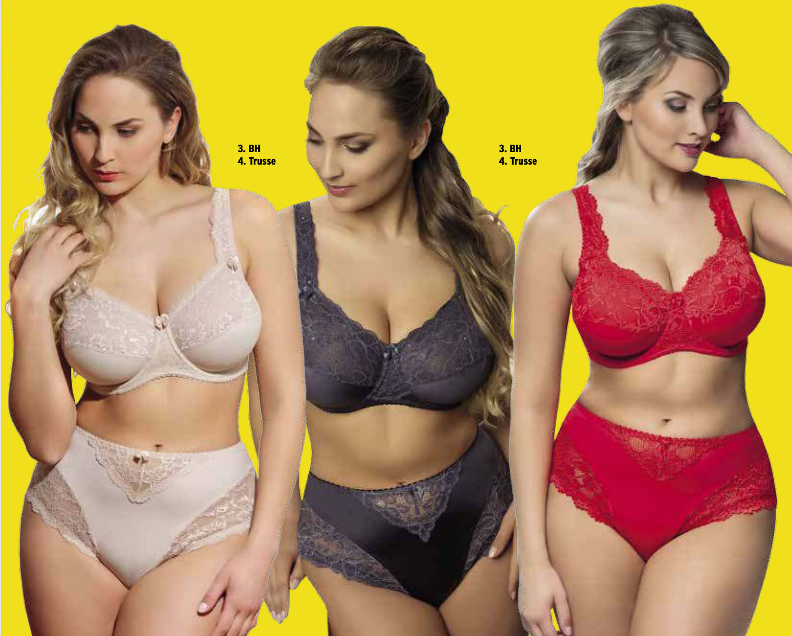
3. BH 4. Trusse