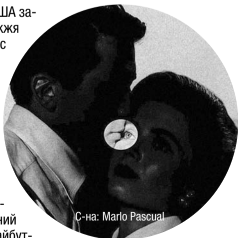
С-на: Marlo Pascual

Єпископи Католицької Церкви у США закликали вірних захищати подружжя як союз чоловіка та жінки. «Ісус Христос у своїй великій любові навчає, що подружжя – це союз одного чоловіка та однієї жінки, що триває до смерті одного з них. Унікальне значення подружжя вписане також у конструкцію, у природу нашого тіла. Як католицькі єпископи, ми наслідуюмо Христа та продовжуємо навчати так, як Він. Незважаючи на те, що вирішує Верховний Суд, подружжя – сьогодні і на майбутнє – залишається союзом чоловіка та жінки», – заявив архієпископ Йозеф Куртц, голова єпископату США. Єпископи попереджають, що наслідком ухвалення нового закону про одностатеві шлюби стане «неминучий конфлікт між державою та Церквою, наслідків якого зазнають прийдешні покоління».