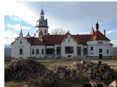
Enyedszentkirályon felújították a Bánffy-kastélyt, de a magyaroknak már nem sok közük lehet hozzá