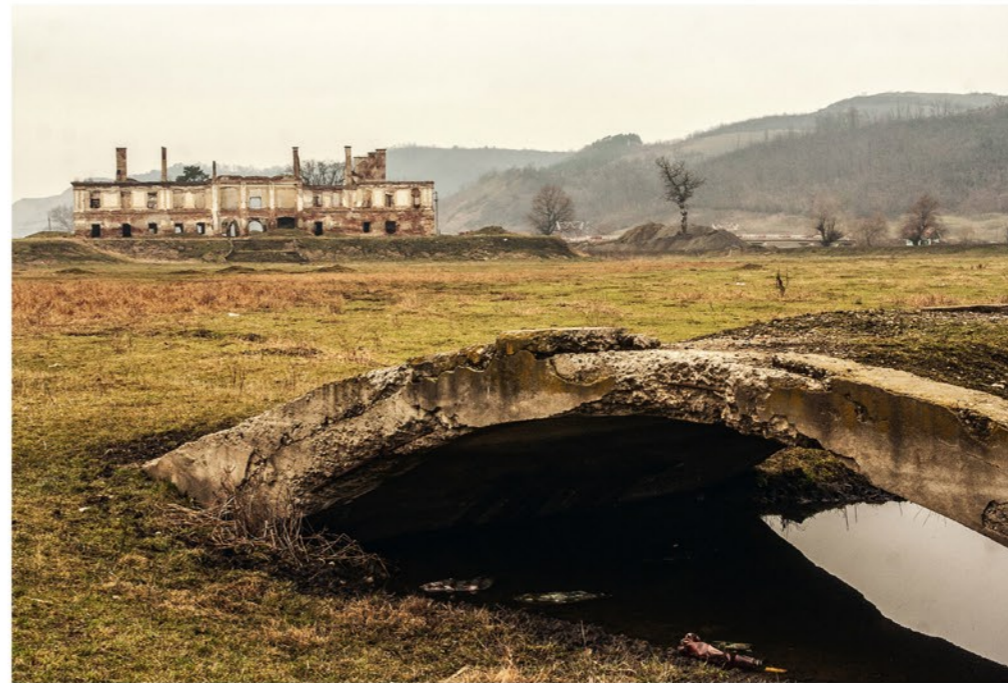
A kerélszentpáli Haller-kastély romjai az egykori parkból