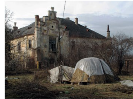
A felsőmarosújvári Teleki-kastély sorsa még nem dőlt el