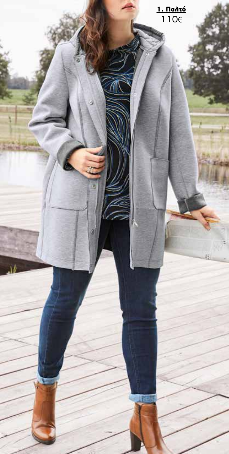
1. Παλτό 110€