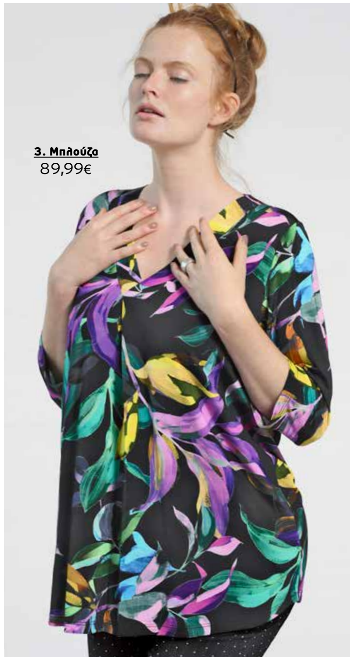
3. Μπλούζα 89,99€

1 Σακάκι με alllover φωτεινό τύπωμα, κλείσιμο με κουμπιά και μακριά μανίκια. 100% Viskose. Στεγνό καθάρισμα. Μήκος περίπου: 80 cm. Μεγέθ: 42/44, 46/48, 50/52, 54/56, 58/60