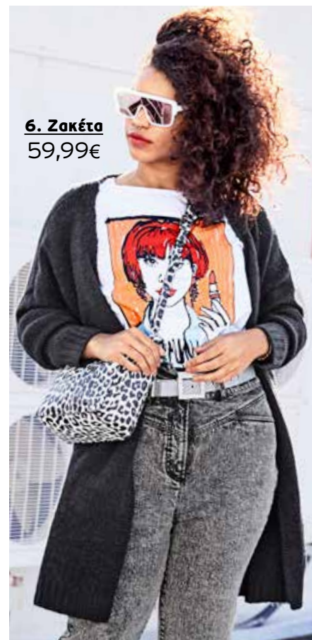
6. Ζακέτα 59,99€