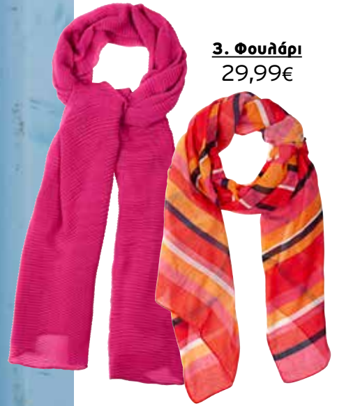
3. Φουλάρι 29,99€