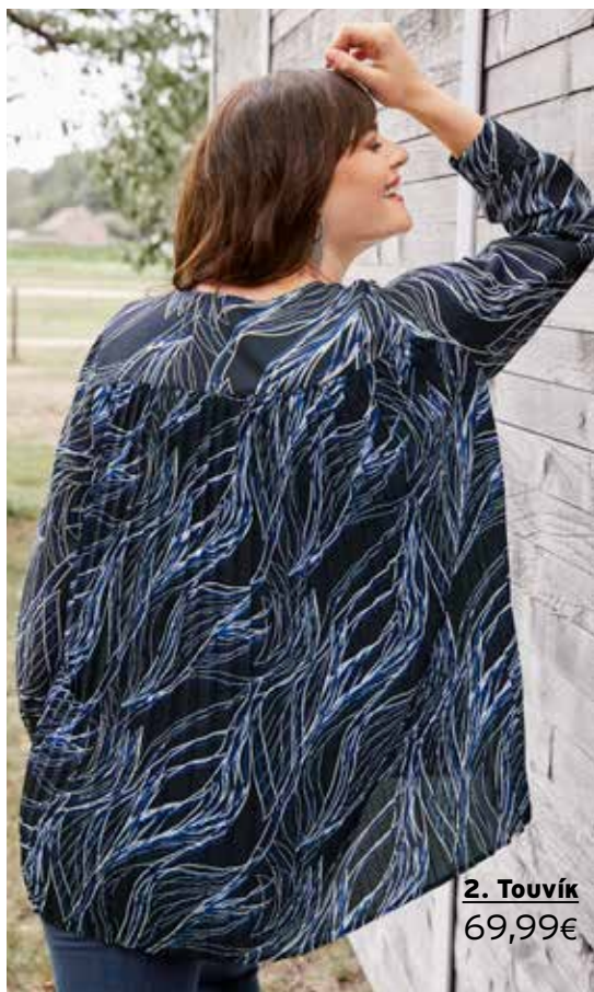
2. Τουνίκ 69,99€