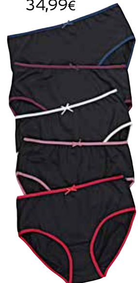
4. Σλιπ 5τμχ 34,99€