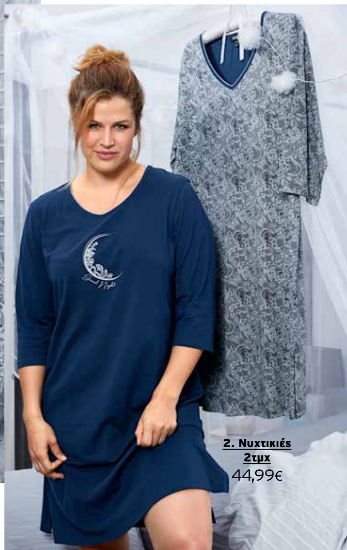
2. Νυχτικιές 2τμχ 44,99€

1 Πυτζάμα με 3/4 μανίκια και παντελόνι με alllover τύπωμα και λάστιχο στη μέση. 100% Cotton. Πλύσιμο στο πλυντήριο Μεγέθ: 42/44, 46/48, 50/52, 54/56, 58/60, 62/64, 66/68, 70/72, 74/76