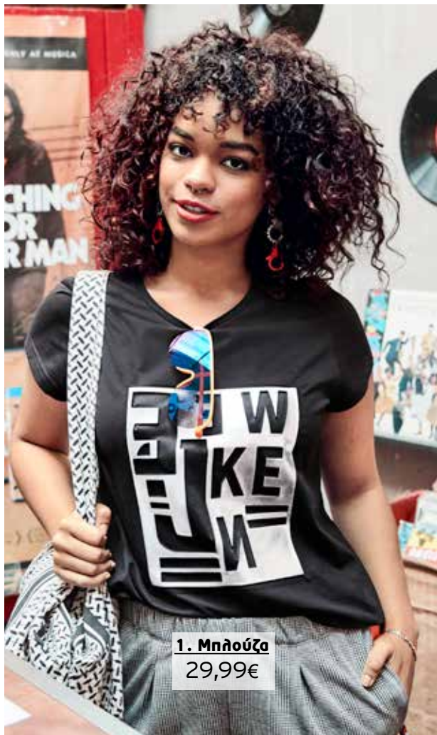
1. Μπλούζα 29,99€