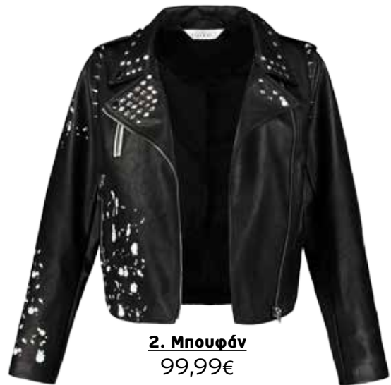
2. Μπουφάν 99,99€