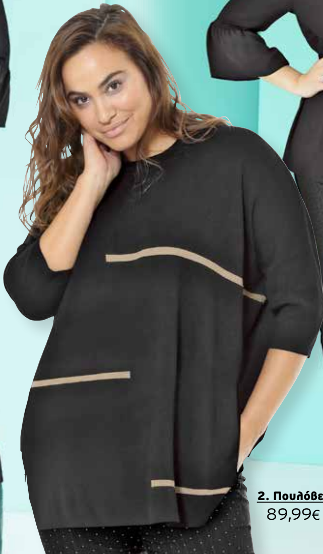
2. Πουλόβερ 89,99€