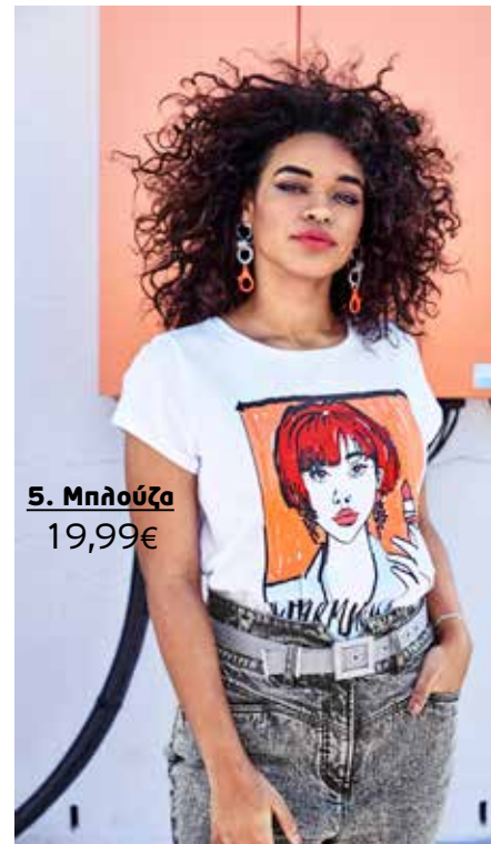
5. Μπλούζα 19,99€