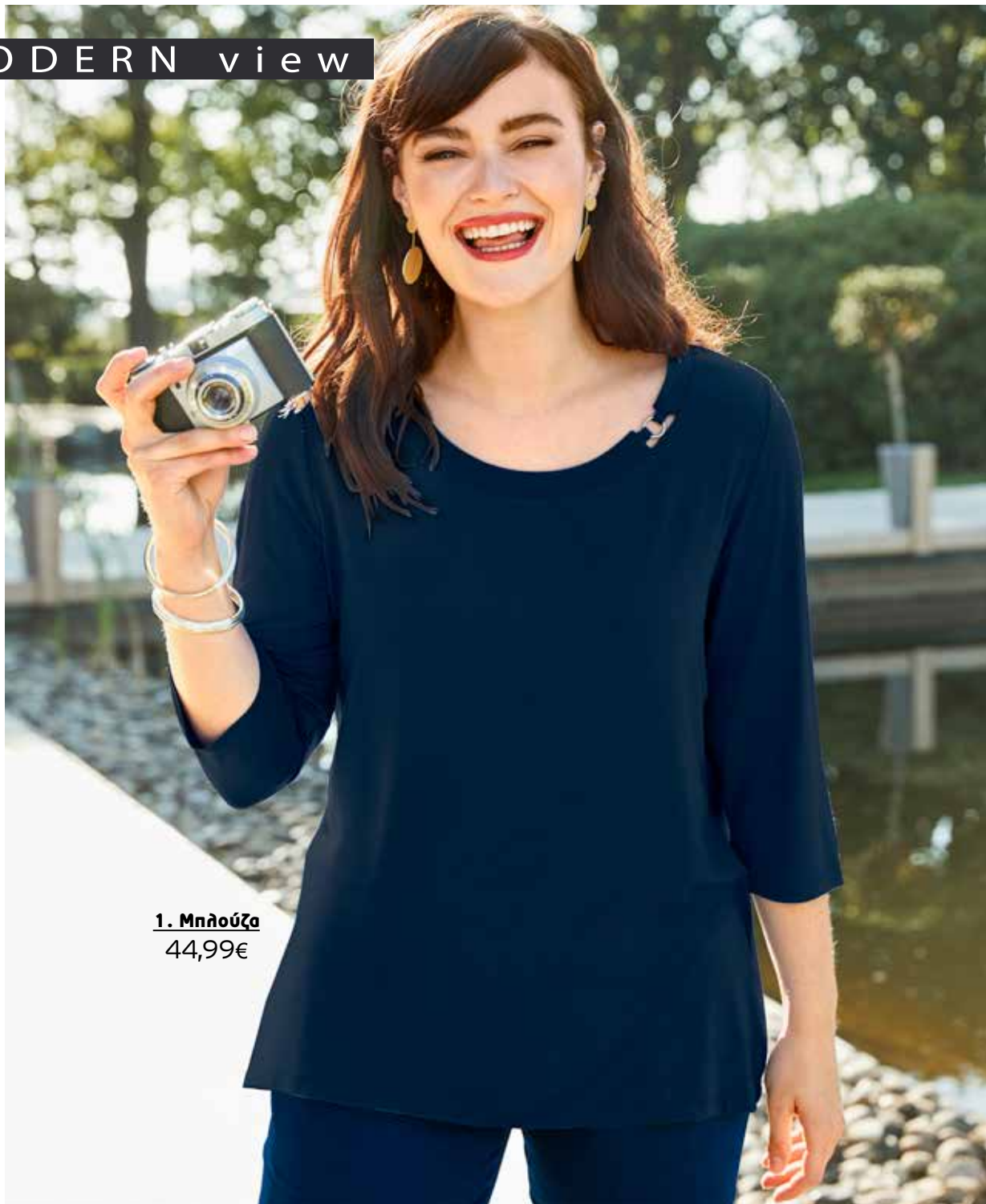
1. Μπλούζα 44,99€

1 Μπλούζα σε κλασική γραμμή, με διακοσμητικό κρίκο στη λαιμόκοψη και μακριά μανίκια. 95% Modal, 5% Elasthan. Πλύσιμο στο πλυντήριο. Μήκος περίπου, προσαρμοσμένο στο μέγεθος: 68 - 72 cm. Μεγέθη: 42/44, 46/48, 50/52, 54/56, 58/60, 62/64 727 240 70 Μπλε Σκούρο 44,99€