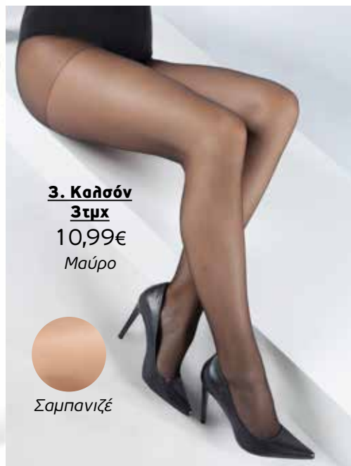
3. Καλσόν 3τμχ 10,99€ Μαύρο