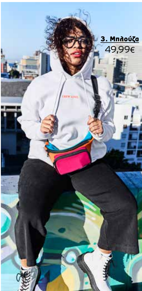
3. Μπλούζα 49,99€

1 Πουκαμίσια μακρὰ με σκισίματα στα πλαιῖα και αλλοιερ τυπωμα τύπου φιδιού. 100% Polyester. Πλύσιμο στο πλυντήριο. Μήκος περίπου, προσαρμοσμένο στο μέγεθος: 100 - 102 cm. Μεγέθη: 42/44, 46/48, 50/52, 54/56