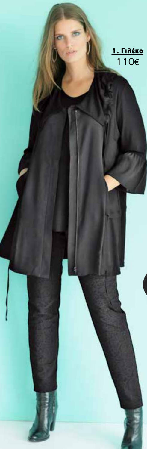
1. Γιλέκο 110€