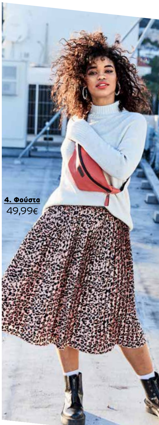
4. Φούστα 49,99€

5 Μπλούζα με στρογγυλή λαιμόκοψη και τύπωμα pop art στο μπροστινό μέρος. 100% Cotton. Πλύσιμο στο πλυντήριο. Μήκος περίπου, προσαρμοσμένο στο μέγεθος: 69 - 73 cm. Μεγέθη: 42/44, 46/48, 50/52, 54/56