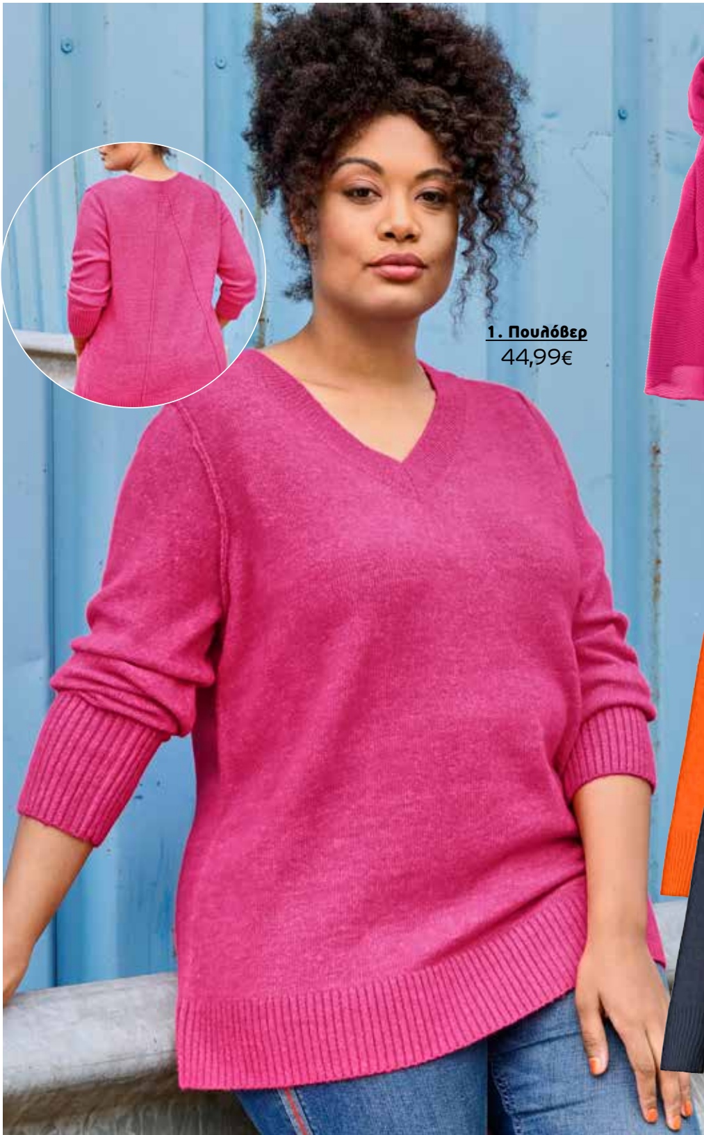
1. Πουλόβερ 44,99€