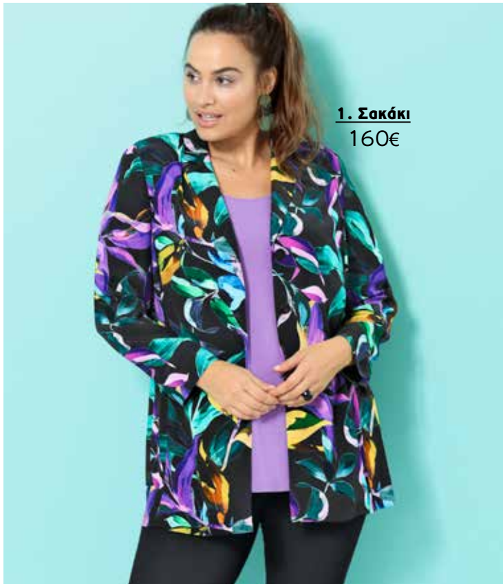
1. Σακάκι 160€