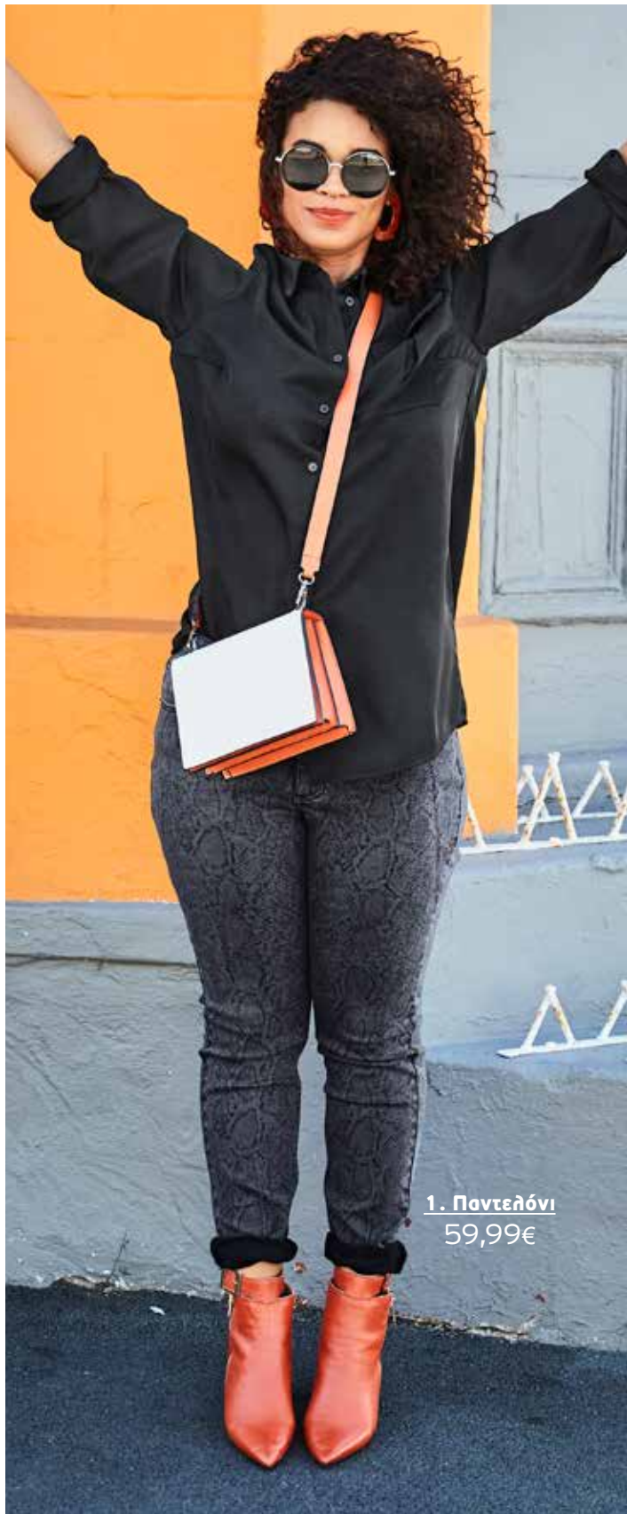
1. Παντελόνι 59,99€