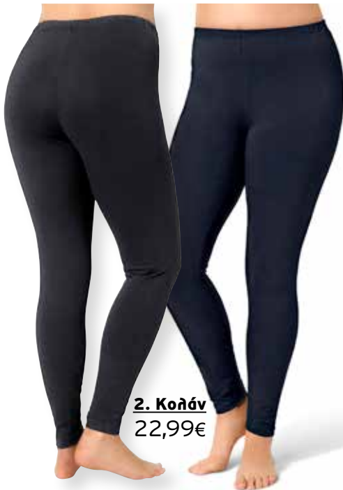
2. Κολάν 22,99€