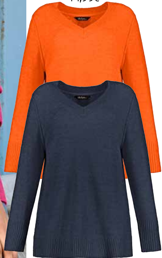
1. Πουλόβερ 44,99€