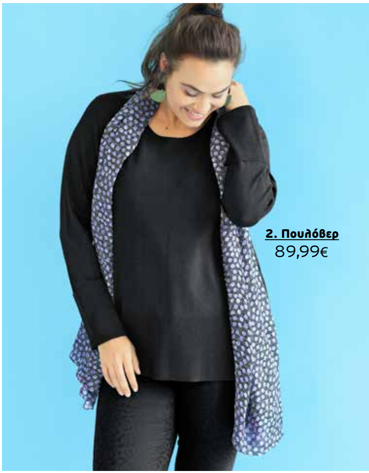
2. Πουλόβερ 89,99€