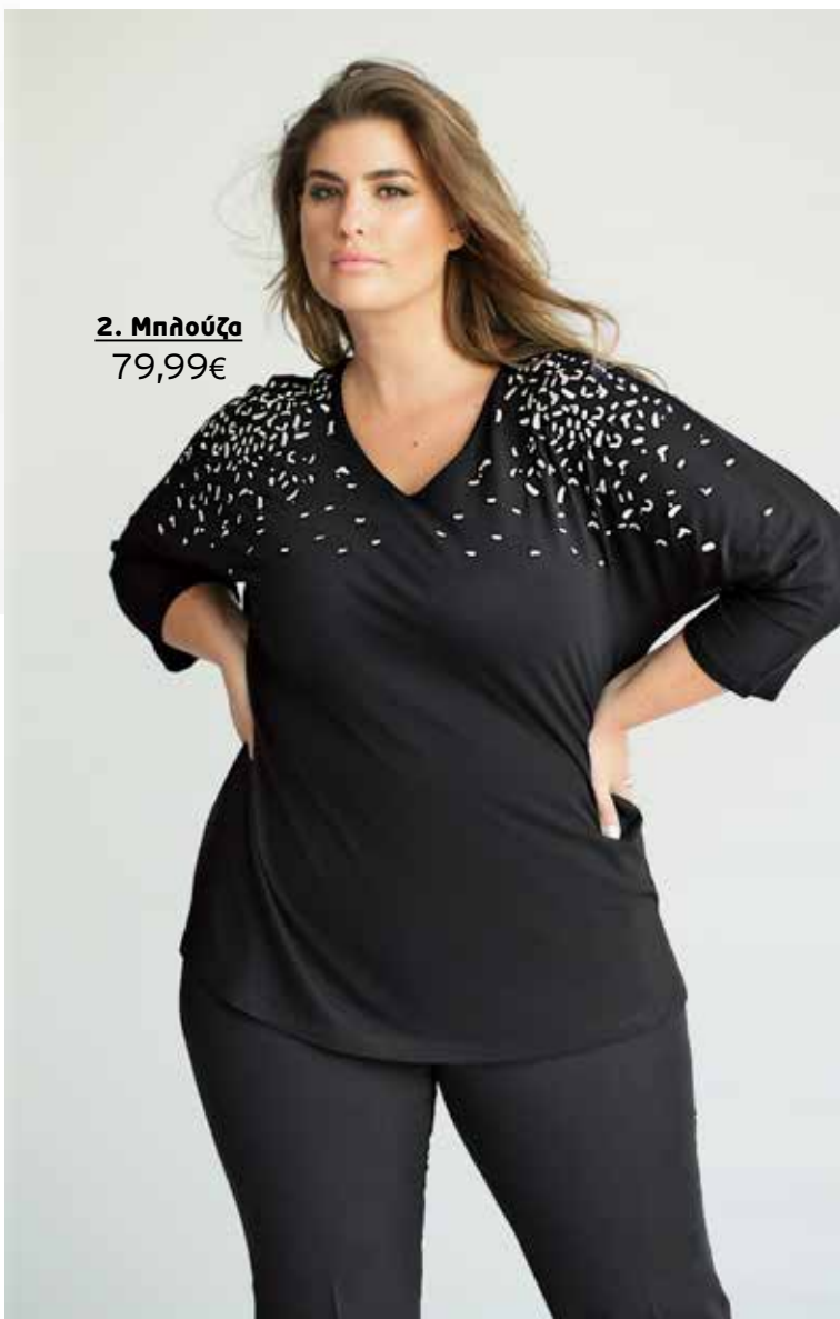
2. Μπλούζα 79,99€

1 Μπλούζα σε κλασική γραμμή, με όμορφη διακόσμηση στο λαιμό με στρας και πουλίες και μακριά μανίκια. 95% Viskose, 5% Elasthan / 100% Polyester. Πλύσιμο στο πλυντήριο. Μήκος περίπου, προσαρμοσμένο στο μέγεθος: 68 - 76 cm. Μεγέθη: 42/44, 46/48, 50/52, 54/56, 58/60