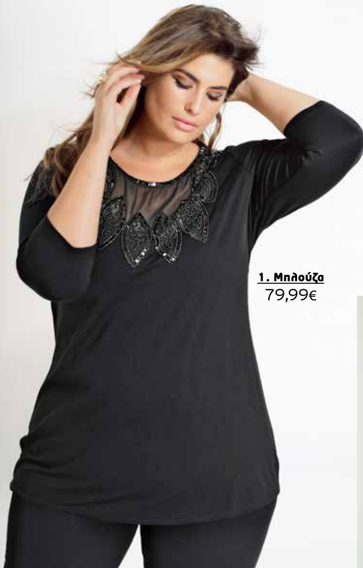
1. Μπλούζα 79,99€