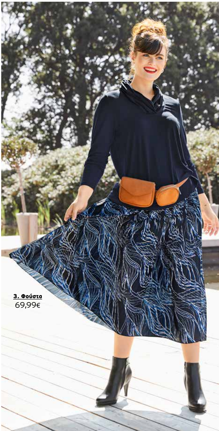
3. Φούστα 69,99€