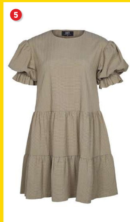
5. Kjole kr. 449 95 Smuk kjole fra Zoey i blød rillet kvalitet med stretch. Kjolen er syet i lag, har rund hals samt puf-ærmer. Lgd. 100 cm Kval. 57% viskose / 38% polyester / 5% elastan. Vask 30°. Normalpris kr. 899 95 . SPAR 450 kr. Vare nr. 24043-31