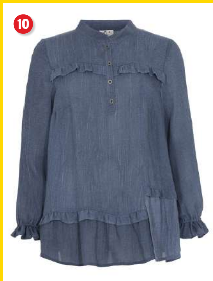
10. Skjortebluse kr. 399 95 Flot skjortebluse fra Que. Skjorteblusen er i en dejlig viskose kvalitet med feminine flæser. Den har knapper ved brystet og lange ærmer med elastik ved håndledet. Lgd. 71 cm. Kval. 100% viskose. Vask 30°. Normalpris kr. 799 95 . SPAR 400 kr. Vare nr. 24140-13