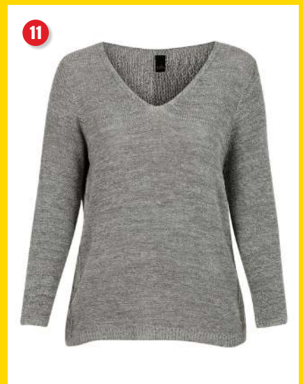
11. Strikbluse kr. 249 95 Smuk strikbluse fra Adia. Blusen er i en strikket kvalitet med smuk let lurex. Den har V-hals og lange ærmer. Lgd. 78 cm. Kval. 65% akryl, 35% polyamid. Vask. 30°. Normalpris kr. 499 95 . SPAR 250 kr. Vare nr. 24179-13