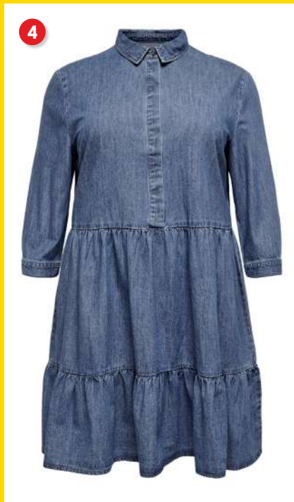
4. Kjole kr. 199 95 Smart denim kjole fra Only Carmakoma. Kjolen er i en smart denim kvalitet og har A-facon. Den har skjulte knapper ned langs brystet samt 3/4 ærmer med knap forned. Lgd. 102 cm. Kval. 100% bomuld. Vask 30°. Normalpris kr. 399 95 . SPAR 200 kr. Vare nr. 24405-13