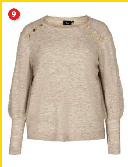
9. Strikbluse kr. 299 95 Flot strikbluse fra Zizzi. Den har fine pynteknapper foroven samt ribkant forned. Den har rund hals og lange ærmer med ribkant forned. Lgd. 71 cm. Kval. 62% polyester, 23% akryl, 8% polyamid, 3% elasthan. Vask 40°. Normalpris kr. 449 95 . SPAR 150 kr. Vare nr. 24082-13