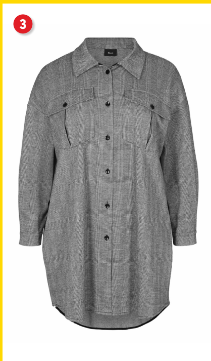
3. Skjorte kr. 299 95 Den har rigtig god stretch. Den har to brystlommer som lukkes med knap. Den lukkes med knapper foran og har lange ærmer med knap ved håndledet. Lgd. 105 cm. Kval. 98% polyester, 2% elastan. Vask 30 °. Normalpris kr. 599 95 . SPAR 300 kr. Vare nr. 24064-31