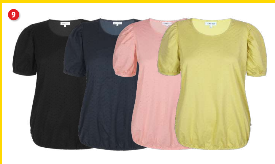
9. Bluse kr. 129 95 Flot bluse fra Zhenzi. Blusen er i en blød bomulds kvalitet med et let små hullet mønster. Den har rund hals og korte ærmer samt let elastikkant forned. Lgd. 73 cm. Kval. 100% bomuld. Vask 40 °. Normalpris kr. 249 95 . SPAR 120 kr. Vare nr. 24558-31