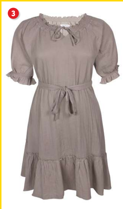
3. Kjole kr. 249 95 Flot kjole fra Zhenzi. Den har et aftagelig bindebånd i taljen og korte ærmer med smock (let elastikkant). Den har rund hals med bindebånd og lille smockkant. Lgd. 108 cm. Kval. 100% bomuld. Vask 40°. Normalpris kr. 499 95 . SPAR 250 kr. Vare nr. 24687-13