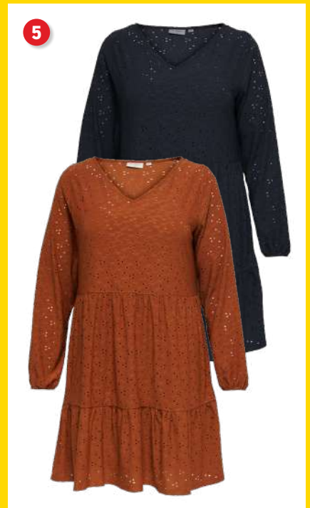
5. Kjole kr. 199 95 Smuk kjole fra Only Carmakoma. Den har feminint hulmønster, indsyet underkjole, V-hals og lange ærmer med let elastik ved håndledet. Lgd. 100 cm. Kval. 95% polyester, 5% elasthan. Kval. foer. 100% polyester. Vask 30°. Normalpris kr. 329 95 . SPAR 130 kr. Vare nr. 24374-13