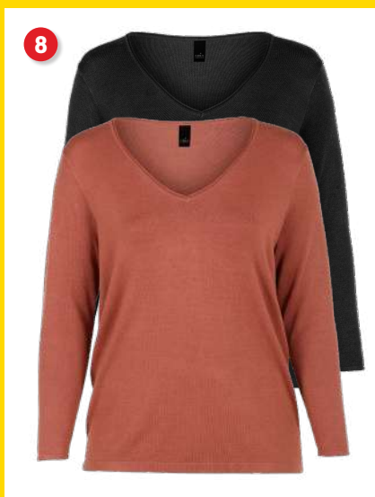
8. Strikbluse kr. 199 95 Lækker strikbluse fra Adia. Blusen er i en strikket kvalitet. Den har V-hals og lange ærmer. Lgd. 76 cm. Kval. 75% viskose, 25% polyamid. Vask 30 °. Normalpris kr. 399 95 . SPAR 200 kr. Vare nr. 24180-31