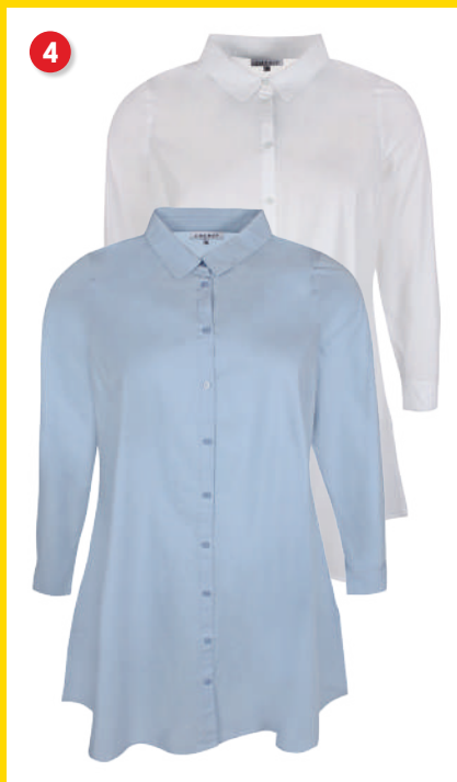
4. Skjorte kr. 199 95 Lang skjorte fra Zhenzi i bomuld. Skjorten har lange ærmer med manchetter, er gennemknappet og har krave ved hals. Den har meget A-facon og har slidser i siderne. Lgd. 94 cm. Kval. 100% bomuld. Vask 30°. Normalpris kr. 399 95 . SPAR 200 kr. Vare nr. 24010-31