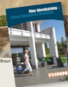
Fiero Platten rustica Sahara-Beige

Ideenkatalog kostenlos bestellen! Telefon: 0800 1007466 oder im Internet unter www.rinn.net