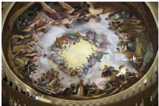
Ο Θόλος του καπιτωλίου- Η αποθέωση του Ουάσιγκτον

Πριν όμως αναφερθούμε στο έργο του Μπρουμίδη καλόν θα ήταν να πούμε λίγα λόγια για τη ζωή του και για το πώς βρέθηκε στη Αμερική. Ο πατέρας του κατά τα «Ορλωφικά» το 1770 και τους Τούρκικους διωγμούς που ακολούθησαν αναγκάστηκε να καταφύγει καταρχάς στη Ζάκυνθο και από εκεί στην Ιταλία, όπου παντρεύτηκε την Άννα Μπιανκίνι. Ο Κων/νος γεννήθηκε το 1806. Οι δικοί του διέγινωσαν από τη μικρή ηλικία το μεγάλο του ταλέντο και σε ηλικία 13 ετών τον έγραψαν στην Ακαδημία καλών τεχνών του Αγίου Λουκά στη Ρώμη, όπου σπούδασε κοντά στους μεγάλους Ιταλούς ζωγράφους Αντόνιο Κανόβα και Μπερτέλ Τόρβαλτσεν. Επηρεάστηκε από το μεγάλο Ιταλό ζωγράφο της αναγέννησης Ραφαήλ, του οποίου ανέλαβε να συντηρήσει τις τοιχογραφίες στο Βατικανό. Ειδικεύτηκε δε στην τοιχογραφία και έγινε πολύ γνωστός στην Ιταλία και μάλιστα του ανατέθηκε η προσωπογραφία του πάπα Πίου του Θ'.