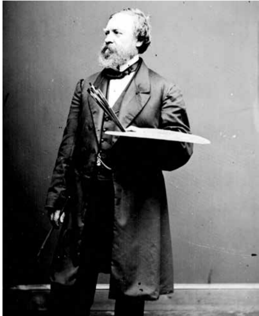
Ο Κ. Μπρουμίδης

Τα θλιβερά γεγονότα των μέσων Ιανουαρίου στην Αμερική με την εισβολή διαδηλωτών στο Αμερικανικό Καπιτώλιο και τις καταστροφές που επήλθαν από αυτές στον εσωτερικό χώρο του μεγάρου έκαναν ευρύτερα γνωστό κάτι που αγνοούσαν οι περισσότεροι ότι δηλαδή ο ζωγράφος, ο οποίος διακόσμησε το Αμερικανικό Καπιτώλιο ήταν Έλληνας. Στην Ελλάδα το άκουσμα της είδησης μας παραξένεψε και συγχρόνως μας γέμισε με περηφάνεια, διότι η Ελληνική ευφυΐα και ικανότητα είναι «διάσπαρτη» σε όλη την οικουμένη! Ο Έλληνας αυτός λοιπόν, ο ζωγράφος του Καπιτωλίου, είναι ο Κωνσταντίνος Μπρουμίδης καταγόμενος από τα Φιλιατρά της Μεσσηνίας.