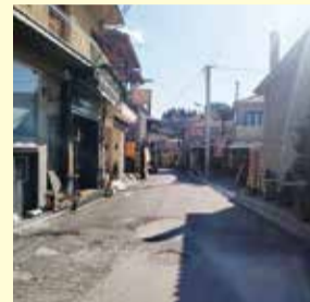
Οι άλλοτε πολυσύχναστοι δρόμοι έρημοι, με πολλά καταστήματα κλειστά

Αν υπολογίσουμε και το πρώτο δίμηνο του 2021 ήδη συμπληρώνεται ένας χρόνος από τότε που πάρθηκαν τα πρώτα μέτρα για τον Κορωνοϊό. Και στο διάστημα αυτό είχαμε επτάμισυ μήνες αυστηρών απαγορεύσεων, που δεν επιτρεπόταν η κίνηση από νομό σε νομό. Το πλέον παραγωγικό κομμάτι επισκεψιμότητας της περσινής άνοιξης και του φθινοπώρου και του φετινού χειμώνα χάθηκε. Από το τέλος Οκτωβρίου και ιδιαίτερα κατά τη διάρκεια των εορτών των Χριστουγέννων και της Πρωτοχρονιάς δεν επισκέφθηκε κανένας τη Βυτίνα, η οποία έμεινε τελείως απομονωμένη όπως και όλη η χώρα. Είναι γεγονός ότι την τελευταία τριακονταετία ο τόπος μας έχει συνδέσει κάθε επαγγελματική δραστηριότητα με τον χειμερινό τουρισμό και όλες οι επιχειρήσεις, που έχουν δημιουργηθεί στη Βυτίνα συνδέονται λίγο-πολύ με αυτόν.