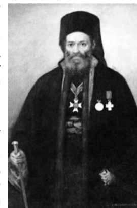
Ο Βρεσθένης Θεοδώρητος

Εκείνος όμως που κοσμήει το πάνθεον των καταγόμενων από τη Νεμνίτσα πρώων του 1821, είναι ο Επίσκοπος Βρεσθένης Θεοδώρητος . Γεννήθηκε στη Νεμνίτσα το 1787 και ήταν γιος του προεστού του χωριού Βασίλειου Αναγνωστόπουλου και της Αικατερίνης . Εδιδάχθη τα πρώτα γράμματα από δασκάλους ιερείς στην περίφημη σχολή Βυτίνας.