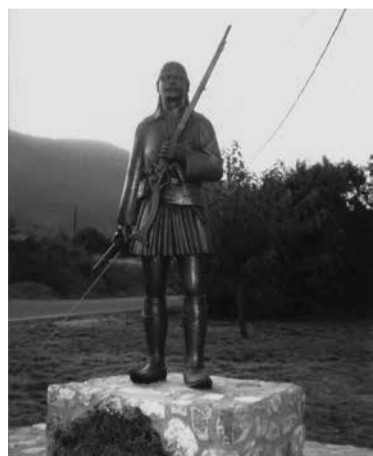
Κόλλιας ο Βυτινιώτης

Α' Προεπαναστατική περίοδος: Αν και η κωμόπολη ήταν «βακούφιο», δηλαδή προστατευόμενη περιοχή ανήκουσα απευθείας στη Σουλτάνα και δεν εγκαταστάθηκαν ουδέποτε Τούρκοι ή Τουρκικές αρχές αλλά μόνο διερχόμενοι, ουδέποτε «έσκυψε το κεφάλι» ή συμβιβάστηκε με την κατάσταση της δουλείας και πάντοτε αφενός καλλιεργούσε το πνεύμα της ελευθερίας και αφετέρου υπέθαλπε τους διωκόμενους Έλληνες ή τους «κλέφτες». Η πρώτη συμμετοχή των Βυτιναιών σε πολεμική επιχείρηση εναντίον των Τούρκων σημειώνεται το 1715, όταν αυτοί επιχείρησαν την ολοκληρωτική υποδούλωση του Μοριά μετά την αποχώρηση των Επών. Ένα Τουρκικό εκστρατευτικό σώμα 7.000 στρατιωτών υπό τον Ασουμάν Πασά ξεκίνησε από την Πάτρα, πέρασε από τα Καλάβρυτα, τα οποία κατέλαβε χωρίς αντίσταση από τον φόβο των σφαγών και προχώρησε προς το εσωτερικό της Γορτυνίας. Τότε ο Δήμος Κολοκοτρώνης και ο γιος του Μπότσικας, παππούς του Θεόδωρου Κολοκοτρώνη, συγκέντρωσαν 200 Αρκουδορεματίτες, Λυμποβισιώτες και Αλωνισιιώτες στους οποίους προστέθηκαν και εκατό Βυτινιώτες και Γρανιτσιώτες, όπως γράφει ο Δ. Καρατζίνης στην «ιστορία της Βυτίνας», και αντιμετώπισαν τους Τούρκους στο «Αγγελόκαστρο» προσπαθώντας να ανακόψουν την πορεία τους προς το εσωτερικό της Γορτυνίας. Οι λίγοι Έλληνες μετά και από προδοσία υπέστησαν δεινή καταστροφή, αν και πολέμησαν γενναία, και μόνο οι δύο Κολοκοτρωνιοί με λίγους συντρόφους σώθηκαν. Αρκετοί Βυτινιοί ήταν μεταξύ των νεκρών.