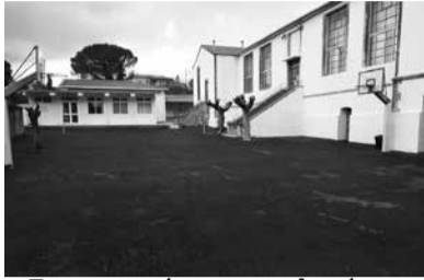
Το επιστρωμένο με ασφαλτοτάπητα προαύλιο