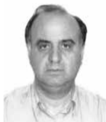
ΓΡΑΦΕΙ: Ο φιλόλογος Απόστολος Γ. Τζίφας

Είμαστε στο έτος που θα γιορτάσουμε- όσο το επιτρέπουν οι υγειονομικές συνθήκες- τα 200 χρόνια από τη μεγάλη ελληνική Επανάσταση του 1821.