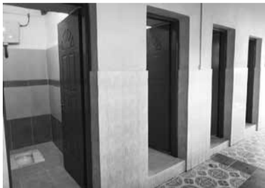
Οι ανακαινισμένες τουαλέτες