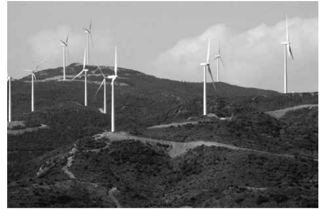
Αυτή την ακαλαίσθητη εικόνα θα έχει και το Μάιναλο αν τοποθετηθούν ανεμογεννητρίες

Στις 15-1-2021 στην ιστοσελίδα της ΡΑΕ (Ρυθμιστική αρχή ενέργειας) αναρτήθηκε αίτημα για εγκατάσταση 54 ανεμογεννητριών σε περιοχή του Μαινάλου μεταξύ Στεμνίτσας και Χρυσοβιτσιού, 49 ανεμογεννητριών στο βόρειο Μάιναλο στα όρια των δημοτικών ενότητων Βυτίνας, Κλείτορος και Κοντοβάζινας και 72 ανεμογεννητριών στο όρος Λύκαιο και στα όρια της δημοτικής ενότητας Ανδρίτσαινας. Βέβαια το όλο σχέδιο στηρί-