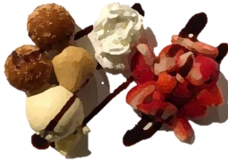
Heiße Sesam- und Reisbällchen an Vanilleeis und frischen Erdbeeren, Schokoladensauce, Sahne