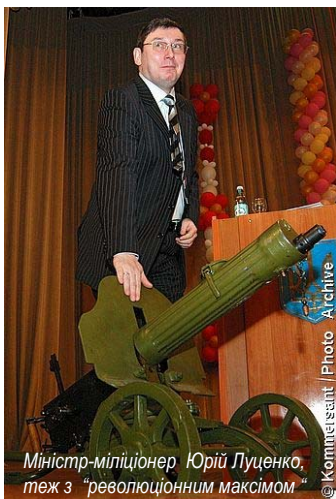
Міністр-мільйонер Юрій Луценко, теж з "революційним максимом"