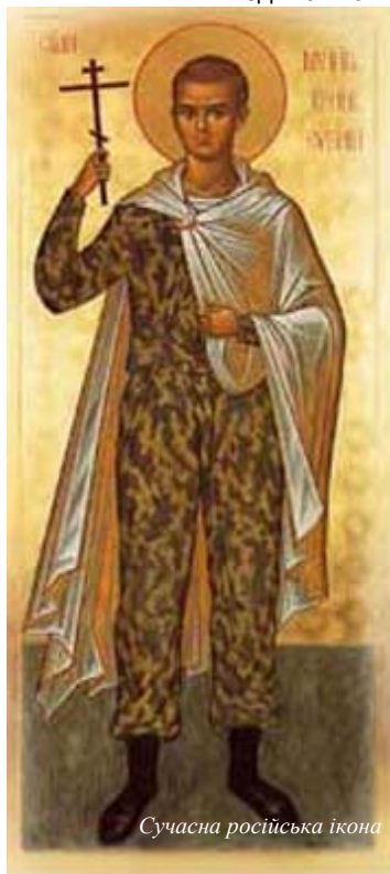
Сучасна російська ікона

Зокрема, у зверненні відзначено, що розкол, що відбувся після створення УПЦ КП, привів до істотної "політизації релігійного середовища на Україні". Також у зверненні висловлюється протест проти передачі Єкатерининського собору в Чернігові УПЦ КП. Представники православних церков закликали "врегулювати в правовому руслі церковне питання в Україні". Звернення підписали предстоятелі православної церкви в Америці, Чехії і Словаччині, митрополити православних церков європейських країн, Африки, а також глава УПЦ МП митрополит Володимир.