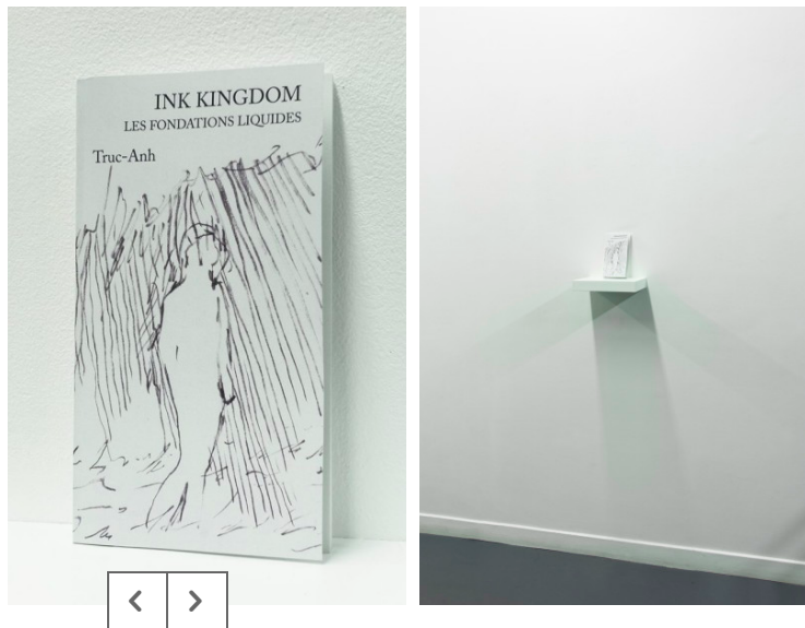
1-2. Les fondations liquides collection, Truc-Anh

Les quatre vers cités plus haut sont à ce propos assez ouverts d'interprétation et n'ont pas vocation à expliquer ma pratique. Ils ouvrent mon recueil « Les Fondations Liquides » qui vient de rentrer à la bibliothèque des Beaux Arts de Paris.