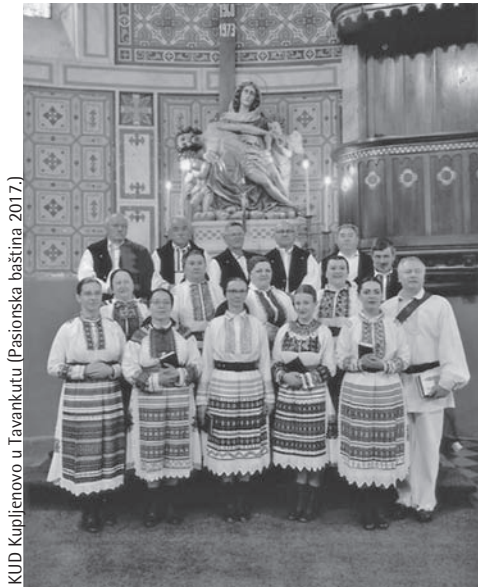
KUD Kupljenovo u Tavankutu (Pasionska baština 2017.)