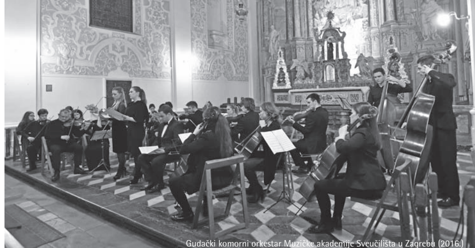
Gudački komorni orkestar Muzičke akademije Sveučilišta u Zagrebu (2016.)

G. Fauré: In Paradisum (Requiem Op. 48 VII st.)