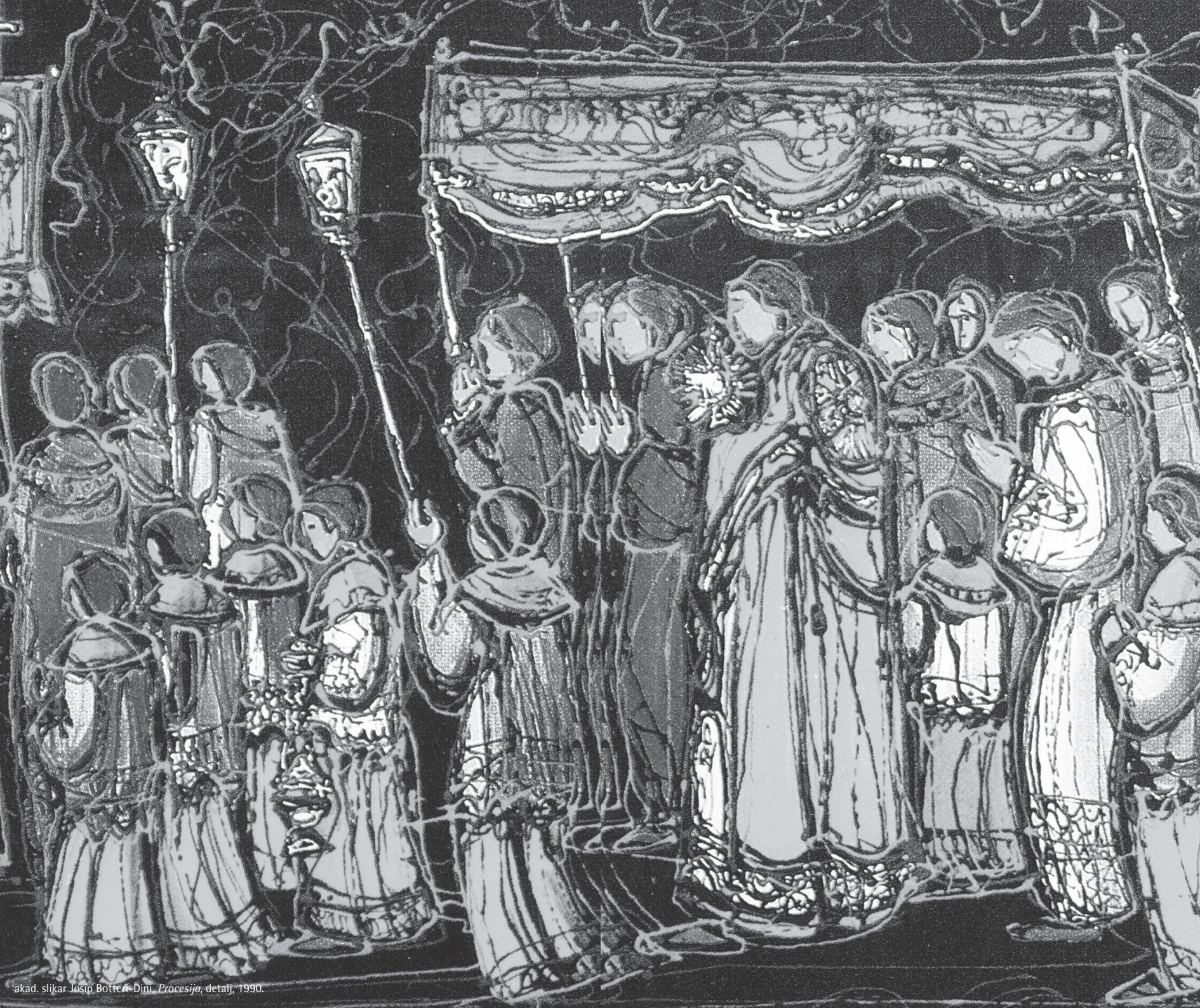
akad. slikar Josip Botten - Dini, Procesija , detalj, 1990.