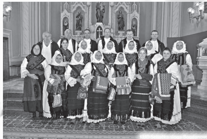
KUD Seljačka sloga Bogdanovci

KUD Seljačka sloga Bogdanovci djeluje od 1936. g., a njeguje izvorne pjesme, plesove i ruho svoga kraja. Gostuju na svim značajnijim smotrama folklornog stvaralaštva ( Vinkovačke jeseni, Đakovački vezovi, Međunarodna smotra folkloru u Zagrebu... ). U Domovinskom ratu Društvo je pretrpjelo velike gubitke – potpuno su uništene narodne nošnje, glazbeni instrumenti i sve potrebno za rad jedne folklorne skupine. Od progonstva do danas veliki se trud ulaže u obnavljanje tradicijskog ruha, zapisivanje i uvježbavanje pjesama, kola i običaja, a sve kako bi se sačuvala i predstavila tradicijska, šokačka, pradjedovska kultura i baština. Društvo broji 60-ak aktivnih članova u nekoliko sekcija, a organizator je tradicionalnih Folklornih večeri, Korizme u Bogdanovci i Šokačke večere .