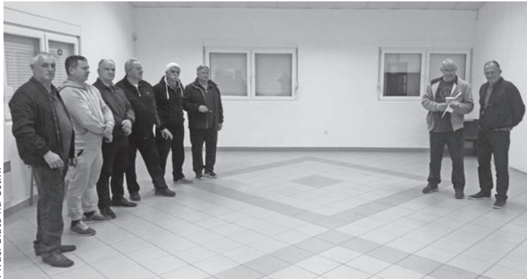
Pivači Blato na Cetini

Današnja župa Blato nalazi se s obje strane rijeke Cetine koje povezuje kameni most. Blato je, baš kao i Žeževica, dio povijesno- kulturne cjeline "Radobilja" i u tim okvirima se razvijalo. Župa je od kraja 15.st. do 1715. pod vlašću Osmanskog Carstva. Organski dekret austrijske vlade iz 1849. izrijeком navodi da Blato ostaje župa s kapelanijom u Novim Selima.