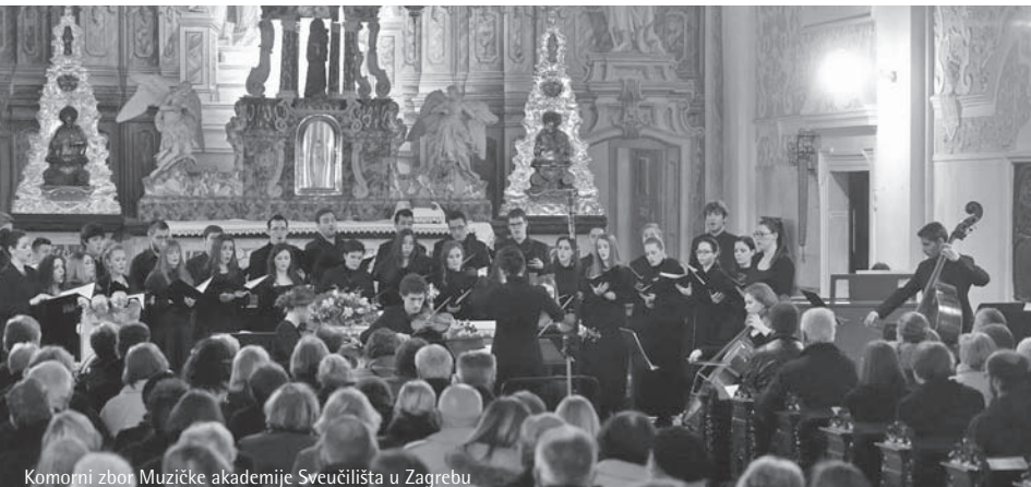
Komorni zbor Muzičke akademije Sveučilišta u Zagrebu

Komorni zbor Muzičke akademije Sveučilišta u Zagrebu je u prošlom desetljeću nastupao u brojnim prigodama, od Dana sveučilišta do Muzičkog biennala Zagreb. Osmišljen kao izborni kolegij, Komorni zbor okuplja studente svih odsjeka Muzičke akademije. Osnovan je s idejom njegovanja specifičnog zborskog repertoara, od a cappella programa do najraznovrsnijih suradnji s brojnim ansamblima i solistima. Tijekom svojih devet koncertnih sezona održao je niz cjelovečernih koncerta u Koncertnoj dvorani Vatroslava Lisinskog, Hrvatskom glazbenom zavodu, Muzeju za umjetnost i obrt, Crkvi sv. Franje Asiškog, Crkvi sv. Katarine, u Muzeju Mimara u Zagrebu, u Franjevačkoj crkvi u Samoboru, na Svečanostima Pasijske baštine, Samoborskoj glazbenoj jeseni, Festivalu adventskih i božićnih pjesama Zagreb 2018, Muzičkom biennalu te u Kazinskoj dvorani, Ljubljana (Slovenija).