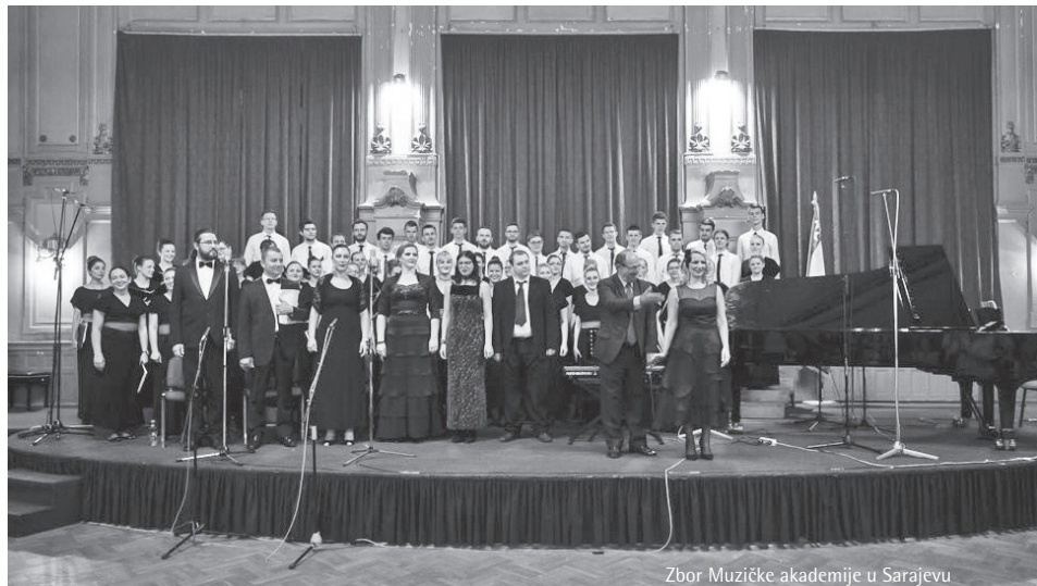
Zbor Muzičke akademije u Sarajevu