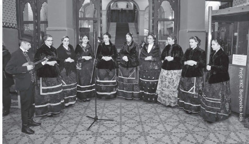
Prelje HKC Bunjevačko kolo

"Bunjevački Put križa" autora Tomislava Žigmanova pisan je na bunjevačkoj ikavici. Uz tekst 14 postaja Puta križa nalaze se tekst i napjev po Lajči Budanoviću koji je po sjećanju zapisala Đula Milodanović, a notirao Vojislav Temunović.