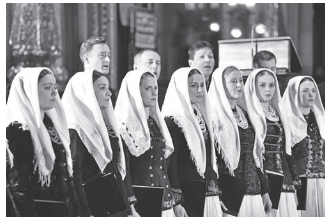
Lado (27. Svečanosti Pasionске Bašine, 2018.)

Ansambel narodnih plesova i pjesama Hrvatske LADO profesionalni je folklorni ansambel osnovan 1949. godine sa zadaćom i ciljem istraživanja, prikupljanja, umjetničke obrade i scenskoga prikazivanja najljepših primjera bogate hrvatske glazbene i plesne tradicije. LADO kroz svoj rad okuplja najpoznatije hrvatske etnokoreologe i koreografe, etnomuzikologe, glazbene aranžere i folkloriste, ali i skladatelje i dirigente nadahnute pučkim glazbenim stvaralaštvom. Sve je to rezultiralo impozantnim koreografskim i glazbenim repertoarom s više od stotinu koreografija i stotinama vokalnih, instrumentalnih i vokalno-instrumentalnih brojeva, u kojima se iznad svega poštuje izvorna, autentična narodna umjetnost.