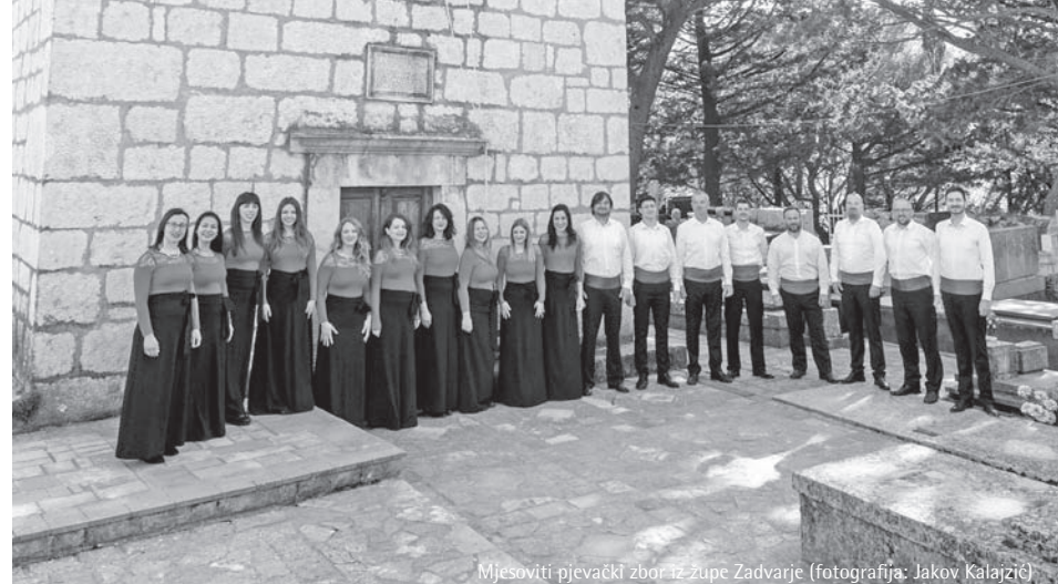
Mjesoviti pjevački zbor iz župe Zadvarje