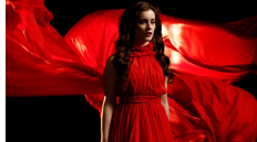
18 VERENIGD KONINKRIJK LUCIE JONES "NEVER GIVE UP ON YOU"