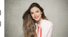
26 FRANKRIJK ALMA "REQUIEM"