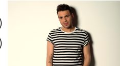
19 CYPRUS HOVIG "GRAVITY"