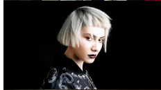
12 AZERBEIDZJAN DIHAJ "SKELETONS"