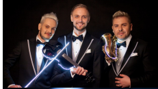
06 NEDERLAND OG3NE "LIGHTS AND SHADOWS"