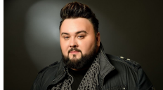
13 KROATIË JACQUES HOUDEK "MY FRIEND"