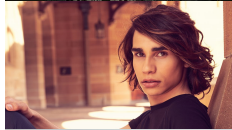
14 AUSTRALIË ISAIAH "DON'T COME EASY"