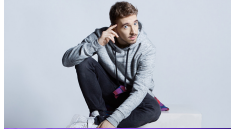
03 WIT-RUSLAND NAVIBAND "STORY OF MY LIFE"