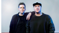
17 NOORWEGEN JOWST "GRAB THE MOMENT"