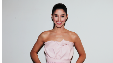
15 GRIEKENLAND DEMY "THIS IS LOVE"