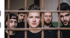
22 OEKRAÏNE O.TORVALD "TIME"