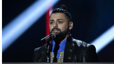
07 MOLDAVIË SUNSTROKE PROJECT "HEY MAMMA"