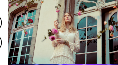
23 BELGIUM BLANCHE "CITY LIGHTS"