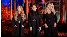
05 ARMENIË ARTSVIK "FLY WITH ME"