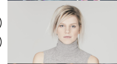
21 LAND LEVINA "PERFECT LIFE"