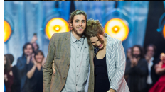
11 PORTUGAL SALVADOR SOBRAL "AMAR PELOS DOIS"