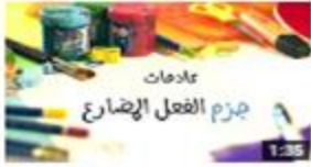
جزم الفعل المضارع 296 views · 3 months ago