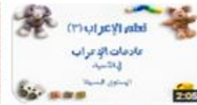
سلسلة تعلم الإعراب (٣) عناصر الإعراب في الإعراب - المستوى البسيط 132 views · 1 month ago