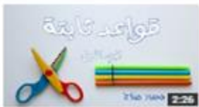
قواعد ثلاثة تساعد في الإعراب الجزء الأول 125 views · 6 days ago