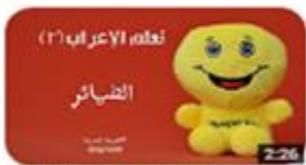
سلسلة تعلم الإعراب (٢) الضمائر 347 views · 2 months ago