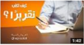
كتابة التقرير: كيف تكتب تقريرًا؟ 192 views · 2 months ago