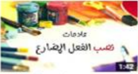
نصب الفعل المضارع 153 views · 3 months ago