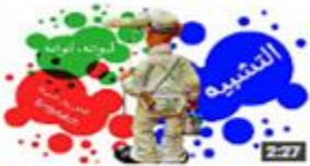
التشبيه: أجزاءه ، أدواته ، أنواعه 398 views · 1 month ago