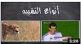
أنواع التثنية 821 views · 3 months ago