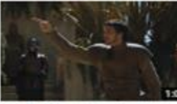
بناء فعل الأمر ٢ (مع نون التوكيد أو نون النسوة) 117 views · 3 months ago