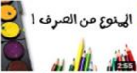
الإسم المنوع من الصرف ١ 570 views · 3 months ago