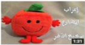
إعراب المضارع صحيح الآخر 226 views · 3 months ago