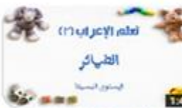
سلسلة تعلم الإعراب (٢) الضمائر - المستوى البسيط 195 views · 2 months ago