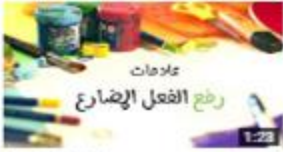
رفع الفعل المضارع 179 views · 3 months ago