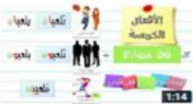
الأعمال الخمسة وكيف تعربها 64 views · 1 week ago