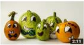
إعراب المضارع 1,024 views · 3 months ago