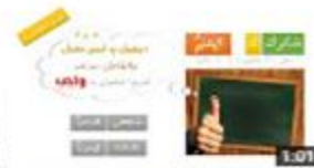
ملف إعراب: شركت المعلم 53 views · 2 weeks ago