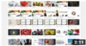
الجملة البسيطة - فيديو تعريفي 275 views · 3 months ago