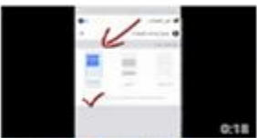
كيف تتشاهد ما نشره صفحة # العربية السهلة على فيسبوك؟ 51 views · 2 months ago