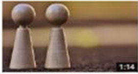
الإضافة الظنية - الإضافة النحوية: ما قبله 457 views · 2 months ago