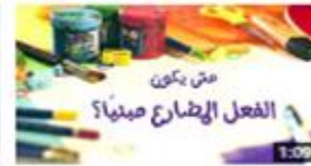
بناء الفعل المضارع 357 views · 3 months ago