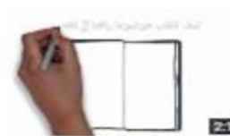
موضوع تعبير: كيف تكتب موضوعًا عن الأناشيء؟ 117 views · 4 days ago