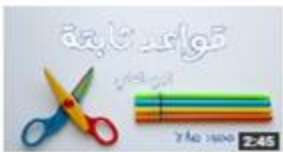
قواعد ثلاثة تساعد في الإعراب الجزء الثاني 195 views · 1 week ago