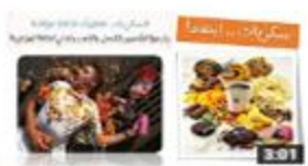
الذاكرة والطعام 46 views · 1 week ago