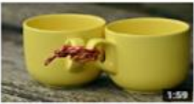
التركيب الكشائي: التركيب النقيض 381 views · 1 month ago