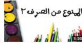
الإسم المنوع من الصرف ٢ 181 views · 3 months ago