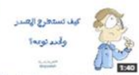
كيف تستخرج المصدر وتحدد نوعه؟ 269 views · 2 months ago