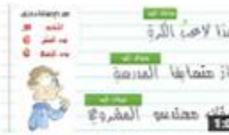
حذف النون سبب الإضافة 123 views · 3 weeks ago