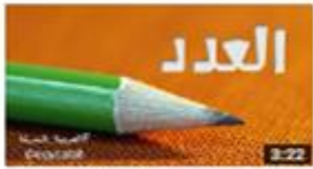
العدد والمعدود: كيف تكتب الأعداد بصورة صحيحة؟ 140 views · 3 weeks ago