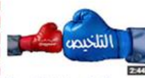
التلخيص: كيف تلخص أيضًا بطريقة صحيحة؟ 276 views · 2 months ago