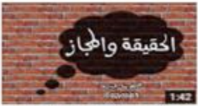
الحقيقة والحجاز - المحل القوي ، المحل الضعيف 588 views · 1 month ago