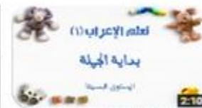
سلسلة تعلم الإعراب (١) بداية الجملة - المستوى البسيط 511 views · 3 months ago