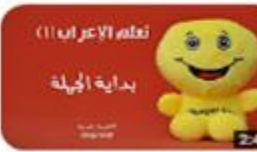
سلسلة تعلم الإعراب (١) بداية الجملة 685 views · 3 months ago