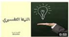
النقطة التفسيرية 348 views · 2 months ago