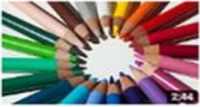
من معاني حروف العر 519 views · 2 months ago