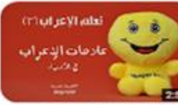
سلسلة تعلم الإعراب (٣) عناصر الإعراب في الإعراب - المستوى البسيط 100 views · 1 month ago