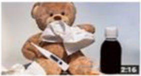
إعراب المضارع معل الآخر 551 views · 3 months ago