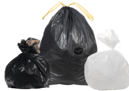
SACS À DÉCHETS