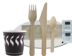
ART DE LA TABLE