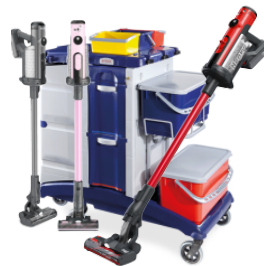
MATÉRIEL ET MACHINES