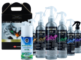
PARFUM D'AMBIANCE DÉSINFECTANT DE L'AIR