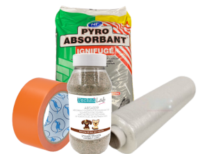
ABSORBANT FILM PALETTE