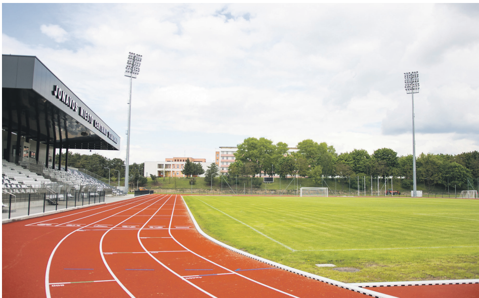
Atnaujintas centrinis Jonavos miesto stadionas