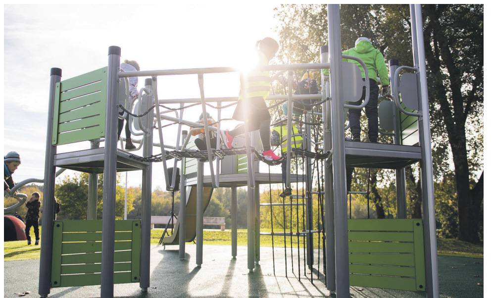
Įrengta vaikų žaidimų aikštelė Paneryje