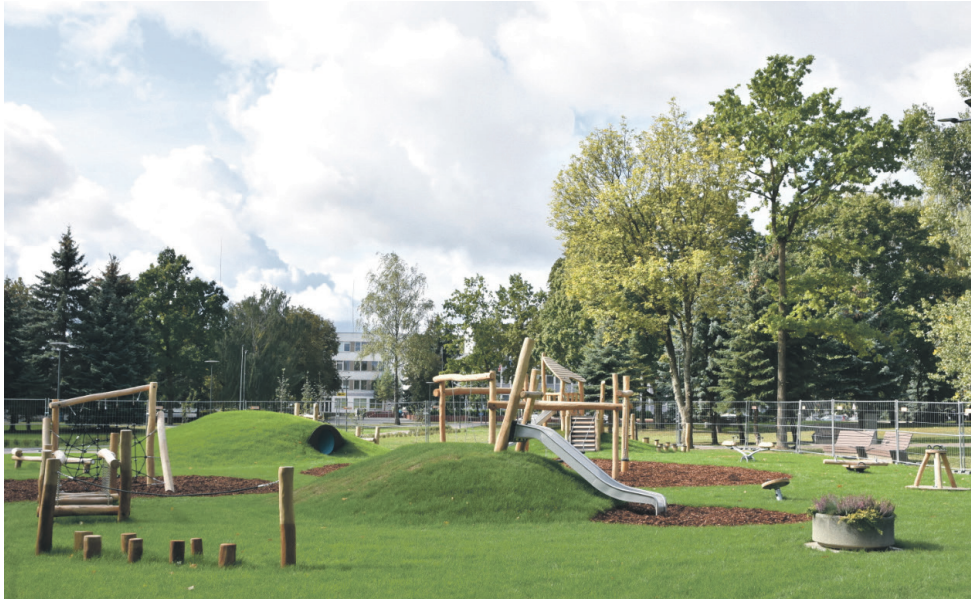
Įrengta žaidimų aikštelė vaikams Ramybės skvere