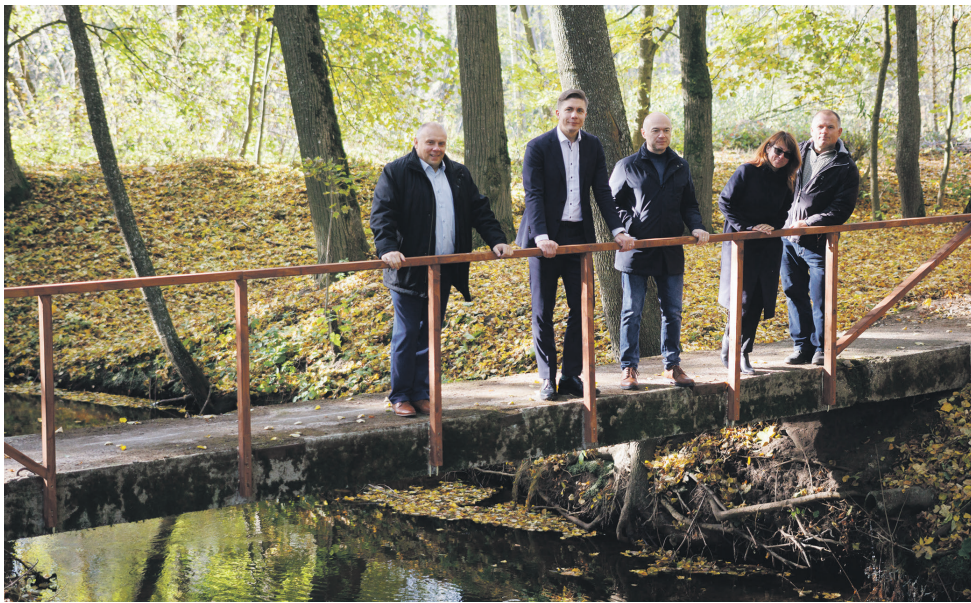
Šilų seniūnijoje atnaujintas Markutiškių parkas