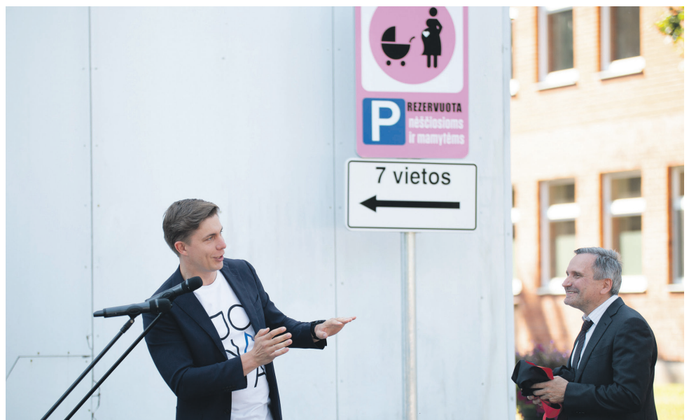
Suremontuota automobilių stovėjimo aikštelė prie ligoninės gimdymo skyriaus