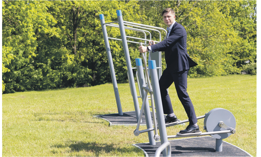
Įrengti nauji lauko treniruokliai Paneryje