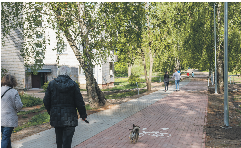
Įrengti pėsčiųjų - dviračių takai Rukloje