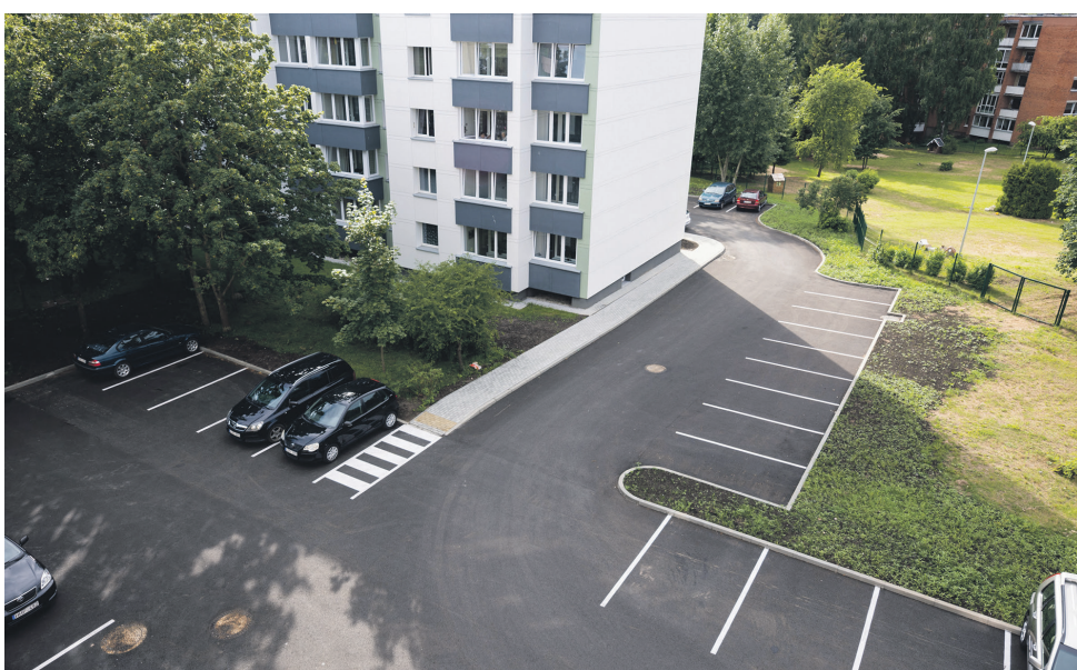
Tvarkomi daugiabučių namų kiemai