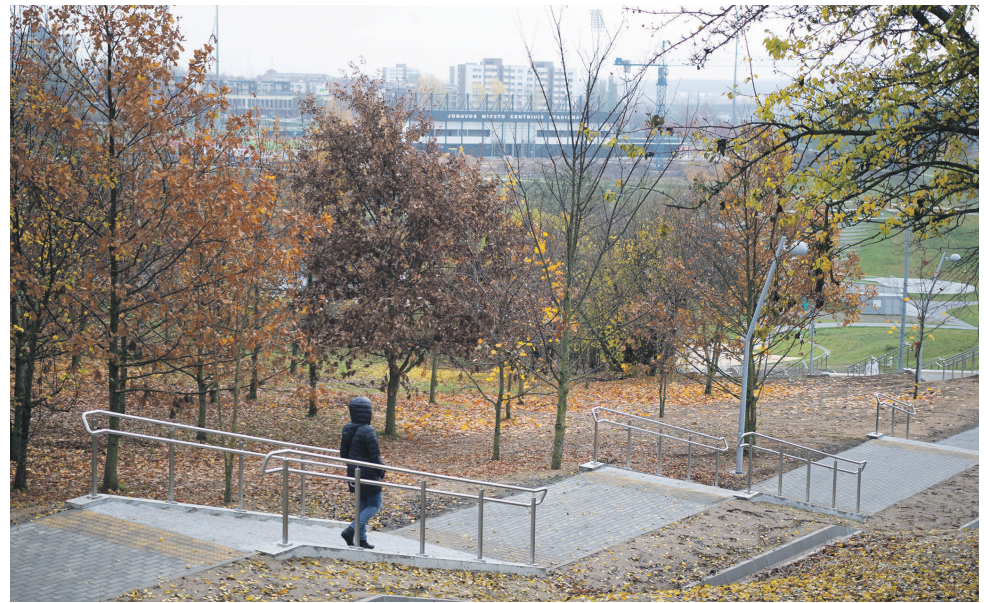
Įrengtas naujas pėsčiųjų takas-laiptai į Rimkus