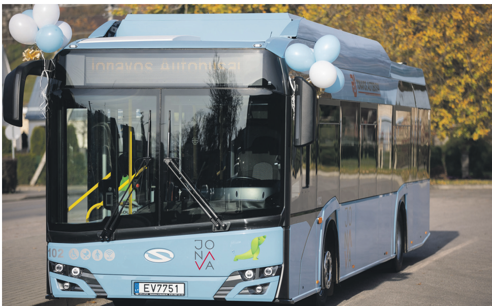
Plečiamas Jonavos autobusų autoparkas