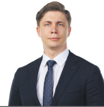
1 MINDAUGAS SINKEVIČIUS