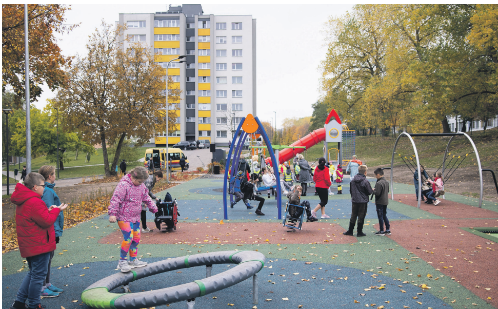
Įrengta vaikų žaidimų aikštelė Kosmonautų gatvėje