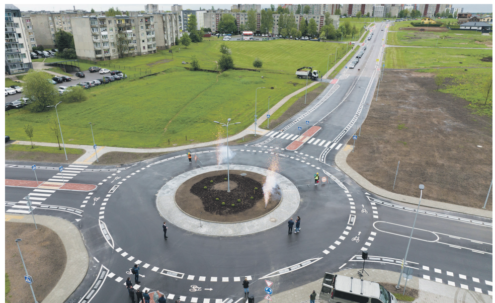
Rekonstruota P. Vaičiūno ir Žemaitės gatvių sankryža