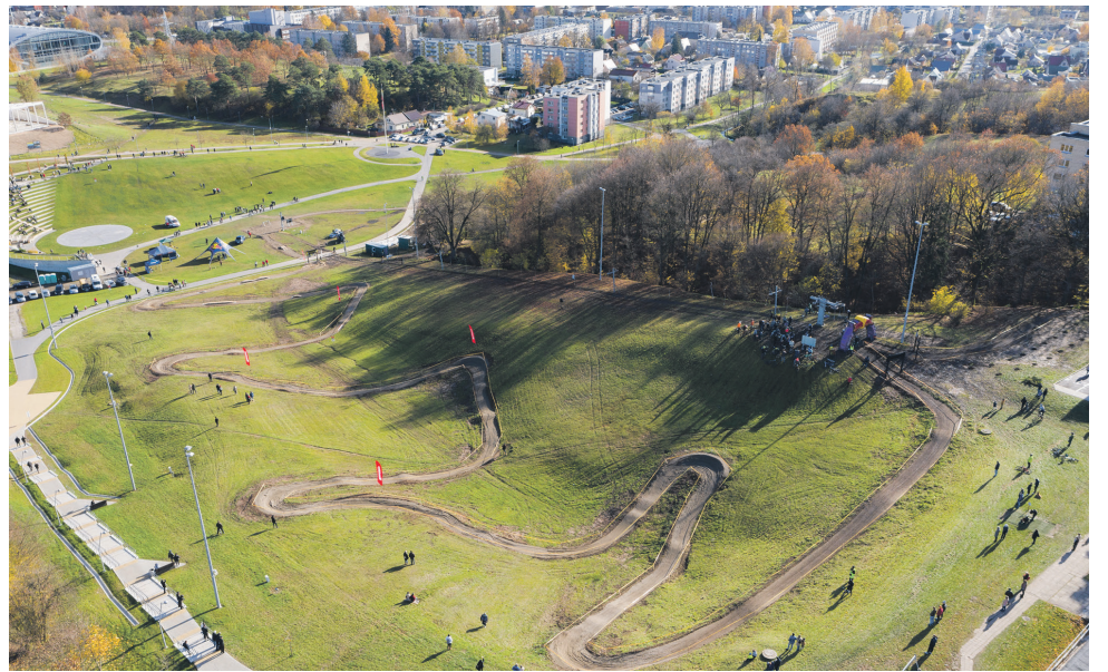
Atidaryta kalnų dviračių trasa