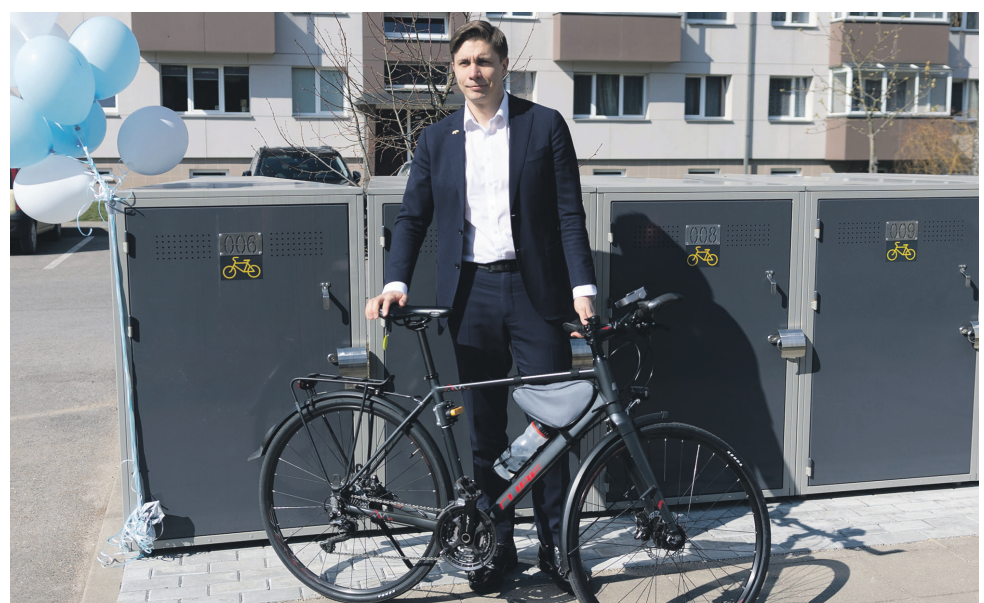
Jonavoje įrengtos dviračių saugyklos