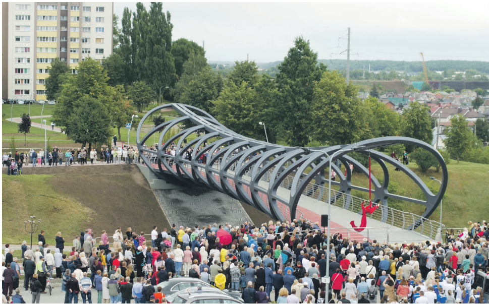
Dviračių-pėsčiųjų tiltas per Žeminių gatvę