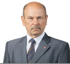
43 ARVYDAS BALČIŪNAS