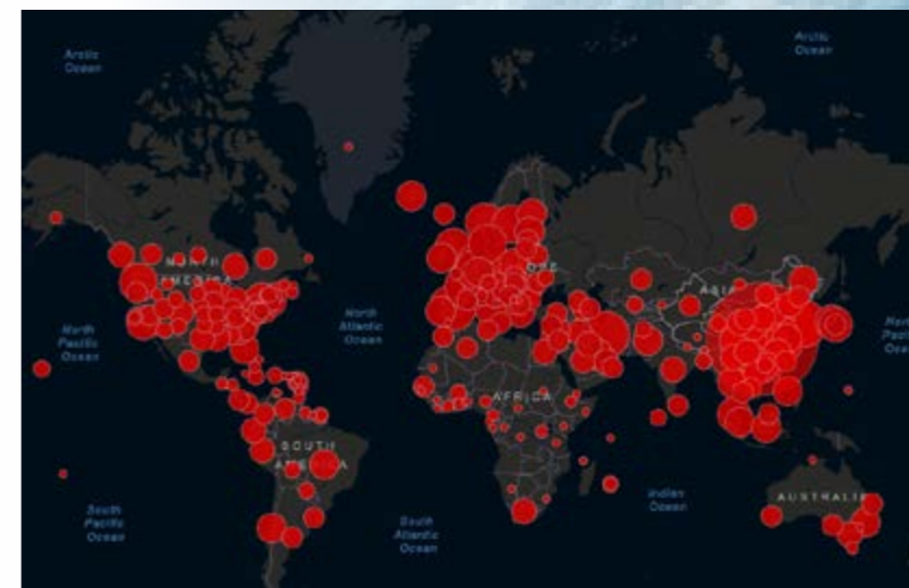
Coronavirus. Mapa 18 de marzo

El colapso de los sistemas de salud ante la crisis se debe a los gobiernos neoliberales de muchos países